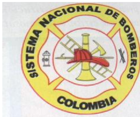
Figura 6. Logotipo Sistema Nacional de Bomberos

El logotipo utilizado por casi todos los países occidentales para identificar a los bomberos, es un escudo en forma circular en cuyo fondo se encuentran las herramientas utilizadas en el desempeño de su labor, como son: Un casco, una escalera, una pértiga, un pitón o corneta, una orquilla y una manguera. Sus colores son el rojo y el negro que presentan el fuego y el humo.