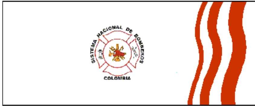
Figura 5. Símbolo de Bomberos

El logotipo utilizado por casi todos los países occidentales para identificar a los bomberos, es un escudo en forma circular en cuyo fondo se encuentran las herramientas utilizadas en el desempeño de su labor, como son: Un casco, una escalera, una pértiga, un pitón o corneta, una orquilla y una manguera. Sus colores son el rojo y el negro que presentan el fuego y el humo.