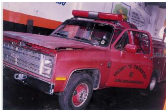
Figura 3. Máquina C-30 de Bomberos de Bucaramanga.