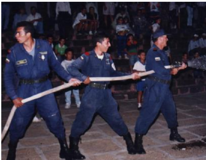
Figura 7. Bomberos de Piedecuesta en Acción