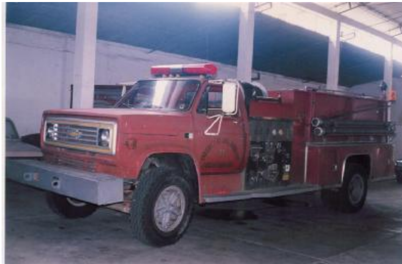
Figura 4. Máquina C-70 Chevrolet

Fue necesario presentar al señor Alcalde, lo mismo que a los Concejales del Municipio de Floridablanca las ventajas que el servicio fuera prestado por los mismo Florideños, al igual que los informes de Gestión de la Contraloría de Bucaramanga que evaluaban en forma deficiente el servicio prestado por el Cuerpo de Bomberos Oficiales de Bucaramanga.