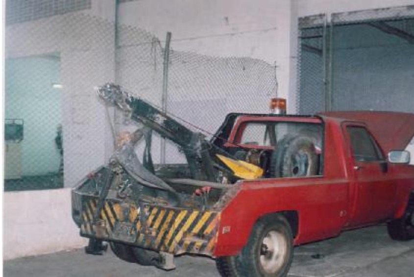
Figura 2. Grúa de Bomberos de Bucaramanga

No sobra aquí decir, que en caso ya sea de incendio declarado o de peligro de éste, la ciudadanía acude en busca de alguna ayuda al Cuerpo de Bomberos, por ser esta la única institución que existe en el área para atender dichos casos, además si se presenta otra emergencia de las anteriormente mencionadas, el Cuerpo de Bomberos actúa en coordinación con otras instituciones tales como la Defensa Civil, la Cruz Roja, etc.