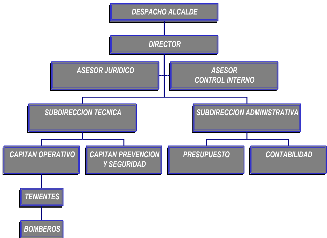
Figura 9. Organigrama actual Bomberos de Bucaramanga

Lo más importante es que en los Cuerpos Voluntarios de Bomberos el personal Administrativo son Bomberos en Comisión en cargos de dirección y manejo, lo que significa que al presentarse las emergencia en caso de necesitarse apoyo, este personal lo brindaría por estar capacitado para ello.