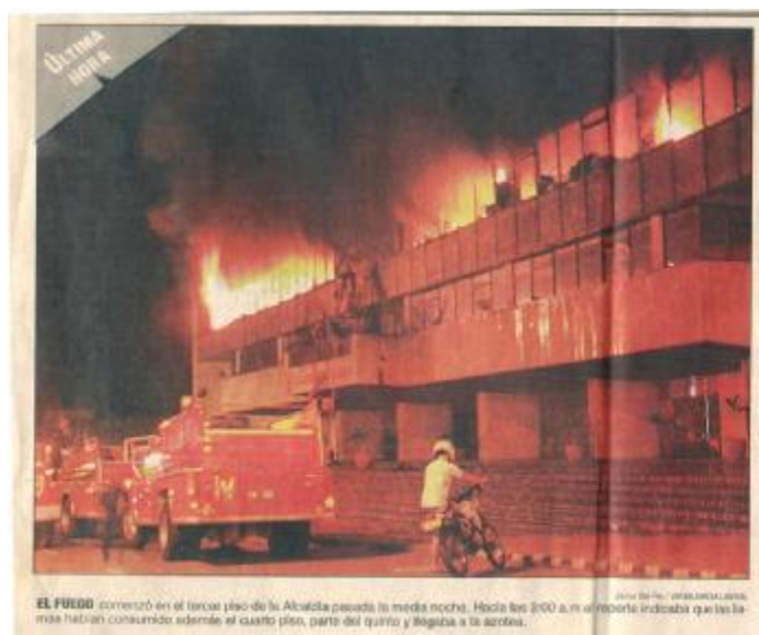
Figura 1. Incendio de la Alcaldía de Bucaramanga