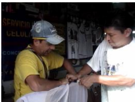
Tensado de la malla o seda suiza