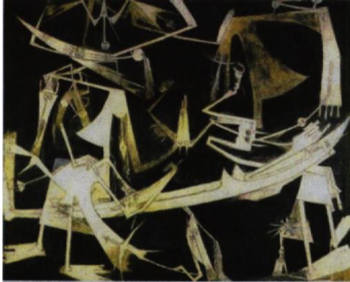
Figura 2. Wilfredo Lam. Tercer Mundo, 1963.

La obra de Lam, con una mezcla de expresionismo y surrealismo, aborda los temas cubanos de una manera muy propia que acuña un estilo en la pintura contemporánea mundial.