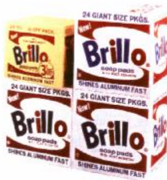
Figura 1. Andy Warhol, Cajas Brillo, pintura sintética y serigrafía sobre madera, 43.2 x 43.2 x 35.6. cada una, 1964

Las imágenes de la publicidad ingresan agresivamente al dominio artístico dando fe de la naturaleza de la realidad Americana 3 .