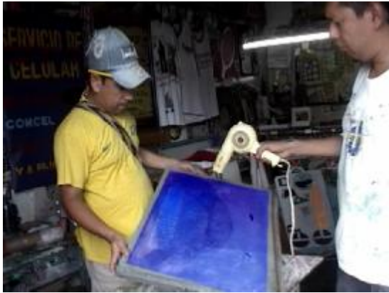
Secado del tamiz o película