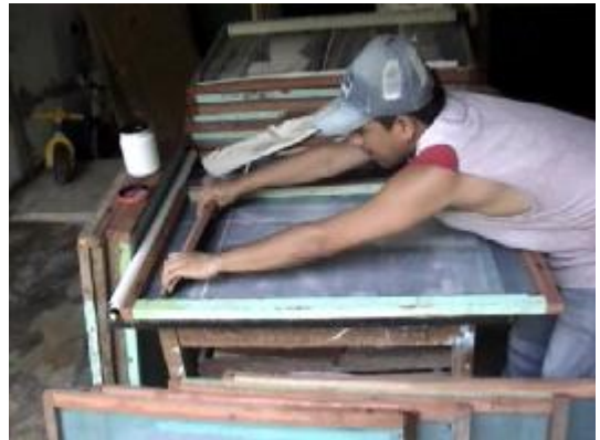
Proceso de estampado de las imágenes

A manera de libreta de apuntes es un documento de apoyo que sirvió para consignar datos, hacer las imágenes preliminares, transcribir citas de autores, notas al margen, descripción de bibliografías específicas, listado de nombres y todo lo que tuvo que ver con el desarrollo de la investigación.