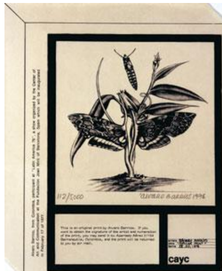
Figura 7. Popular Print 20.9.1976 Offset sobre papel periódico 27 x 22 cm Número ingreso: 2118