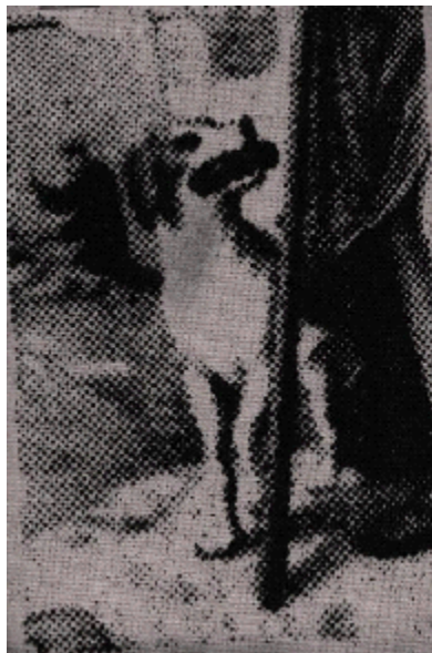
Figura 12. Olfran Guerrero. San Roque (Fragmento) 2006. Serigrafía sobre lona, 13 x 9 cm.

Después de estar ya revelados todos estos tamices, se procede al medio de impresión manual en la lona costeña utilizando así, tinta textil y rasquetas para agregar varias capas de pintura o tinta negra a las imágenes serigráficas. Luego de todo este trabajo, se pega cada una de las lonas impresas, ya recortadas, en los respectivos retablos de MDF con sus marcos en madera, para presentar la obra que se quiere.