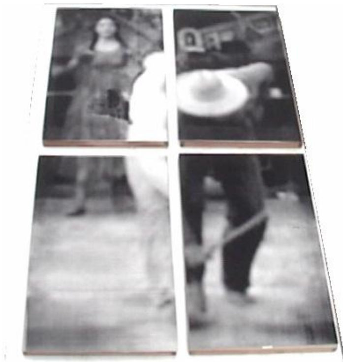
Olfran Guerrero Villamizar La roza, 2006 Serigrafía sobre lona, MDF, madera Dimensiones variables