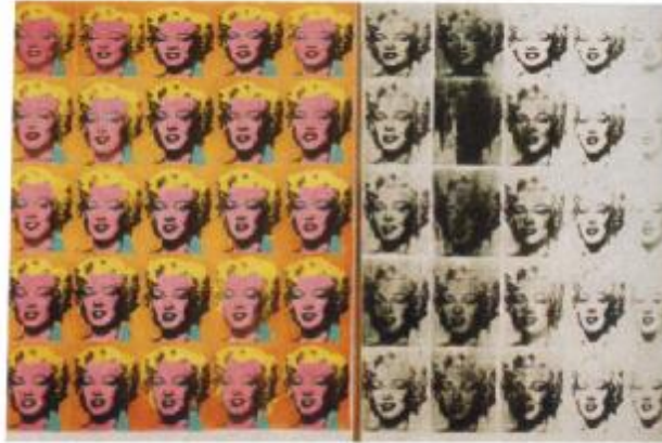
Figura 3. Warhol. Dptico de MArilyn. 1962 Acrílico y serigrafía sobre lienzo.

Entre los artistas más importantes que hacen aportes esenciales, en cuanto a la técnica, para el desempeño de este proyecto, es el más representativo es Andy Warhol, la figura del arte Pop sin lugar a dudas. Una forma de ver la obra de Warhol es dividiéndola en tres períodos: