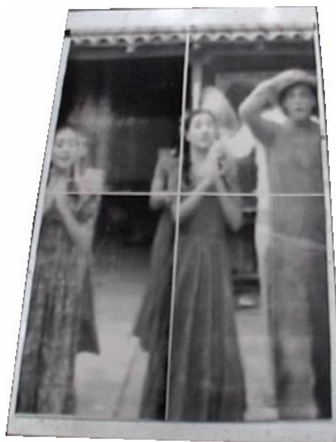
Olfran Guerrero Villamizar La rogativa, 2006 Serigrafía sobre lona, MDF, madera Dimensiones variables