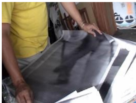
Papel pergamino impreso por medio del ploter de impresión digital