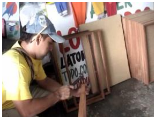
Marco de madera Tolú, se encarga de sostener la malla para ser tensada