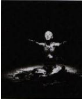
Figura 4. Baldomero Beltrán. Arraigo, 1997

Ahora bien, en la obra de Baldomero todos los materiales han sido minuciosamente escogidos, cada uno tiene su significado particular y está cargado de una energía especial. Es de alguna manera, como un ritual transportado del contexto natural a otro distinto, lo cual implica reestructurarlo para que se sitúe en el ámbito contemporáneo: ritual contemporaneizado. Dichos elementos son los precisos, en el estado requerido y en el sitio exacto. De todas maneras, se corre el riesgo de perder vitalidad, emitiendo sólo débiles y lejanos signos, objetos enfriados de una antigua actividad. Por ello, las acciones corporales y la evocación de dichos actos muchos de ellos cotidianos, ceremonias permanentes en otros espacios que el artista realiza, son enteramente necesarias en el lugar de destino escogido para la puesta en espacio. Se maneja la idea de objeto – conceptual, donde el objeto es reajustado e incorporado en un nuevo diseño, en el que guarda algunas características de su significado y le son dadas otras 8 .