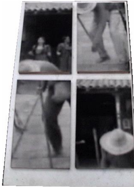
Olfran Guerrero Villamizar La siembra, 2006 Serigrafía sobre lona, MDF, madera Dimensiones variables