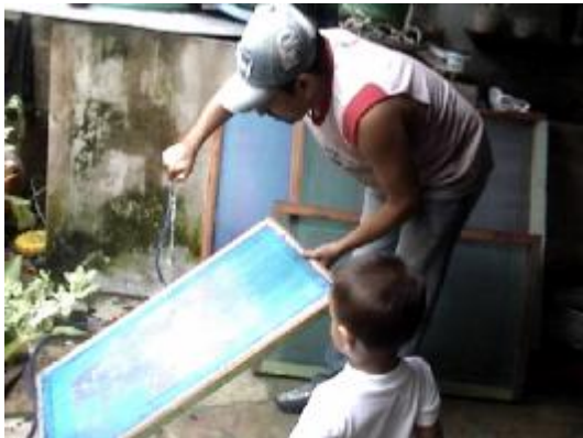
Lavado del tamiz con agua a presión