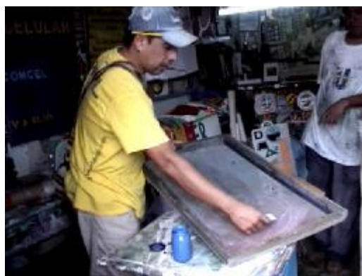
Emulsionado del tamiz