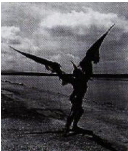
Figura 5. Álvaro Restrepo. La Parte Visible del Alma

En un país como Colombia, sumido en una sangrienta crisis de valores, el cuerpo del hombre ha perdido su dimensión sagrada: diariamente se presenta torturado, mutilado, descompuesto, inerte.