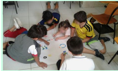
Fotografía 8. Actividad de interiorización, cine arte.