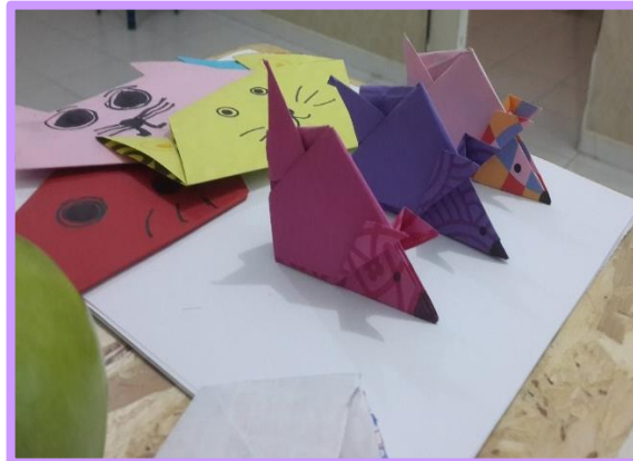
Fotografía 3. Figuras en papel origami elaboradas por los niños y niñas.