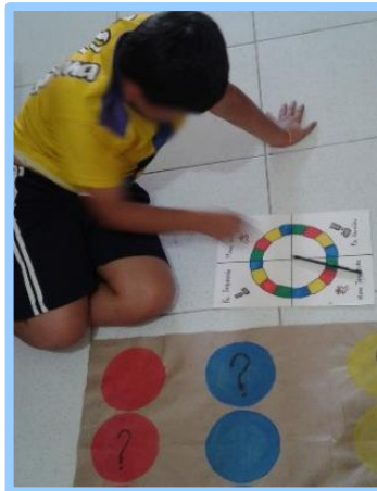
Fotografía 4. Actividad compromiso, Juego “Twister con preguntas y retos”