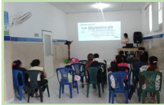
Fotografía 11. Actividad de presentación de la temática