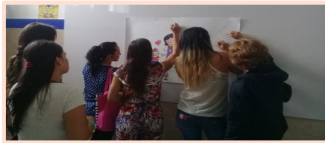
Fotografía 13. Actividad de cierre, “los valores de mi familia”