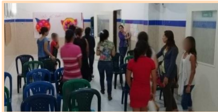
Fotografía 9. Actividad de interiorización, “Concéntrese”