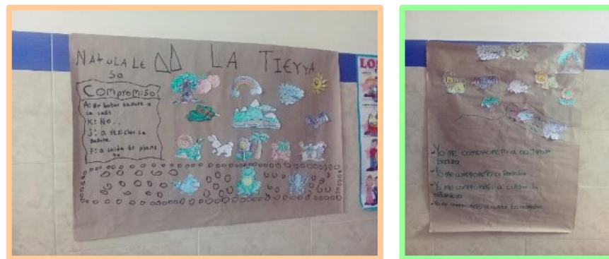
Fotografía 7. Actividad evaluación, Mural “Yo me comprometo”.