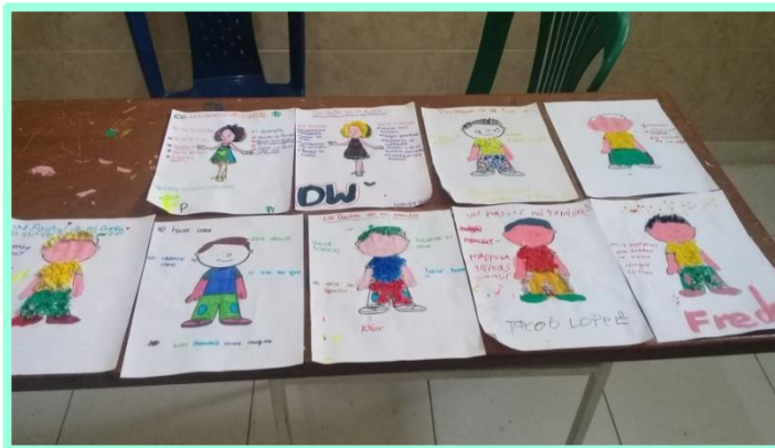
Fotografía 10. Actividad de interiorización, “construyendo normas”