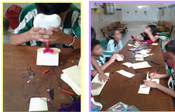
Fotografía 5. Manualidad, “Títeres educados”