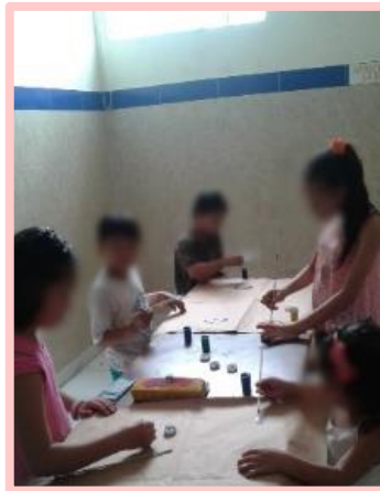
Fotografía 6. Actividad artística, “poniendo color y forma a la emoción”