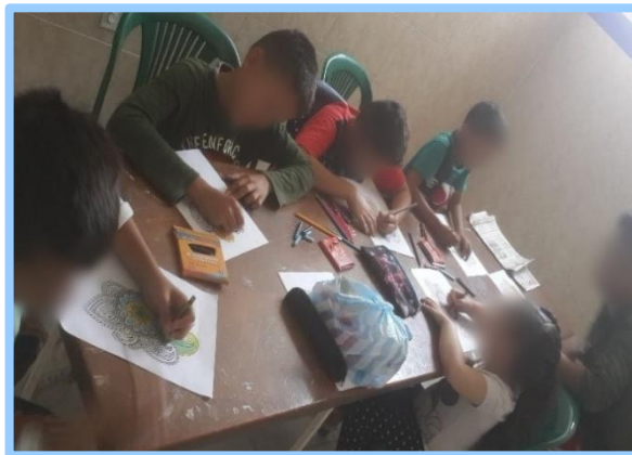
Fotografía 1. Actividad de apertura, colorear mándalas*.