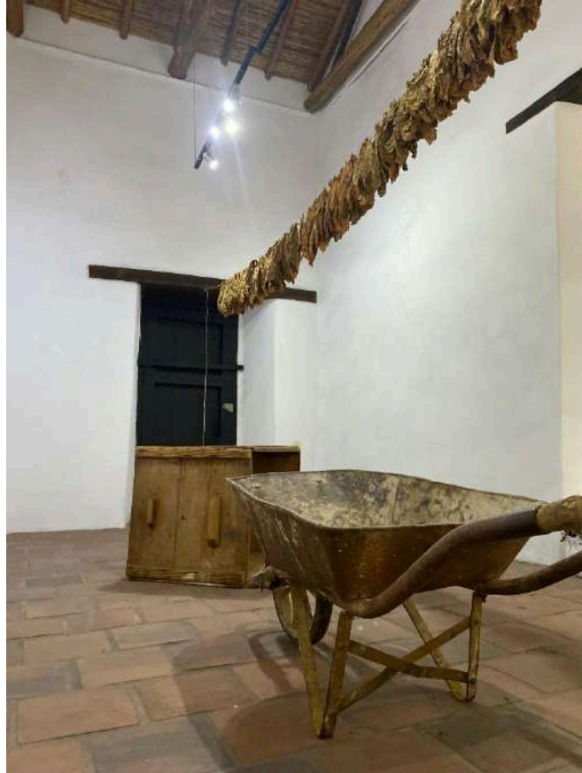
Figura 28. Registro fotográfico en Cuarto colectivo artístico: Broza, fotografías y objetos.