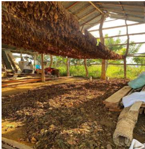
Figura 23: Boceto n1 de creación de la pieza tapete piso con aroma de picadura de tabaco