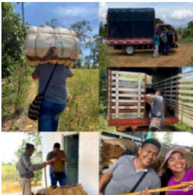
Figura 9 Evidencia del recorrido a la vereda del pozo junto a mi padre.

En el 2021 viajé nuevamente a Floridablanca para continuar con mis estudios en la Universidad Industrial de Santander, después de haber pasado gran parte conociendo más sobre el trabajo del tabaco y a las personas con las cuales mi abuelo trabajó, mi conexión con el tabaco se hizo más fuerte, pude hallar más, no solo la importancia de la textura, el olor, la forma y los colores, sino también a lo importante de rescatar prácticas y saberes ancestrales mientras contemplaba los paisajes en varias caminatas encontré el vínculo entre recorrido, trabajo, hombre, naturaleza y objeto, así fue que surgió mi primera obra círculo de la palabra donde comencé a hilar las conexiones que tenía con lo que me rodeaba.