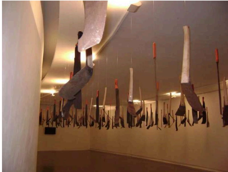
Figura 3 Proyecto los BMR

obra se puede observar 582 machetes que fueron utilizados y desechados por personas que han trabajado durante años en el corte de caña, estas herramientas de trabajo con los nombres bamba, martillo y refilón.