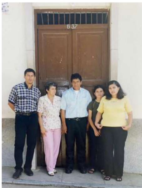
Figura 1 Casa 6-37