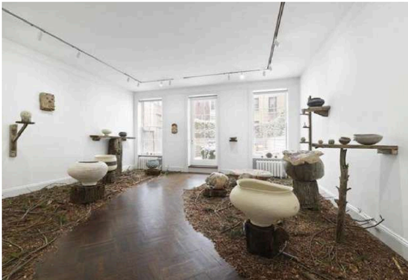
Figura 5 Exhibición de cerámica