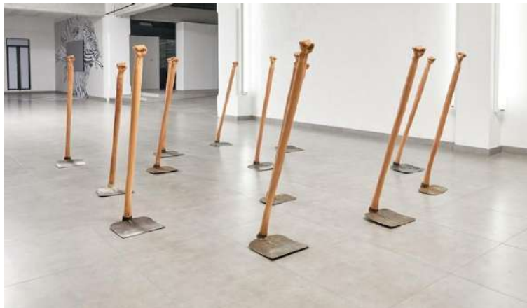
Figura 4 La vida de los objetos

Nora: Tomado de: Mendoza, (2021). Artishock.