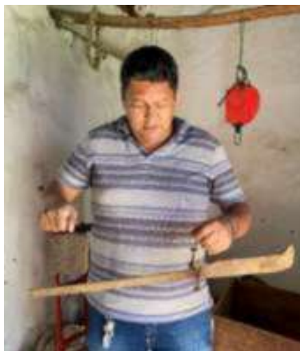
Figura 21 Romana y Pilón