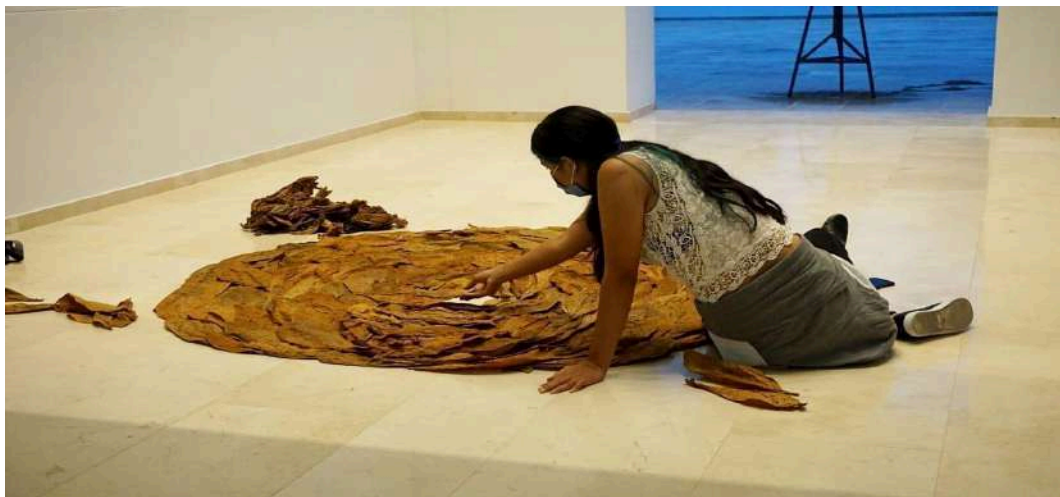
Figura 10. Arte vivo

Mi trabajo siempre ha girado en torno al recorrido, observación y uso de los elementos naturales. Mis vivencias en el campo y luego en la ciudad me han permitido apreciar mucho más lo natural e involucrarme con la representación pictórica e instalación eligiendo los elementos más cercanos como lo es la hoja de tabaco, admiro su olor, textura, color y forma. Veo mi obra como un libro personal donde colecciono objetos, lugares y momentos. Mi intención es exponer la conexión del hombre con la naturaleza, sentimientos o recuerdos. Para esta obra Círculo de la palabra me surgió curiosidad la utilidad del tabaco más allá de ser utilizado para fumar y de sus causas dañinas. El tabaco ha sido usado para