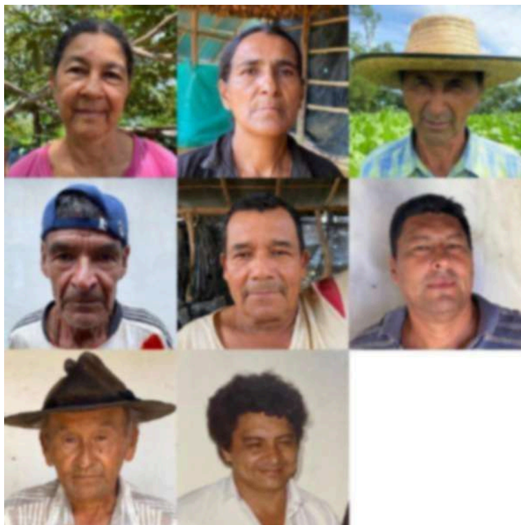
Figura 26. Rostro de los cultivadores de tabaco de Los Santos Santander