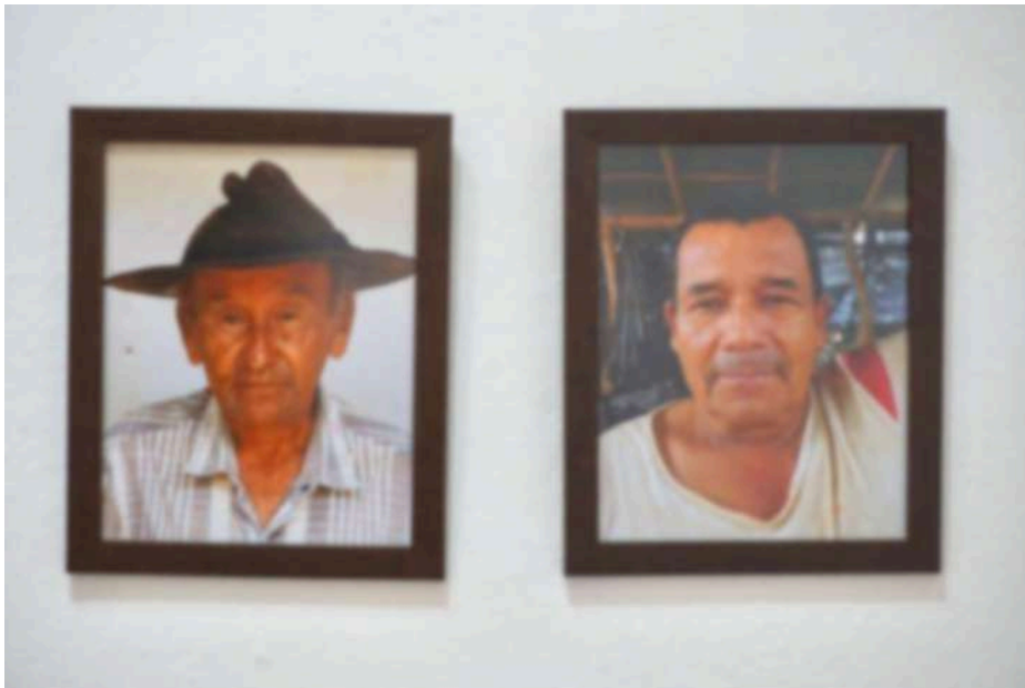
Figura 33. Resultado final de la instalación d