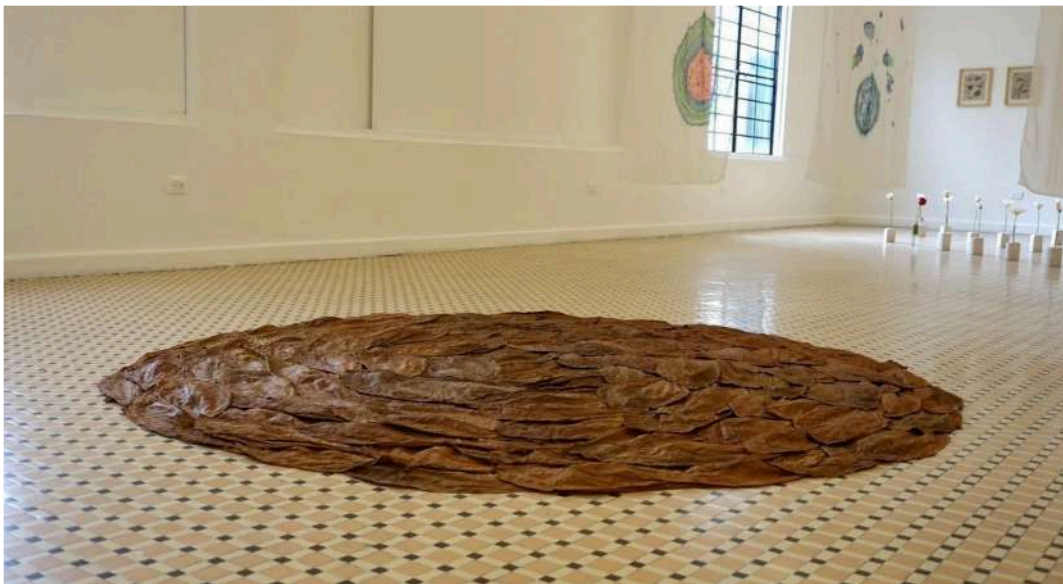
Figura 11 Círculo de la palabra

Mi propuesta artística se compone de varias hojas de tabaco sobre el piso, que al organizarlas unas encima de otras, colocando 3 a 4 capas forman un círculo. La intención es establecer un espacio donde se pueda compartir energías, abriendo mente, cuerpo y espíritu alrededor del elemento natural y sagrado que es el tabaco.