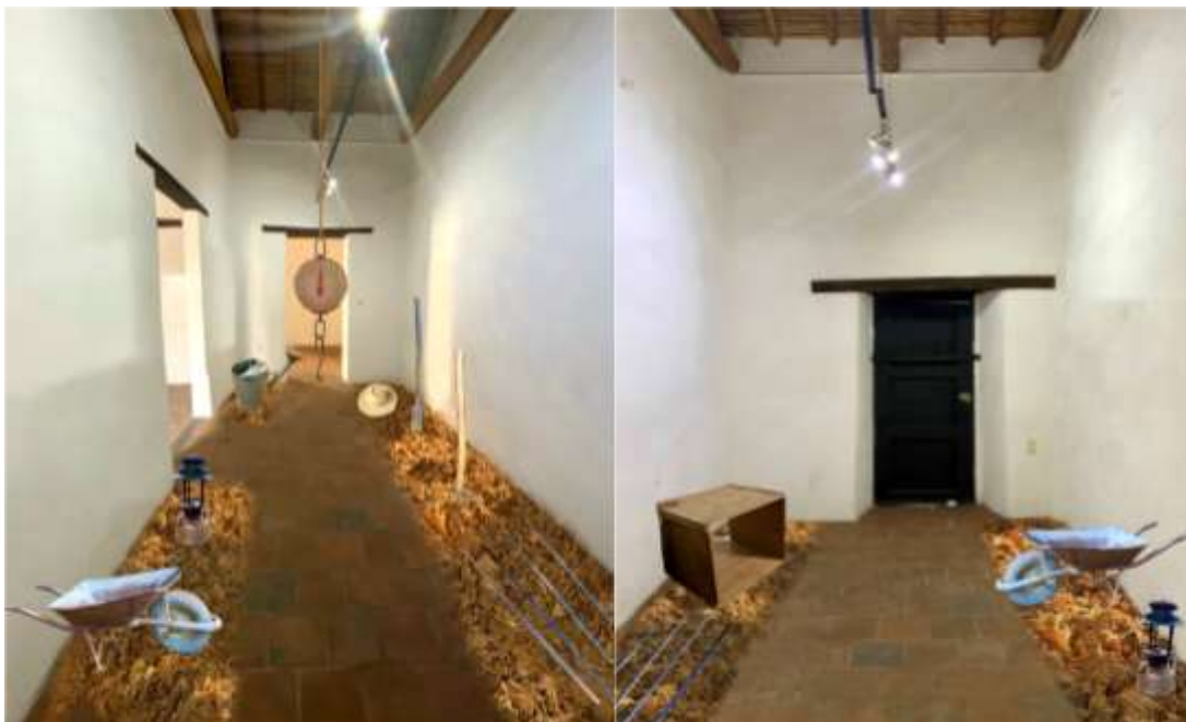
Figura 25: Boceto n3 de creación de la pieza distribución de las piezas y fotografías