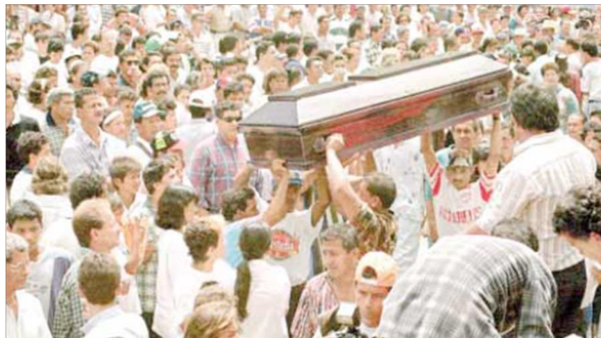
Figura 3. Marcha fúnebre, movilización de familiares, organizaciones sociales y población civil de la ciudad 145 .

“¡Fuera los paramilitares de Barrancabermeja!” 144 .