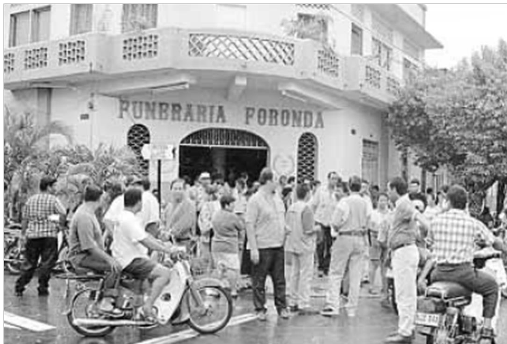
Figura 1. Familiares y comunidad congregados en el proceso de reconocimiento de las víctimas mortales de la incursión 137 .

Muchos aún no tenían conocimiento de los que había sucedido y creían, como lo creyeron muchas de las víctimas, que se trataba de una retención por parte del ejército como era común ver en el sector.