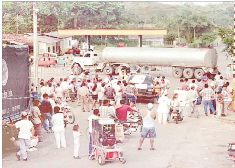
Figura 2. Taponamiento del sector del Retén y congregación de los familiares de las víctimas 141 .

Esta acción reflejó las experiencias históricas de organización popular y sindical que a pesar de intentar ser acalladas por medio de estrategias ilegales se hicieron visibles ante un hecho de violencia de una magnitud que no conocía la ciudad. A pesar del miedo y la zozobra, la comunidad se organizó e inició un proceso de resistencia a la violencia ejercida por el paramilitarismo en complicidad con las fuerzas institucionales. Así, el desarrollo de la protesta en torno al hecho violento en estos espacios se explica por ser puntos neurálgicos y estratégicos que han sido históricamente los espacios públicos de la acción colectiva en la ciudad 140 .