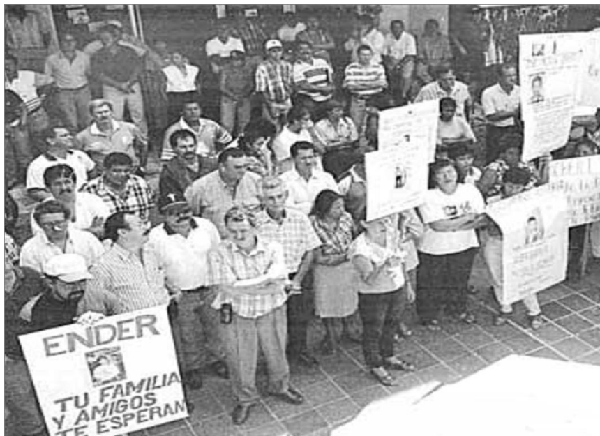
Figura 4. Concentración de los familiares de las víctimas 150

La incidencia que logró el paro cívico como expresión de resistencia de los familiares y pobladores ante este hecho de violencia y como reivindicación frente al Estado mismo, conllevó a que ante la magnitud y alcance de la paralización de una de las economías más importantes del país, las autoridades institucionales llegaran a un compromiso inmediato con familiares y organizaciones garantizando que se activarían los mecanismos pertinentes para la liberación de las personas retenidas y que se levantara el paro cívico 151 .