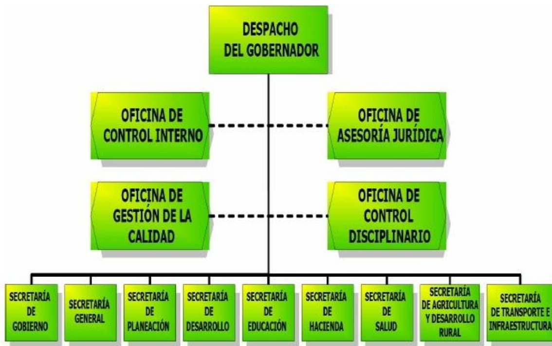
Fig. 1. Organigrama Institucional.