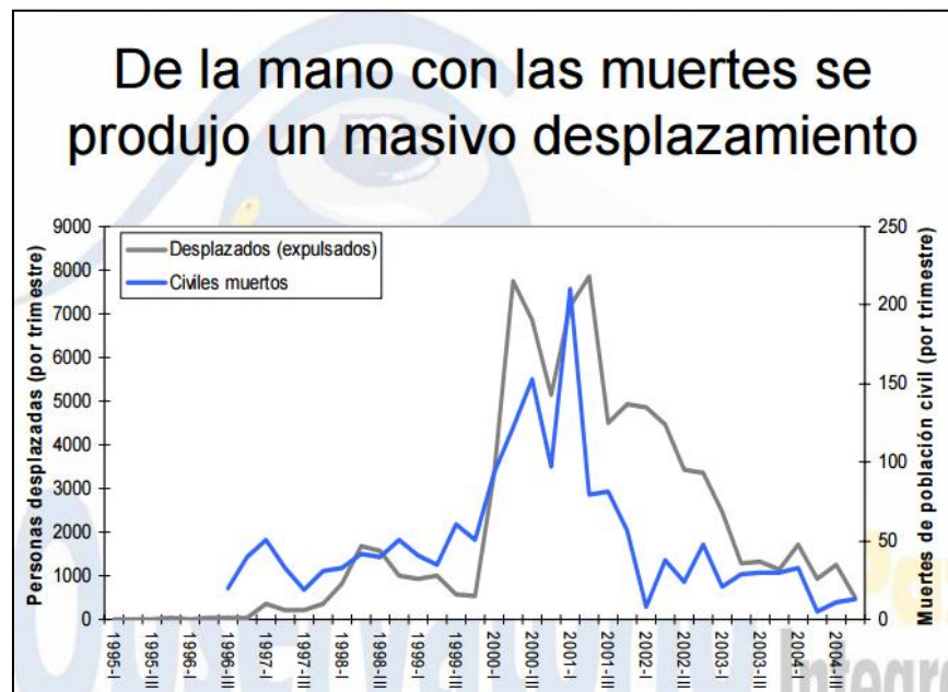
Gráfica 2. Desplazamiento a causa del conflicto armado entre los años 1996 y 2004.