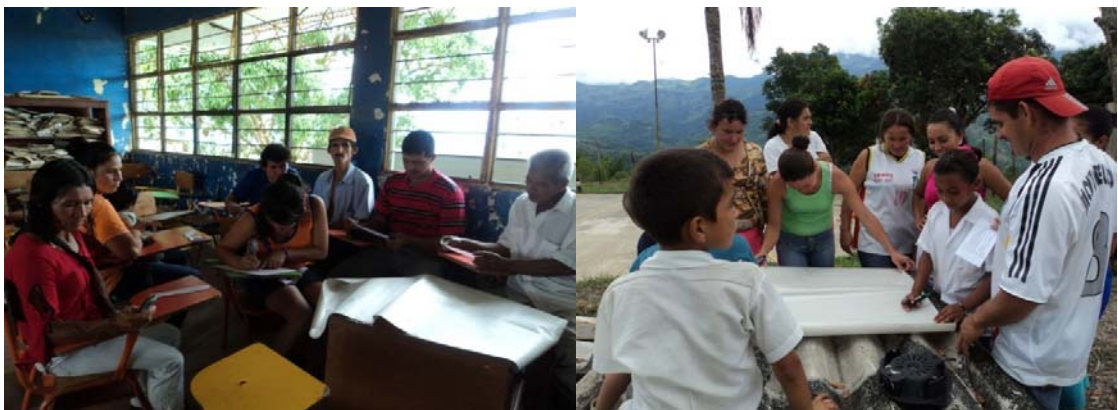
Figura 8. Talleres padres de familia – vereda Montebello

La participación de los padres fue positiva, porque aportaron mucho desde sus experiencias personales, además resaltaron la importancia de realizar este tipo de actividades en las veredas, pues la gran mayoría de las veces esta población es