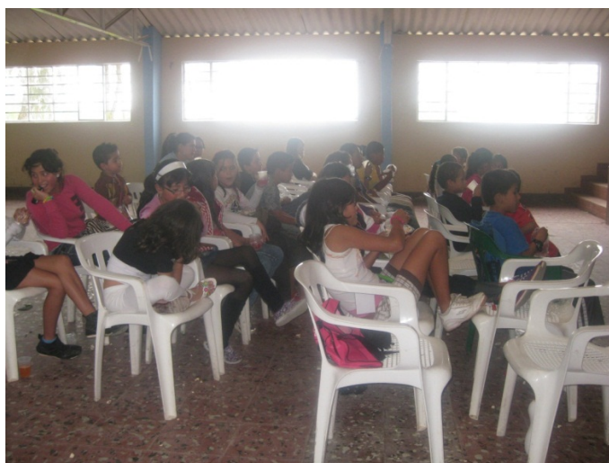
Figura 4. Proyección video sobre el Maltrato Infantil

Otro tema desarrollado fueron los tipos de maltrato infantil, en el primer taller se habló sobre el abuso físico y las clases de abuso físico (golpes, quemaduras,