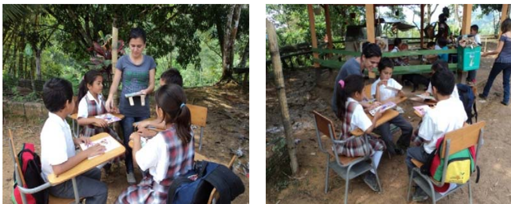
Figura 7. Talleres prevención del Maltrato Infantil – Veredas del Municipio de La Belleza