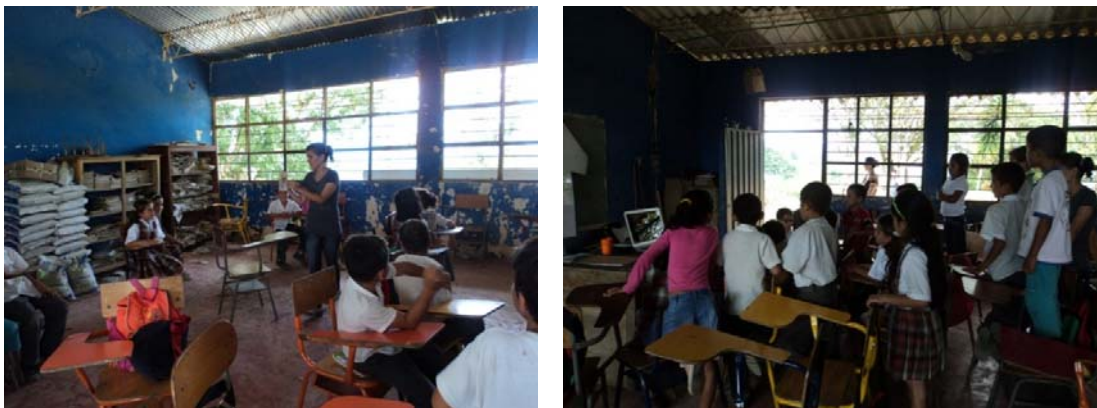
Figura 5. Talleres Niños y Niñas – Centros educativos zona rural del Municipio

Estos talleres, se desarrollaron en el marco de la Política de Construcción de Paz y Convivencia Familiar HAZ PAZ, con el fin de prevenir y atender los casos de violencia intrafamiliar y/o maltrato infantil que se puedan presentar con los niños, niñas, adolescentes y familias del Municipio de La Belleza Santander. Se problematizó y reflexionó sobre los valores y principios democráticos, que son relevantes para resolver conflictos de manera pacífica, lo anterior permitió develar concepciones y creencias que se tenían sobre el maltrato; además, se logró que los niños y niñas se atrevieran a hablar sobre sus temores, realidades e inquietudes, lo cual hace que se valore también el clima de confianza que se generó en los talleres.