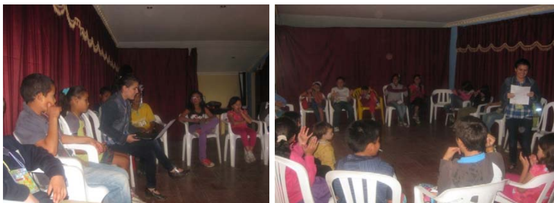
Figura 2. Lectura de Cuentos “El niño que tenía dos ojos” y “La niña sin nombre”

Como los talleres fueron desarrollados con población infantil, se realizaron también actividades lúdicas y recreativas que permitieron la participación de los niños y niñas durante su ejecución, las dramatizaciones, la proyección de películas, las lecturas, los juegos infantiles, las competencias deportivas, los bingos entre otras actividades, permitieron el diálogo de saberes, que se constituyó en una herramienta importante de relacionamiento entre los niños y niñas y la profesional en formación. Se expresaron los saberes frente a los otros gracias a las diferentes realidades vividas por cada uno de ellos, aspecto que permitió la reflexión, la interacción y el esparcimiento sano durante el tiempo en el que se desarrolló el proceso.