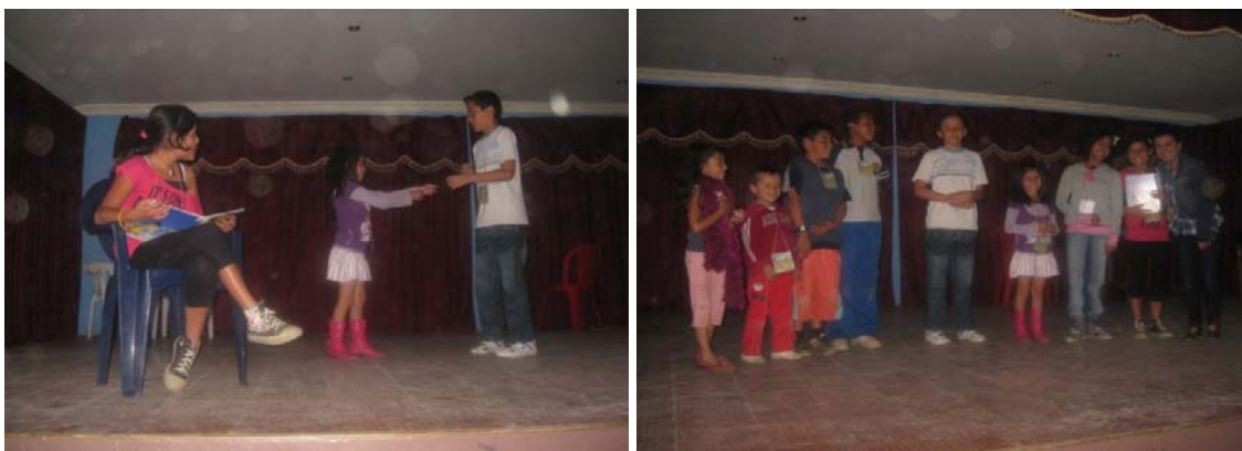
Figura 3. Actividades Lúdicas con los niños y niñas

En los siguientes encuentros se desarrollaron las temáticas propias de maltrato infantil, se trabajó en su definición, a partir de la proyección de un video.