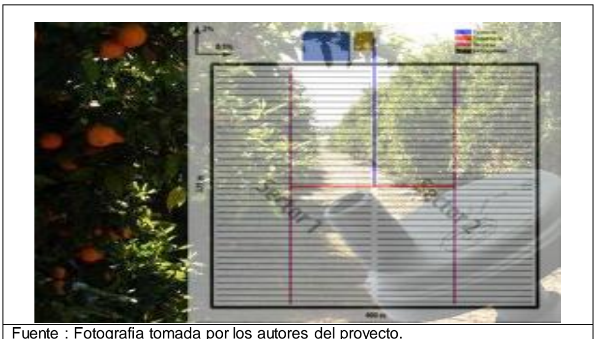
Imagen 17. Formato para distribución modulos de riego.