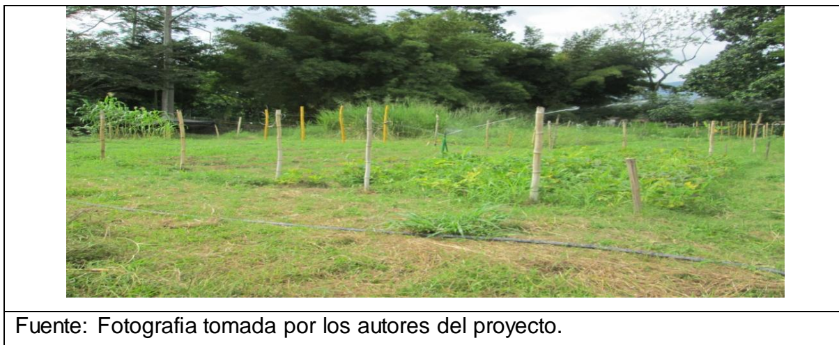
Imagen 10. Modulo reparado.