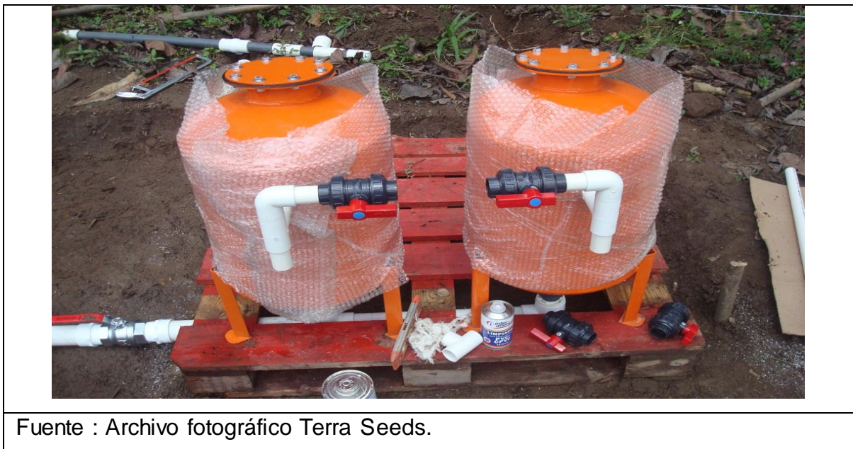
Imagen 13. Sistema de riego convenio Terra Seeds