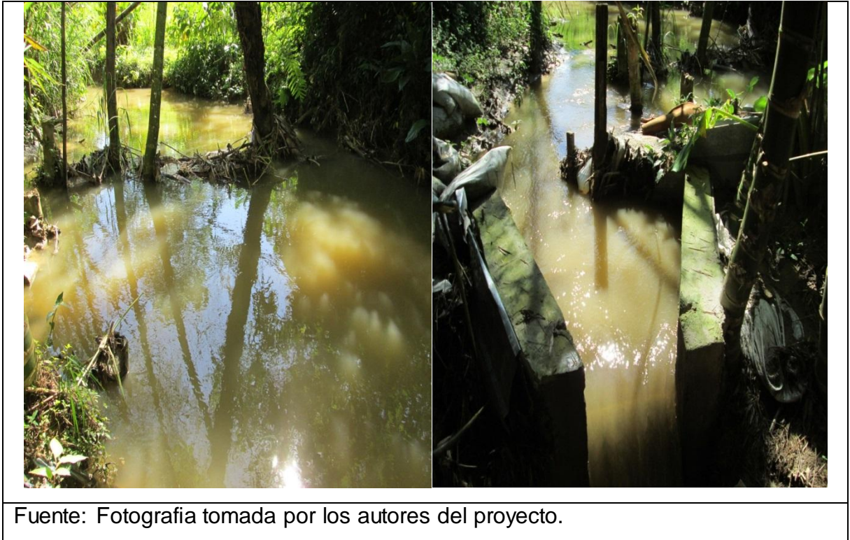
Imagen 3. Sitio antes de la Bocatoma.