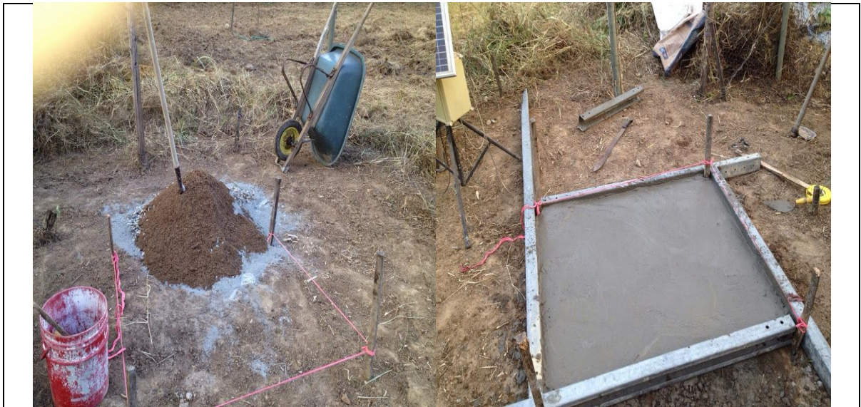
Imagen 15. Construcción base estación meteorológica.