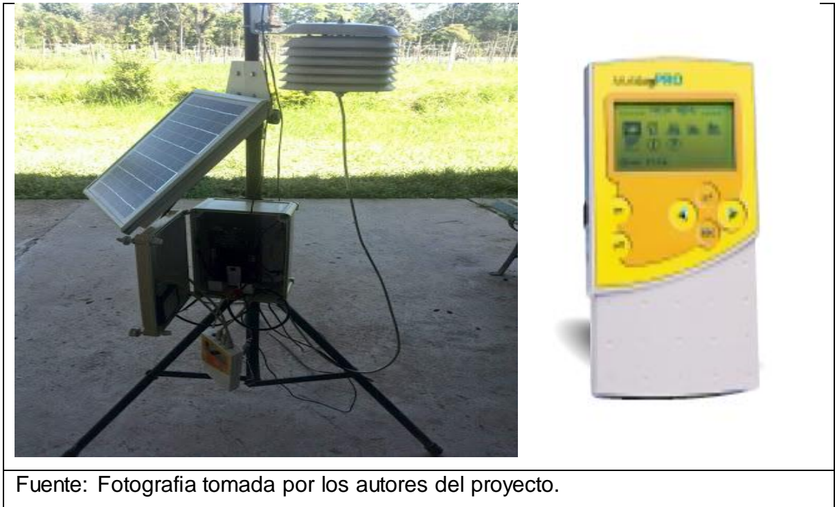
Imagen 16. Estacion meteorológica.