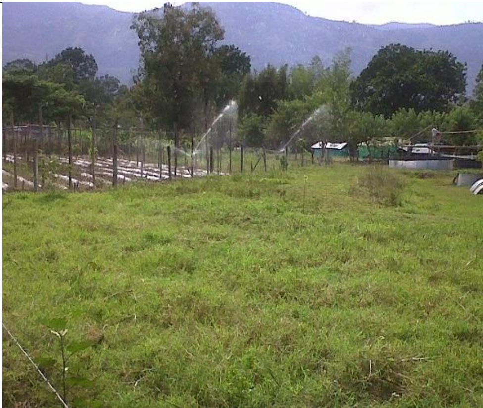
Imagen 12. Banco de proteína.