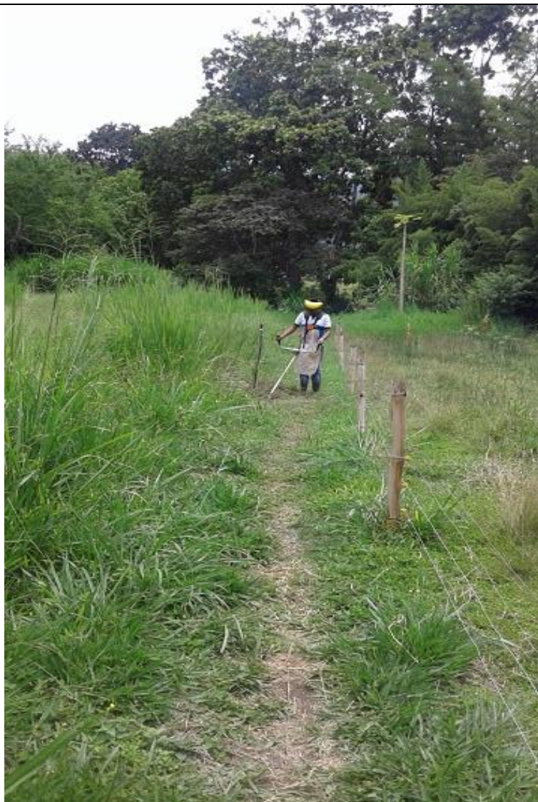
Imagen 8. Despeje de puntos de riego.