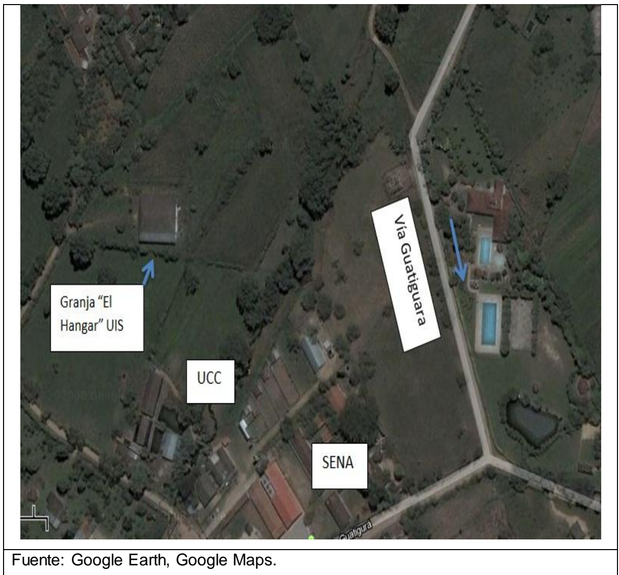
Imagen 2. Fotografía panorámica aérea granja educativa El Hangar.