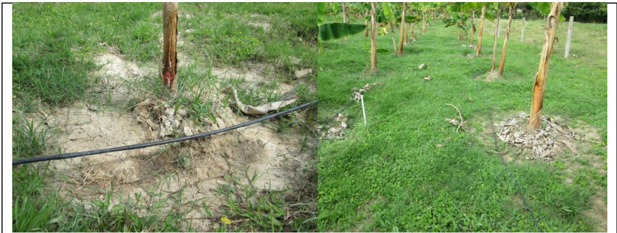
Imagen 11. Goteo en policultivo.