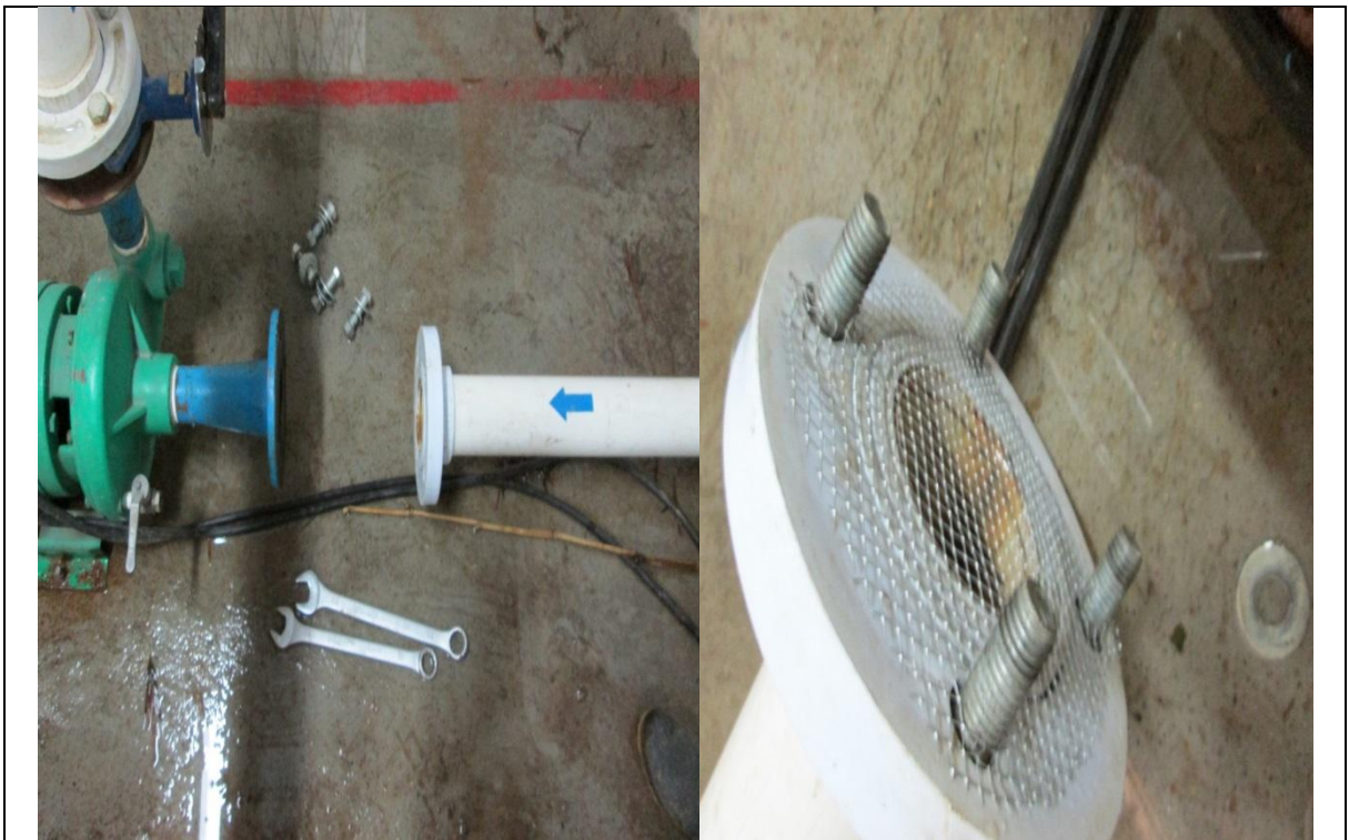
Imagen 7. Limpieza electro bomba.