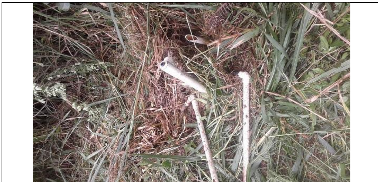
Imagen 9. Modulo descompuesto.