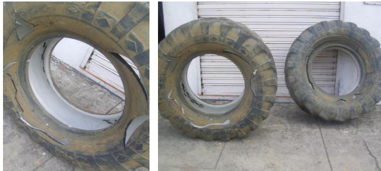
Figura 21. Llantas pintadas por dentro de blanco (continuación)