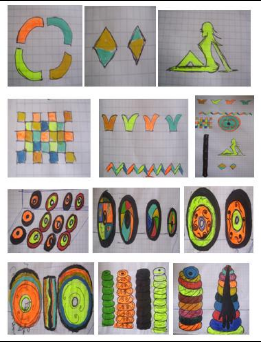
Figura 16. Bocetos que contienen algunos diseños de este trabajo informal