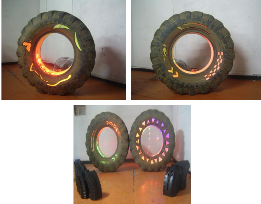
Figura 23. Primeros acercamientos a la obra (continuación)