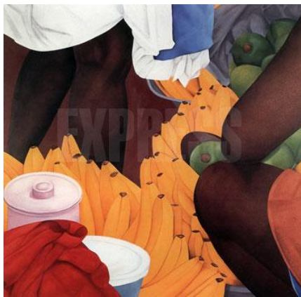
Figura 5. “Bazurto”. Ana Mercedes Hoyos

Fuente: Available from internet: http://www.remediosvaro.biz/ana_mercedes_hoyos.html .