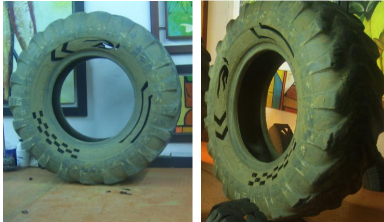
Figura 20. Llantas de tractor con diseño