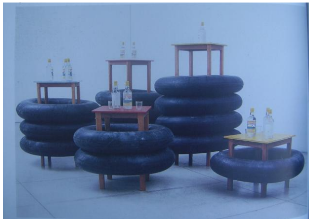
Figura 6. “Deep River”. Marepe.