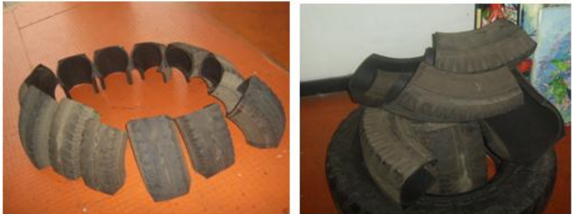
Figura 18. Llantas recortadas

Luego se intervinieron con unos diseños y se cortaron en varias partes cada una, pintándolas de color negro; (ver figura 18).