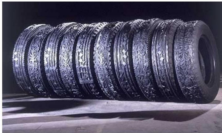
Figura 8. “Tyres” Betsabee Romero