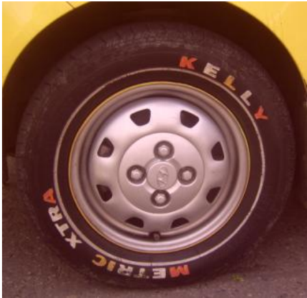
Figura 14. Diseños de llantas