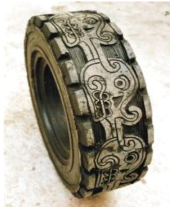
Figura 7. “Memoria en Tránsito”. Betsabee Romero