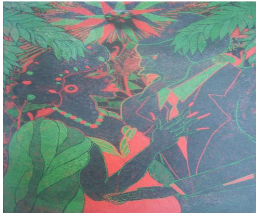
Figura 1. Chris Ofili