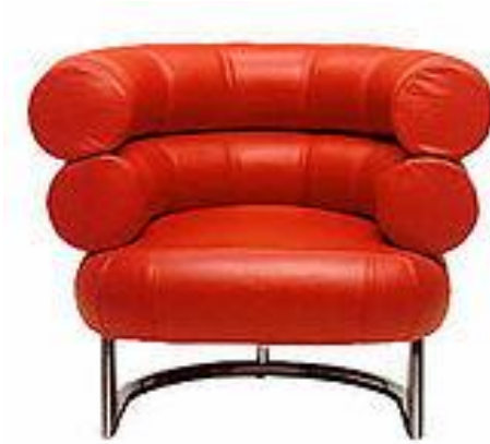
Figura 4. “Bibendumchair” .Kathleen Eileen