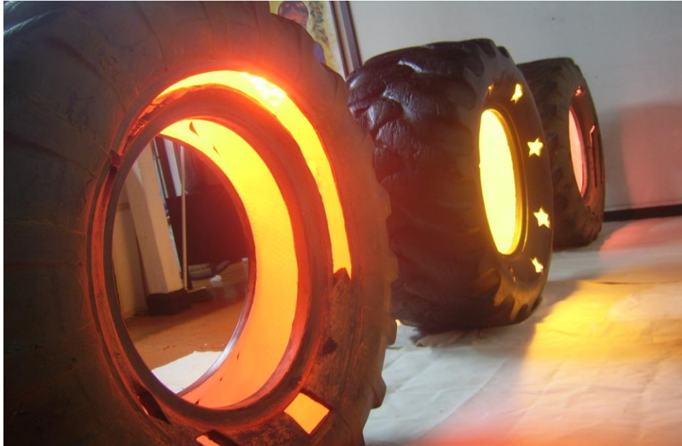
Figura 25. “Sin Medidas” (continuación)