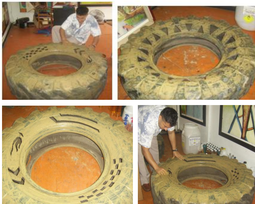
Figura 22. Llantas con barro