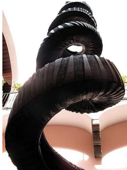
Figura 10. Hasta la última gota” Betsabé Romero