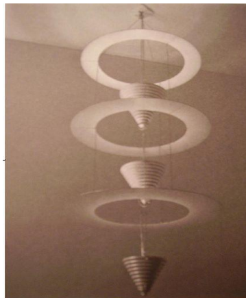
Figura 3. Lámpara Satélite". Kathleen Eileen

Respecto a los trabajos de Kathleen, vemos el impacto que causó el conocimiento de una cultura afro, la cual intervino en su carrera artística, para inclinarse más por el diseño artesanal. (Ver figuras 3 y 4).