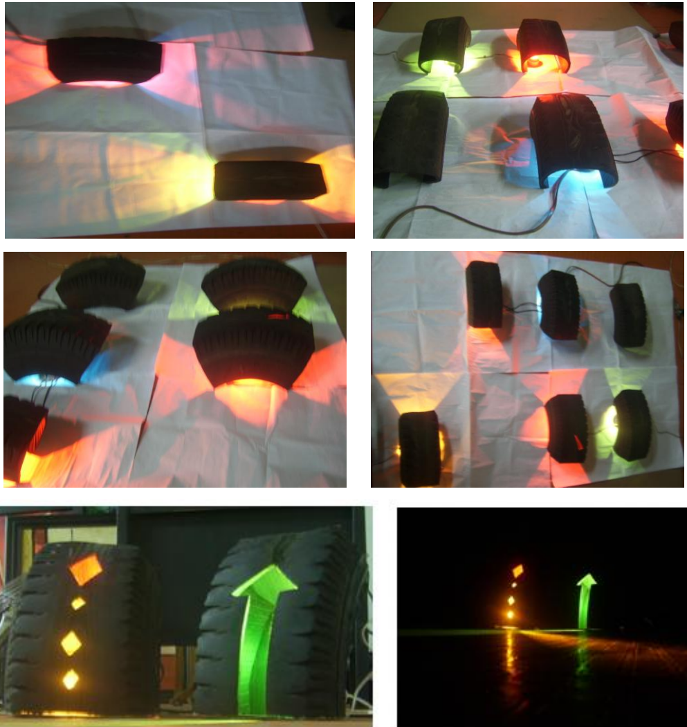
Figura 19. Fragmentos de llantas con iluminación y diseños (continuación)