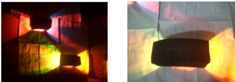
Figura 19. Fragmentos de llantas con iluminación y diseños

Después se vio la necesidad de insertar luces para que se reafirmaran los diseños sobre ellas, y poder hallar un efecto de colores y formas; (ver figura 19).