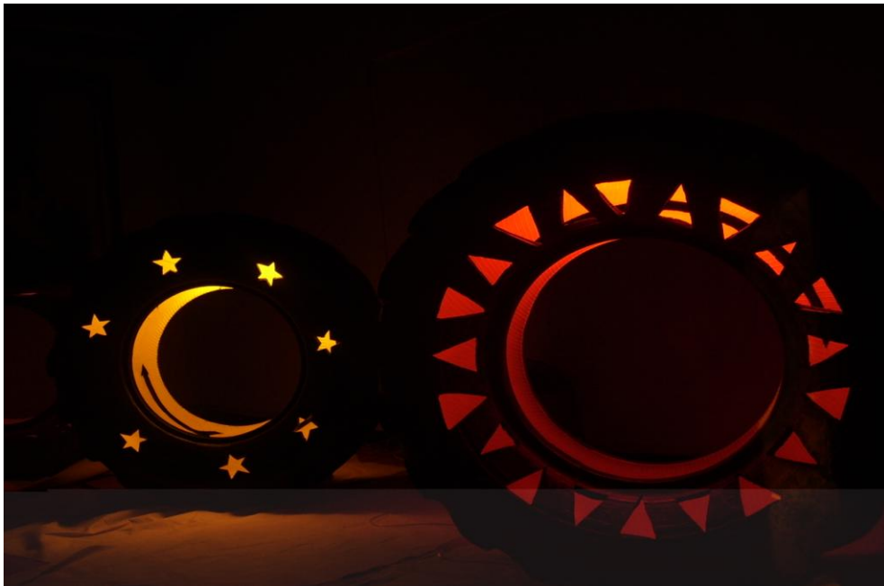
Figura 25. “Sin Medidas”

Finalmente se consigue el efecto deseado, para presentar la obra en un espacio donde sobresalgan sus diseños, ya que son importantes para ella. (Ver figura 25).