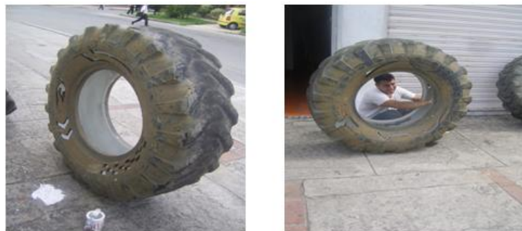
Figura 21. Llantas pintadas por dentro de blanco

pero al no ver el resultado que estas proyectaban, me surgió una nueva idea, que fue pintar de blanco la superficie interna, para conseguir un mejor efecto de color por medio de la luz, obteniendo una mejor presentación en cuanto al decorado, también al limpiar una de las llantas, me di cuenta que su color atterrado era muy rico, ya que me daba una mezcla de color negro y amarillo tierra, procedí a aplicarles una laca, que protegiera su apariencia de usado, sobresaliendo así mas los diseños, exaltando estos objetos por su valor simbólico y funcional, hasta lograr lo que quería dejar ver en ellas. (Ver figuras 21 y 22).