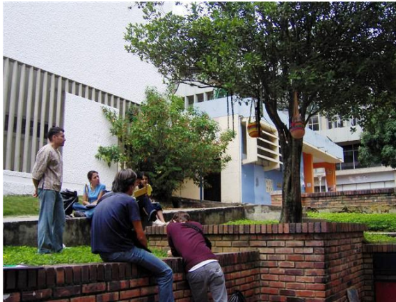
Figura 12. “Tejiendo la vida”

En ocasiones se trabajó con referencia al objeto popular, y el interés fue mostrar un bolso tejido a mano hecho por mi madre, la cual se desempeña en estos oficios; ya que vi, en esta labor una dedicación y amor por lo que se hace. (Ver figura 12).