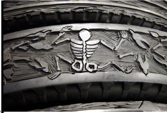
Figura 9. Requien for the unknown pedestrian” Betsabee Romero