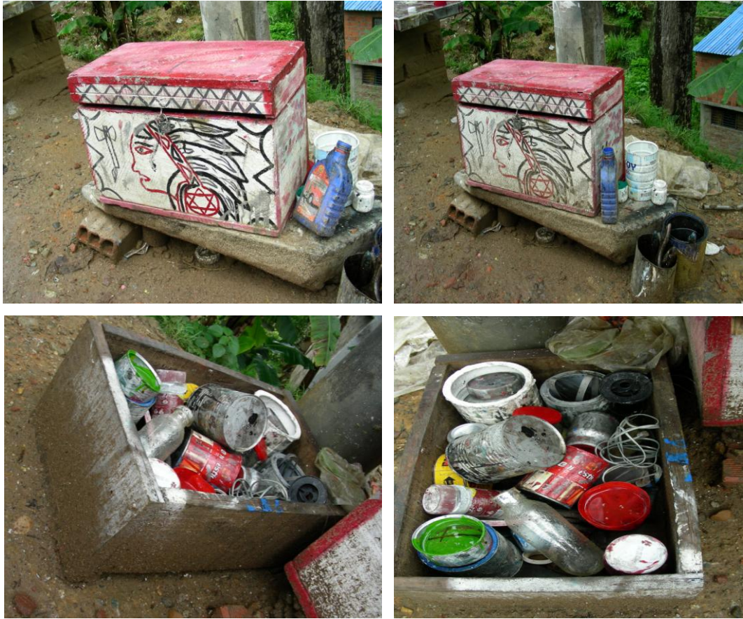
Figura 15. Elementos de trabajo