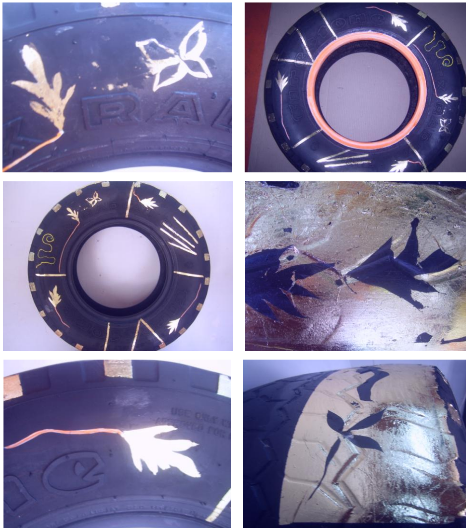
Figura 17. Llantas hojilladas

Para iniciar la obra, se averiguó sobre una clase de llantas de automóvil que no trajeran en su superficie acero, con el fin de empezar a recrear la idea, ya que el fin era trabajar sobre ella de alguna manera, se le hizo un aplique de hojilla sobre ellas, para buscar formas de expresión, consiguiendo unos efectos agradables en cuanto a la apariencia de delicadeza en un objeto tan rústico; (ver figura 17).