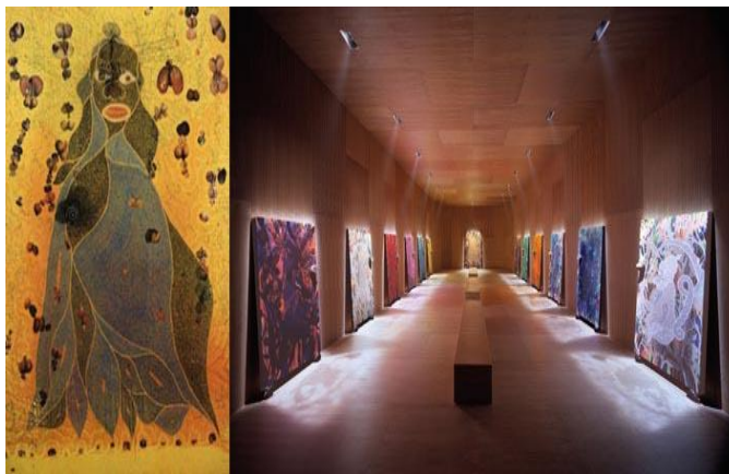
Figura 2. “Santa María La Virgen” 1999 Chris Ofili.