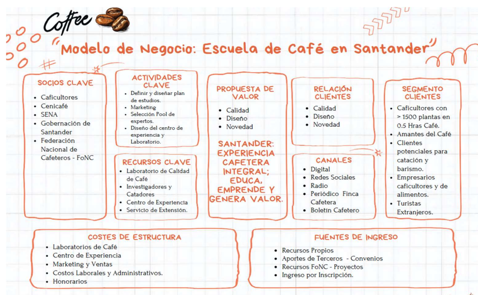
Figura 2. CANVAS

El modelo de negocio de la Escuela de Café en Santander, se observa que la propuesta de valor se fundamenta en ofrecer formación de alta calidad, diseño pedagógico diferenciado y novedad en contenidos, todo ello dirigido a caficultores con unidades productivas, amantes del café, potenciales catadores y baristas, así como empresarios agroalimentarios y turistas extranjeros, se observa que se busca establecer relaciones con los clientes basadas en la calidad