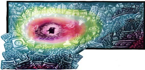
Ilustración de María Rojas.

Aczel caminó hacia el puerto: manchas luminosas reverberaban en el agua. Vio una barca que estaba amarrada al muelle y se subió. Con las manos en los remos comenzó a balancearse hacia adelante y hacia atrás y a soñar con Lena, y de pronto vio la luna que aparecía y desaparecía ante sus ojos, y la siguió.