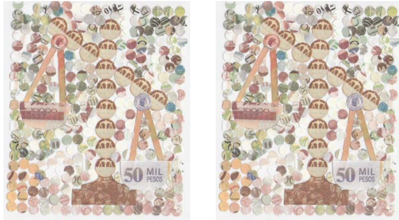
Figura 11. Boceto sin título. Perdomo Otero Fanny Patricia.

collages.15x10 cms. Archivo personal.2007