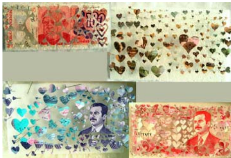
Figura 5. Papel moneda calado y tejido. GONZALEZ MAXIMO

Disponible en: http://www.artidea.com/_mexico/artistas/maxgonzales_workbook.html