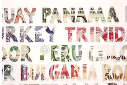
Figura 1. Sin Título. SMITH JUSTIN