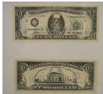
Figura.4 Zero Dollar, [Cero Dollar] 1974-1978. MEIRELES CILDO

MEIRELES CILDO En Brasil en 1970, imprimió en billetes del banco mensajes de rechazo contra el gobierno dictatorial brasileño y contra el autoritarismo, convirtiéndolos así en herramientas de comunicación al margen de cualquier control.