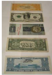
Figura 3. Inserciones en circuitos ideológicos: Proyecto Billeto. MEIRELES CILDO

Disponible en: www.coleccioncisneros.org