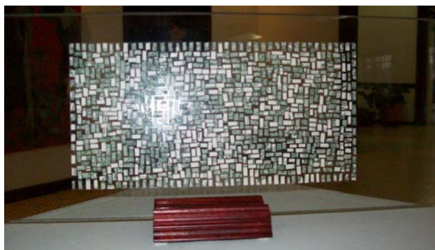
Archivo personal 2007

Siguiendo con la tendencia del collage utilizando como soporte fotocopias de billetes de la moneda colombiana y el interés por los problemas sociales del país, surge el tema de este proyecto titulado “Co-hecho”.