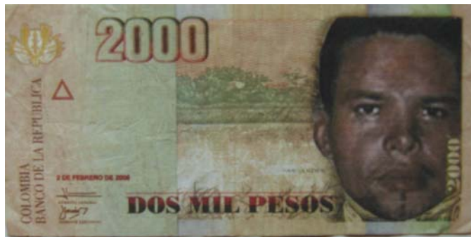
Archivo personal.2007. 14.5x7.5cms

La imagen del general Santander “El hombre de las leyes” es reemplazada por la del narcotraficante Carlos Ramírez Abadía, alias “Chupeta”, quien en contraposición con este personaje es uno de los que al transgredir las normas, se ha visto involucrado en problemas de corrupción en este país. Presuntamente está acusado de asesinato, de narcotráfico y de tener miembros del estado a su servicio. La elección de esta imagen surgió como resultado de una amplia experimentación de color, tamaño, por medio de programas del computador para lograr su similitud con la original del billete y así encajarla por medio del collage en el espacio seleccionado.