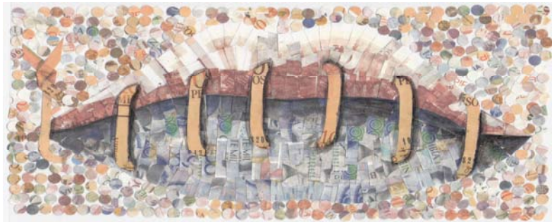
Figura 10. Boceto sin título. Perdomo Otero Fanny Patricia

El proceso plástico se realizó en dos etapas. En la primera construyendo imágenes identificables alusivas a la corrupción, empleando para ellas fragmentos de formas geométricas obtenidas algunas con la perforadora de papel o simplemente recortadas con tijeras o con bisturí, de billetes didácticos de las denominaciones vigentes valiéndonos de su colorido para crear la imagen seleccionada con luces, sombras, volúmenes etc. el soporte utilizado para la construcción de dichas imágenes fueron acetatos, ya que su transparencia permite observar la figura por ambos lados y así utilizar las dos caras de los billetes.