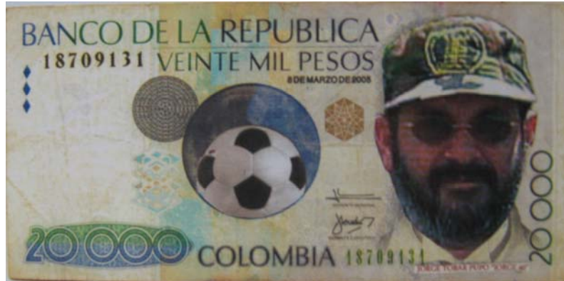
Figura 16. Billete de veinte mil pesos."co-hecho" Perdomo Otero Fanny Patricia