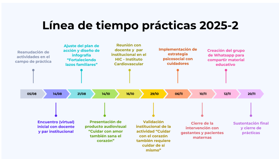
Línea de tiempo del segundo semestre de práctica