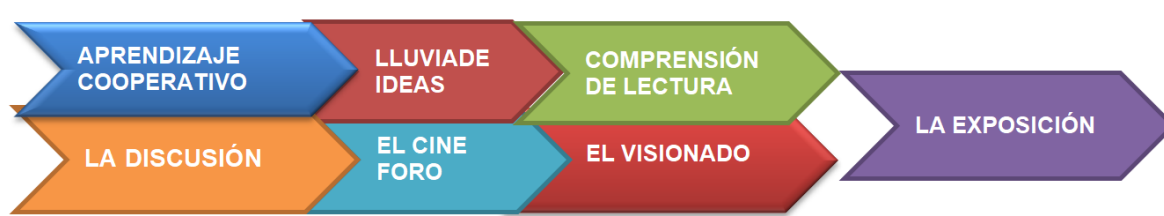
Figura 3. Estrategias