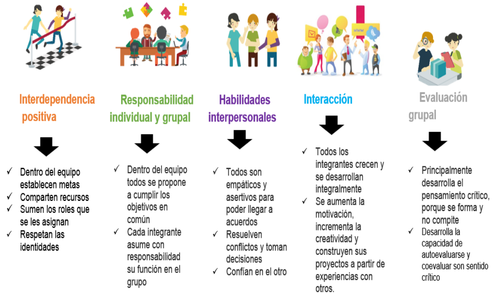
Figura 2. Trabajo colaborativo según la teoría de interdependencia social de Johnson, Johnson y Holubec

Y en cuanto a los roles que se deben desempeñar para un aprendizaje colaborativo, estos autores lo resumen en la siguiente tabla: