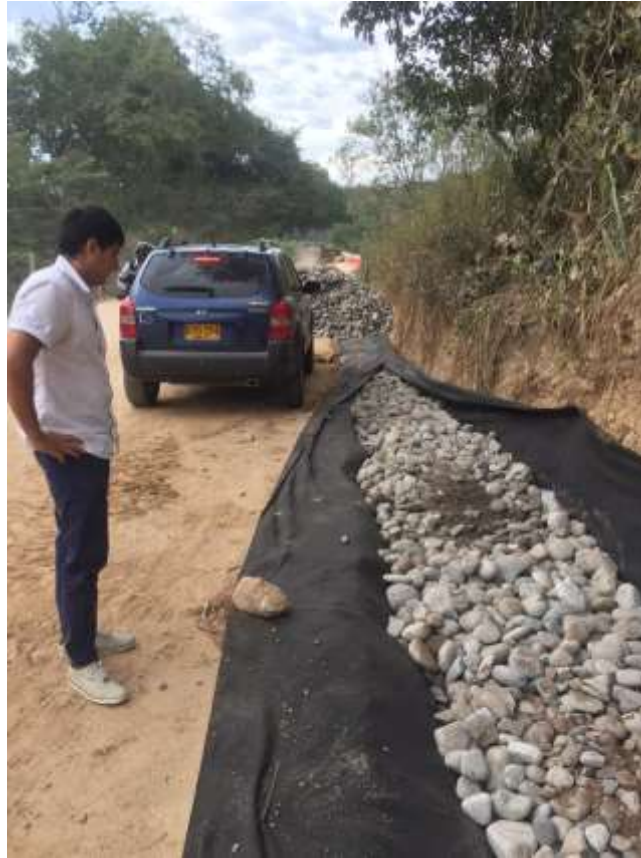
Figura 3. Tramo vial Girón- Zapatoca.

Estas visitas permitieron detallar el proceso constructivo de tres campos de construcción diferentes, permitiendo evaluar la importancia de los proyectos al desarrollo y beneficio de un gran número de personas tanto dentro como fuera de las comunidades directamente involucradas. Además, se evaluó el estado de avance de las obras y se ayudó en las labores de inspección periódicas que debe hacer cada uno de los supervisores de la Gobernación a las obras que tienen a su cargo, verificando que el estado de la obra realmente corresponda con los porcentajes de avance indicados en las actas de entrega parcial, asimismo que los materiales y calidad del proceso constructivo corresponda con los requerimientos pactados en el acuerdo contractual, todo con el fin de que se cumpla con el alcance de los proyectos y tomar medidas correctivas si es el caso.