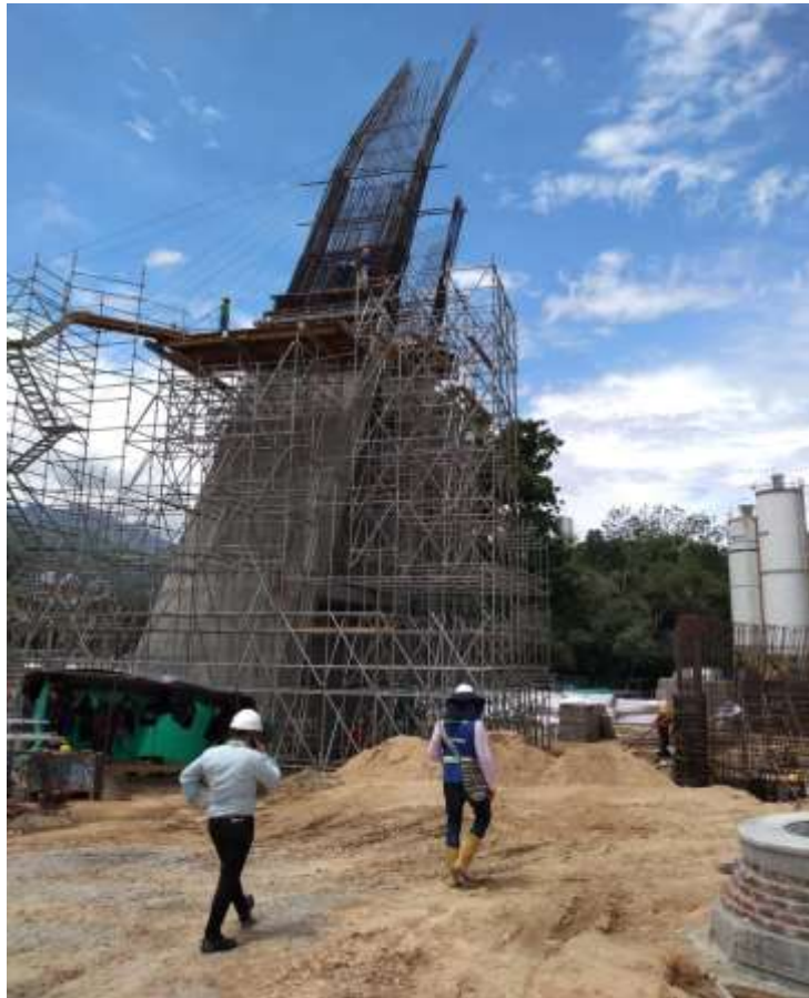
Figura 1. Visita de obra intercambiador de Papi Quiero Piña. Construcción pila puente peatonal.

Otra de las obras que se visitaron fue la construcción de la plaza de mercado del municipio de Zapatoca (Ver Figura 2), donde la Gobernación de Santander se ha esforzado por supervisar y contratar la obra con un diseño novedoso y colonial para este centro económico tan importante para los Zapatoca. A la par se construirán locales comerciales y ejecución de espacio público tipo colonial.