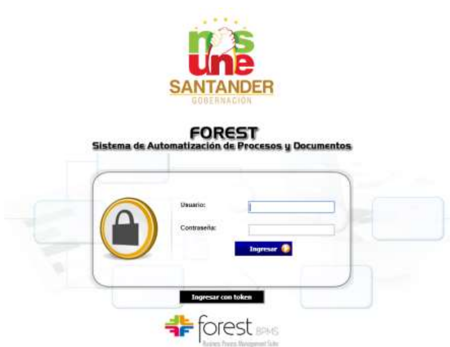
Figura 4. Plataforma de acceso de funcionarios al sistema Forest.

Se realizó apoyo a la revisión, análisis y oportuna respuesta a las distintas solicitudes de información por parte de la comunidad, veedurías, contratistas y demás actores relacionados con la ejecución de distintas obras civiles en proceso de construcción o adelantadas durante la actual administración departamental. Como resultado, durante el desarrollo de la práctica, se dio trámite y respuesta a más de 100 solicitudes (Ver listado ejemplo en Figura 5). Con el apoyo y conocimiento que cada uno de los supervisores tenían de las obras a su cargo y según las indicaciones dadas por ellos, se elaboraron y radicaron las respuestas a cada petición con el propósito de atender oportunamente a la ciudadanía.