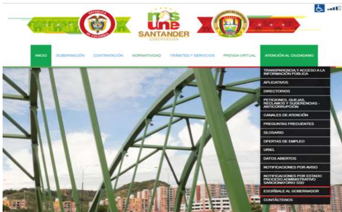
Figura 8. Atención al ciudadano.