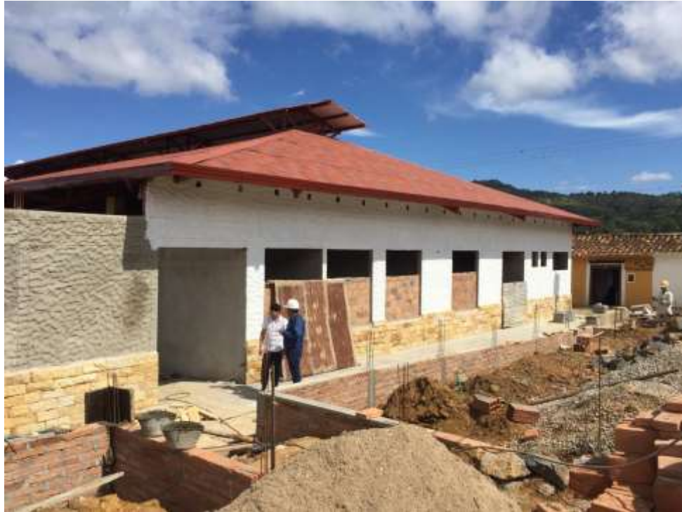
Figura 2. Plaza de Mercado de Zapatoca.

Por último, se realizó acompañamiento a las obras de pavimentación de la vía Girón – Zapatoca (Ver Figura 3); este corredor vial es de vital importancia para el desarrollo turístico de la región ya que comunica al área metropolitana de Bucaramanga con un municipio de tradición turística como lo es Zapatoca, además en su recorrido, atraviesa parte del imponente cañón del río Sogamoso.