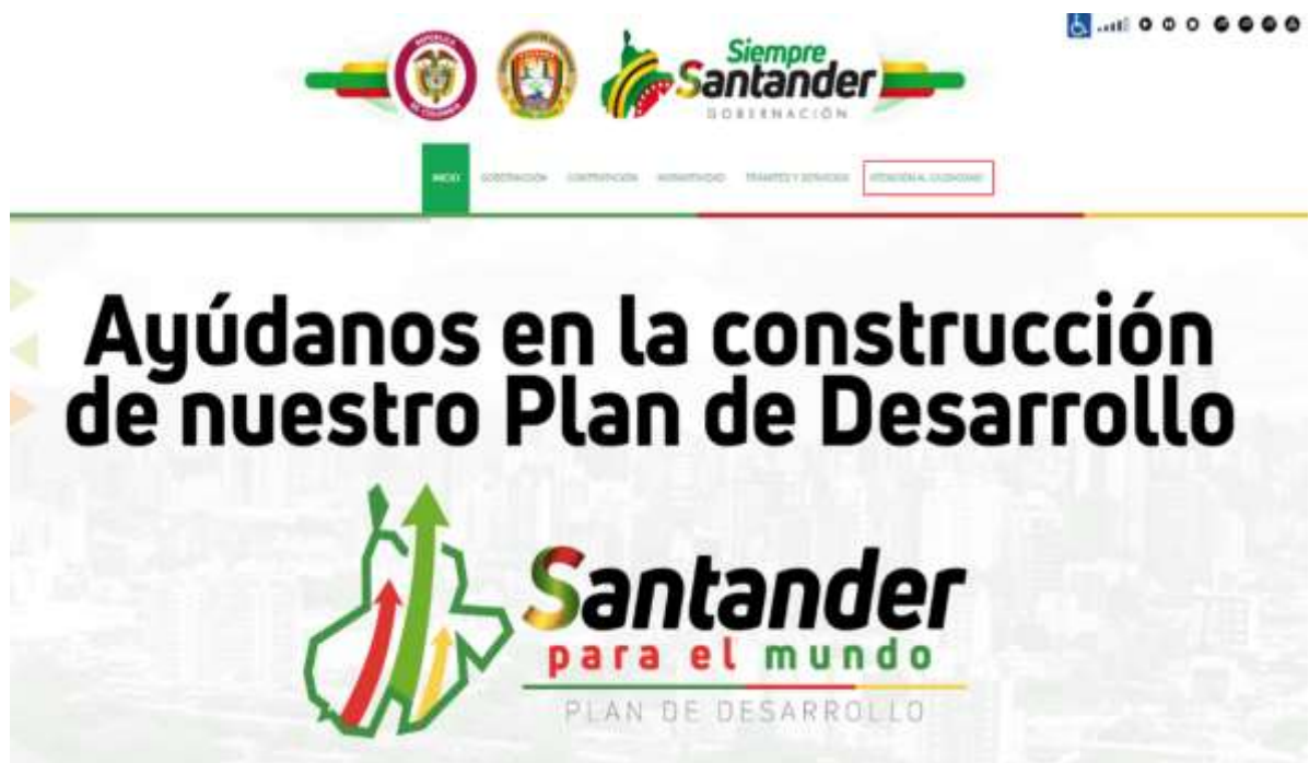
Figura 7. Página Gobernación de Santander.

gubernamental, pueda ponerse en contacto con la entidad; esto beneficiando a todos los Santandereanos y aún más a la población fuera del área metropolitana de Bucaramanga, ya que el esfuerzo que significa desplazarse hasta el Palacio Amarillo (sede de la Gobernación de Santander), hace que la comunidad muchas veces no haga uso de su facultad como veedor y participe de las decisiones que se toman.