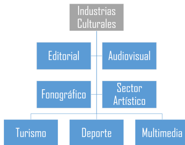
Figura 4. Sectores de las Industrias Culturales. Nota: Adaptado de (Mincultura, sf, p.557)

Las industrias culturales incluyen los sectores audiovisual, editorial, fonográfico, artístico (artes visuales, escénicas y museos y galerías), deporte y multimedia. (Mincultura, sf, p.557) (Ver figura 4)