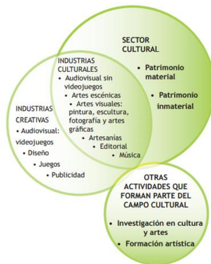
Figura 3. Relación entre industrias culturales y creativas. Nota: Adaptado de (Mincultura, 2005, p. 28).

1.2.2. Industria cultural y Sector artístico. De acuerdo al trabajo del BID anteriormente mencionado, se afirma que las industrias culturales (inmersas dentro de la economía naranja) engloban actividades que pertenecen al sector cultural pero no en su totalidad (ver figura 3). Por ejemplo, el patrimonio material e inmaterial corresponde al sector cultural, pero no a las industrias culturales. Por otro lado, existe también una diferencia entre la industria cultural y la industria creativa, que radica en lo que genera el valor del bien o servicio producido; por ejemplo, los bienes y servicios producidos por las industrias culturales son fruto de la herencia, el conocimiento tradicional y los elementos artísticos de la creatividad, mientras que las industrias creativas derivan su producción de la creatividad individual, la innovación, las habilidades y el talento en la explotación de la propiedad intelectual. Finalmente, existen también otras actividades que forman parte del campo cultural, como son la investigación en cultura y artes y la formación artística, que no pertenecerán a la industria cultural pero tampoco a las industrias creativas o al sector cultural. (Alonso & Gallego, 2010, p. 6).