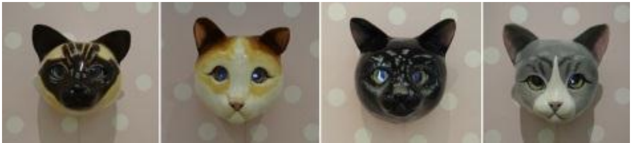
Figura 21. Escultura de cada cabeza terminada.