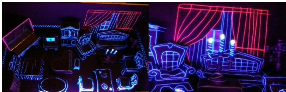
Figura 10. Habitación quimérica, pequeña maqueta en madera cubierta totalmente y tres orificios para tener acceso visual, muebles de pasta, hilos, luz negra de neón. 2013.