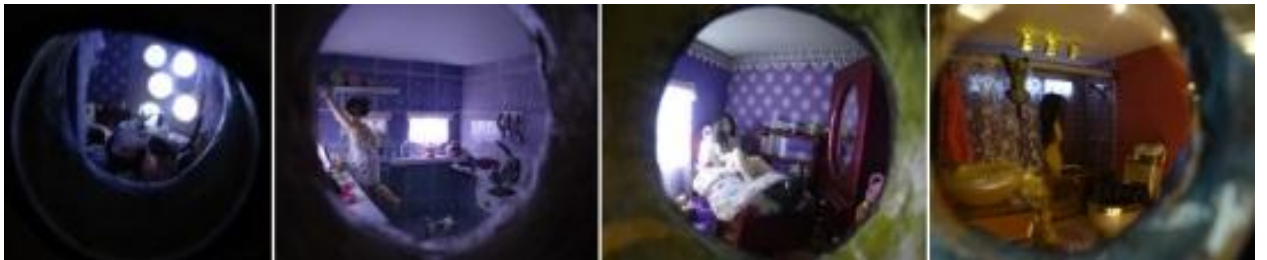
Figura. 19 vista del interior a través de los ojos del gato

El tono pastel de la pared se oscureció un poco para hacer juego con el tono del piso del lugar de exposición llevándolo a un tono más cálido.