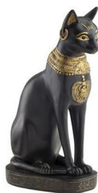
Figura 4. Diosa Bastet, dimensiones desconocidas. Dinastía XXVI reinado de psamético I, 664- 610 a.c