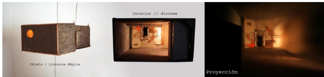
Figura 2. “Cámaras- recamaras”. Proyector de madera, luz, dos lentes. 2007.

transformar la escena creada por la artista, convirtiendo a través de la fotografía una imagen tridimensional; donde el reciclaje, las cajas, lentes y bombillos funcionan como medio para el trabajo fotográfico.