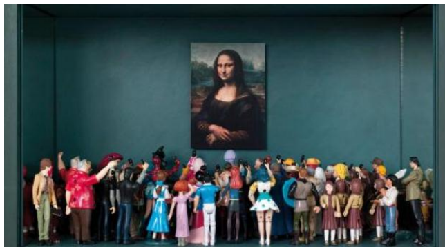
Figura 1. La locura del Louvre alrededor de la Mona Lisa, figuritas coleccionadas, 2013.