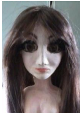
Figura 12. Prueba de diferentes materiales como el cabello y la porcelana.