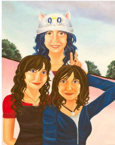
Figura 7. “Yo, mi ego y mi otro yo” óleo sobre lienzo. 2011

Con el trabajo “Yo, mi ego y mi otro yo” tomé la iniciativa para incluir a los felinos en mi proceso plástico. Con esta pintura de tonos pasteles y un poco kitsch, sirvió como plataforma para expresar mi reservada fascinación hacia los gatos.