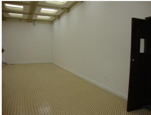
Figura 15. Lugar de Intervención sala de exposición Macaregua. Sede UIS Bucarica.

Estos gatos estarán instalados en la pared, de tal forma que al ser vistos simulen estar incrustados o saliendo de ella. La cabeza de cada gato estará ubicada aproximadamente a la estatura promedio de 150cm de altura. La pared estará intervenida en tono pastel para dar al espectador la sensación de pertenecer a la obra. Ya que estos tonos están dentro de cada diorama y al entrar y observar el diorama en conjunto a la sala de exposición será evidente esta yuxtaposición entre interior y exterior.