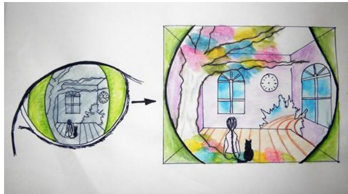
Figura 13. Boceto del lente en el ojo gatuno para mirar a través de ellos.

de cada gato, aquí vale citar la leyenda irlandesa “Los ojos del gato son ventanas que nos permite ver a otro mundo” 11 ya que al asomarse el espectador por los ojos de cada gato, podrá descubrir y sumergirse simbólicamente dentro de ese pequeño mundo de intimidad que quise plantear en mi propuesta.