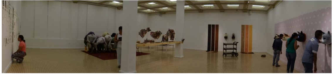
Figura 22. Fotos del montaje final