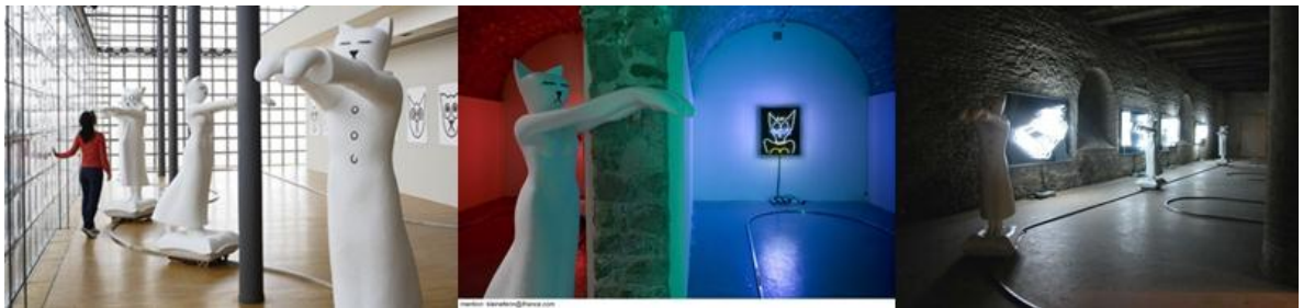
Figura 6. Les somnambules, poliéster, acrílico, 195x 142x 70cm, 192x 148x 70cm, 195x 130x 70cm. riel inoxidable (L92 m) sistema eléctrico. 2002.