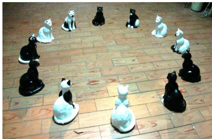
Figura 8. “Gatos”. Yeso, pintura esmalte. 22x15x18 cm. 2011.

Simplemente “Gatos”, fue la obra plástica que realicé para expresar la elegancia y el orden de mis mascotas, jugando con el ritmo y la repetición en la medida que se pintaron tres gatos blancos, tres negros, tres negro-blanco y tres blanco negro.