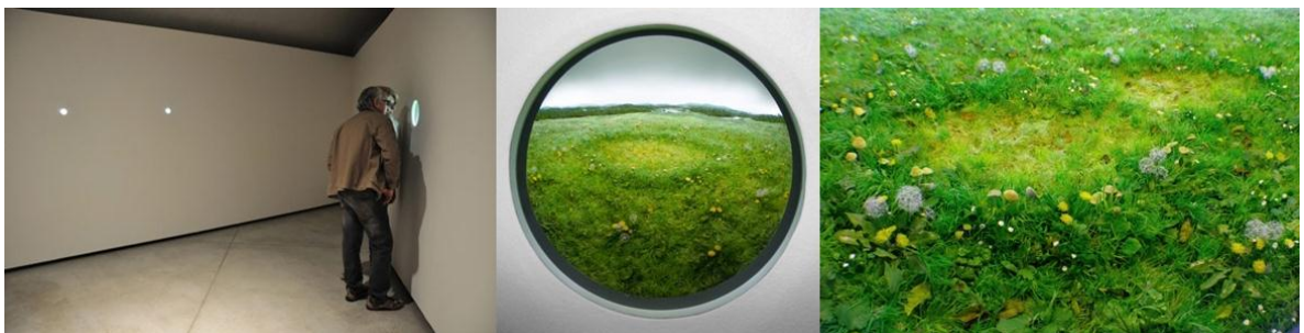
Figura 3. Fairy Ring with Dandelions, 2010 – 2012.

Patrick Jacobs realiza miniaturas de paisajes e interiores arquitectónicos, esculpiendo y pintando la escenografía recreada. Este artista evade el convencionalismo del cubo para el diorama, ya que los instala dentro de las paredes del lugar de exhibición, permitiendo que sus creaciones sean visualizadas por medio de un lente circular que termina formando parte de la arquitectura, entendiéndose el diorama no como una pieza separada y móvil sino integrándola con la totalidad del lugar de exhibición.