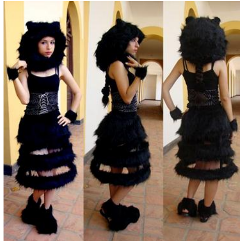
Figura 9. “mau” inspirado en gatos, felpa, tela gamuza.

Para concluir con las propuestas relacionadas con lo felino-femenino, llegó el momento preciso para realizar una pieza “textil escultórica”. Al momento de elaborar dos diseños uno inspirado en las telarañas y el segundo inspirado en los felinos, siendo el segundo diseño “mau”, uno de los proyectos característicos de los gatos, personificándolo en una modelo femenina de piel clara para hacer el contraste de tonos, felpa negra y piel blanca.