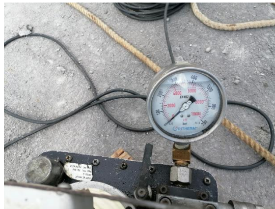
Figura 4. Manómetro.