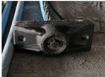
Figura 2. Anclaje