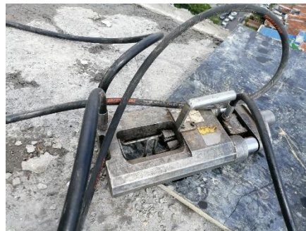
Figura 5. Gato hidráulico.