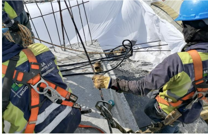
Figura 10. Proceso tensionamiento.