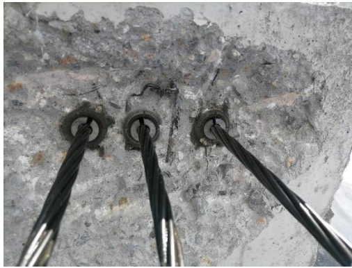
Figura 9. Montaje después de concreto.