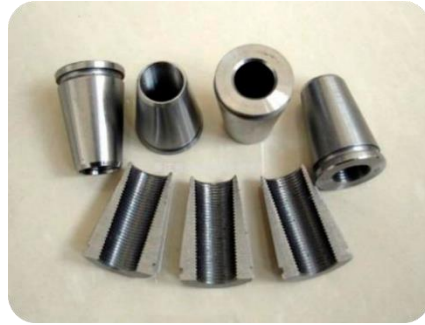
Figura 3. Cuñas.