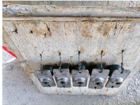
Figura 8. Anclajes montados.

Nota: Ver anexos formato de inspección sugerido.