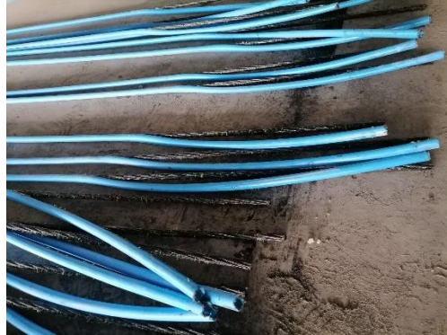
Figura 1. Torón no adherido engrasado.