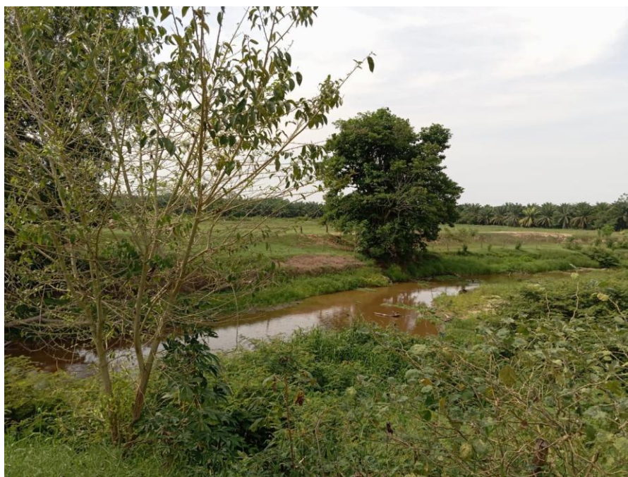
Fotografía 4. Quebrada que conecta con el río de San Alberto.