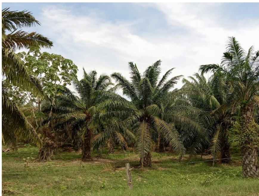
Fotografía 2. Primeros cultivos de palma africana.