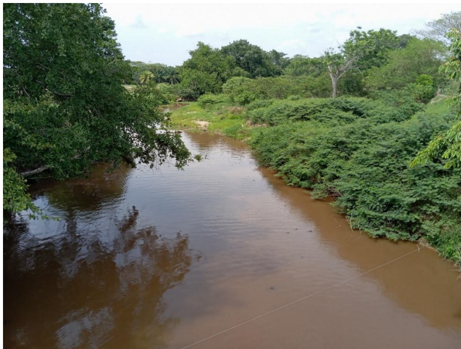
Fotografía 5. Caimanes en la quebrada.