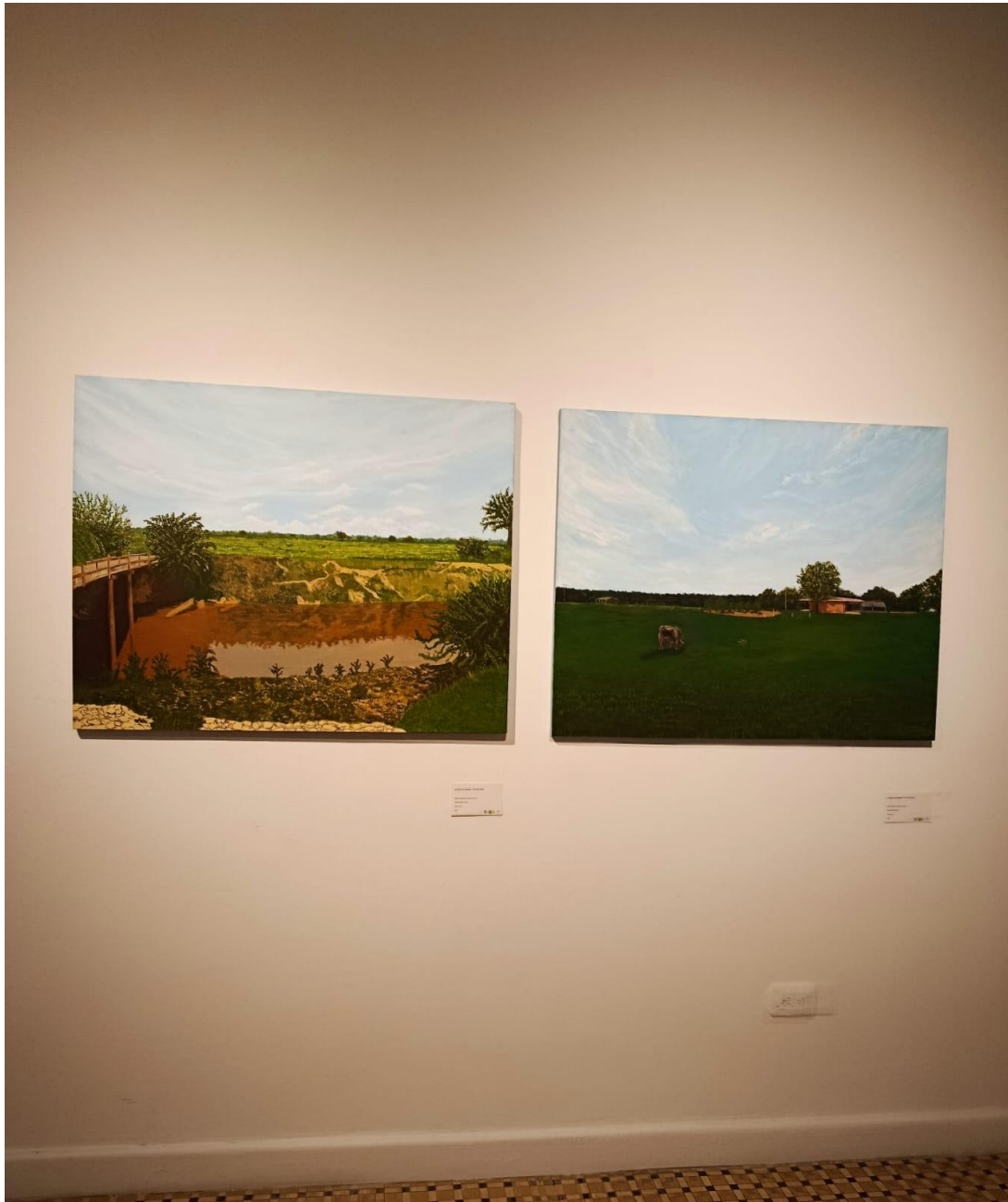
Fotografía 3. Pinturas de la finca La Gorgona expuestas en la sala.

Nota. Vista de las dos pinturas presentadas en la exposición: una representa la casa principal de la finca y la otra el paisaje del puente que conecta con la quebrada y demás cultivo de palma africana.