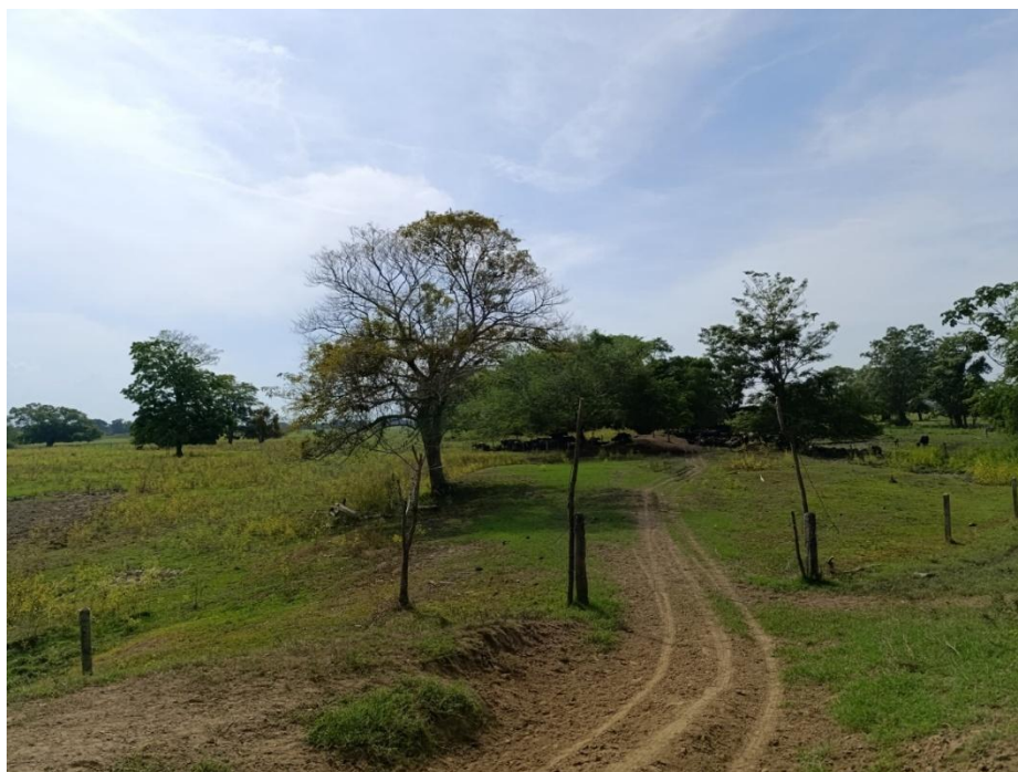
Fotografía 6. Camino hacia los potreros.