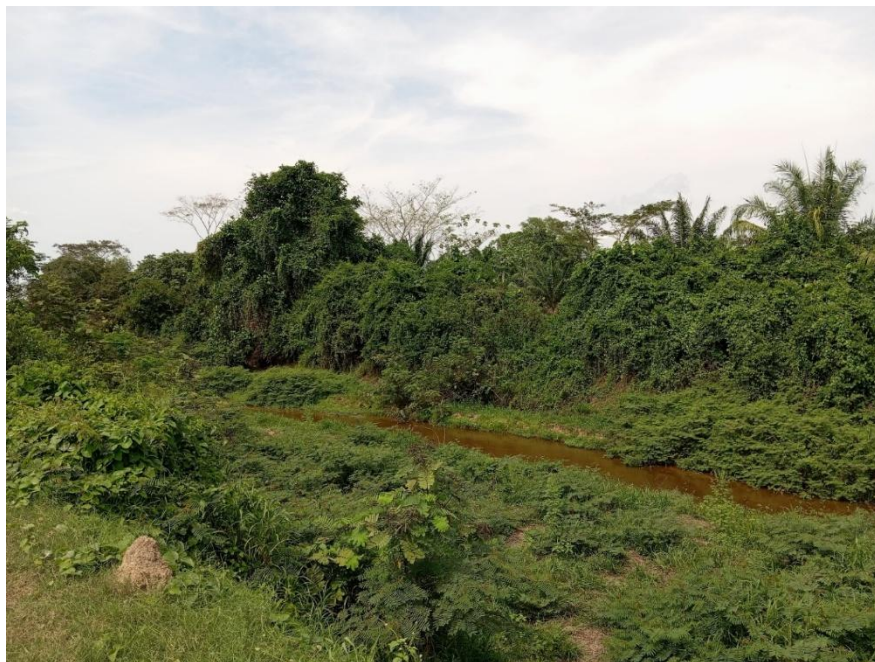
Fotografía 1. Entrada a La Gorgona.

Nota general. Todas las fotografías fueron tomadas durante la visita realizada el 23 de marzo de 2025 en la finca La Gorgona, San Rafael de Lebrija (Santander).