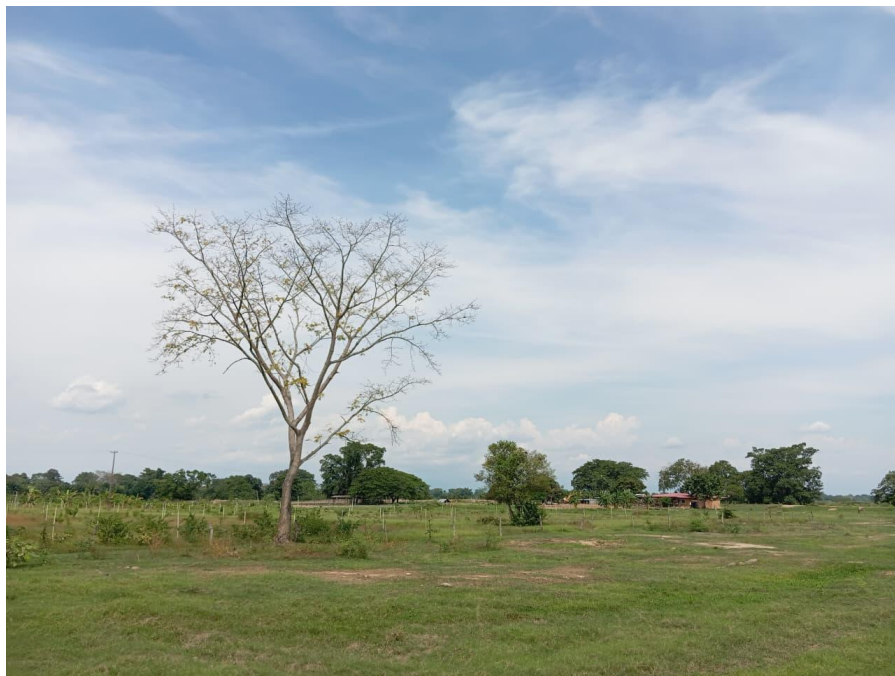
Fotografía 3. Camino a la casa principal.