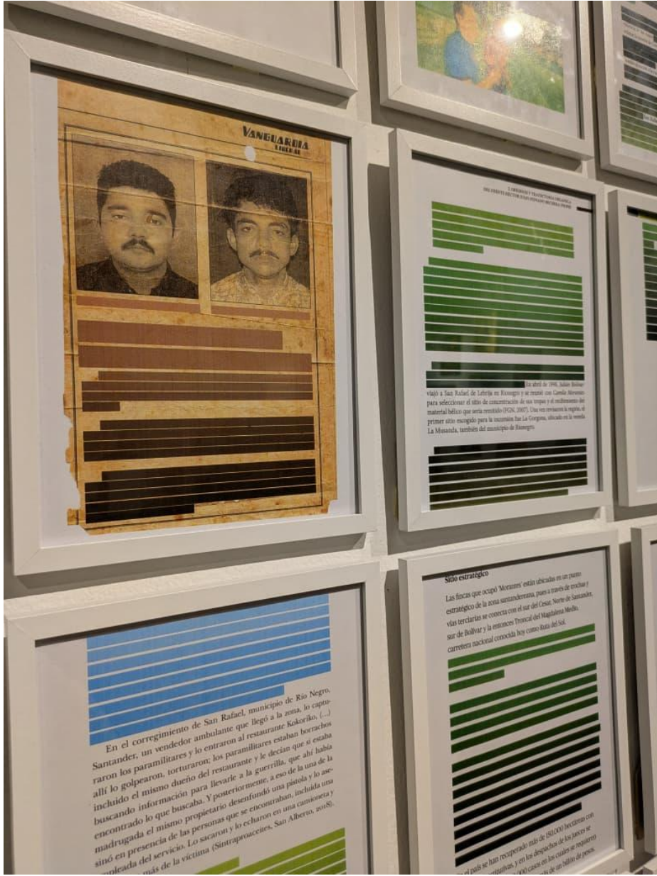
Fotografía 2. Artículos intervenidos de manera digital.