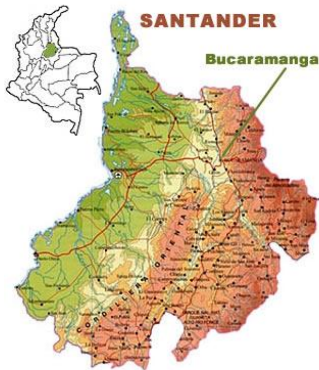
Imagen 1. Mapa físico-político del departamento de Santander.