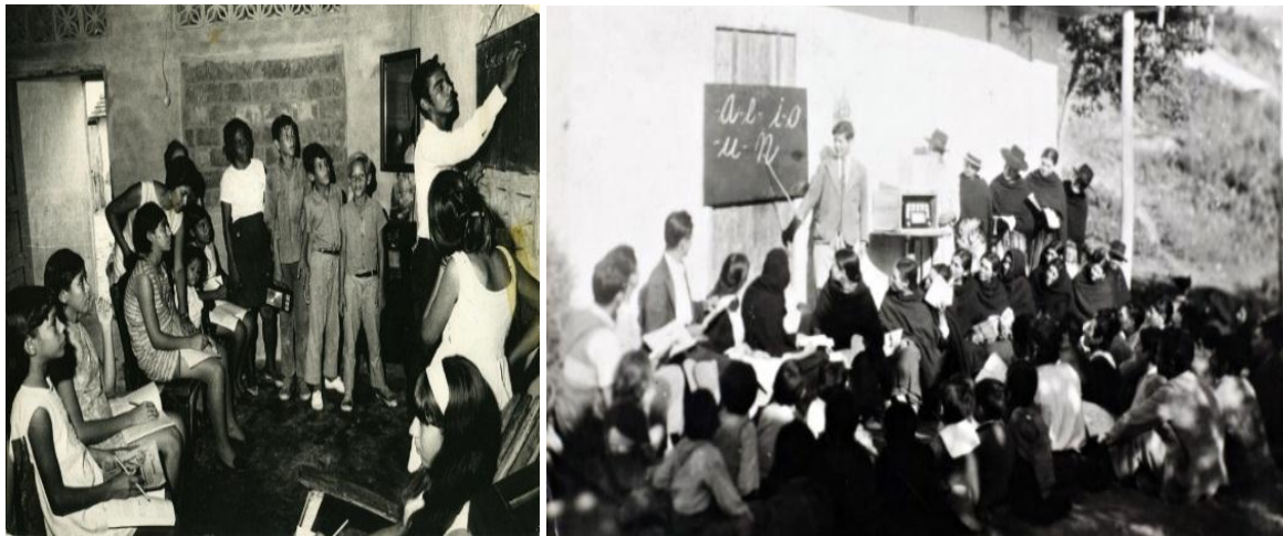
Foto 7. La Escuela Radiofónica Veredal