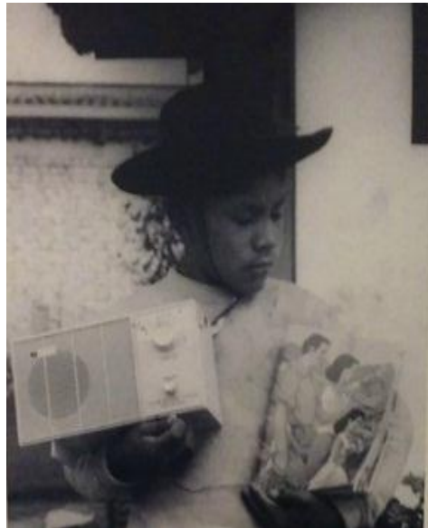
Foto 5. Muestra de algunos materiales pedagógicos para las EERR de ACPO