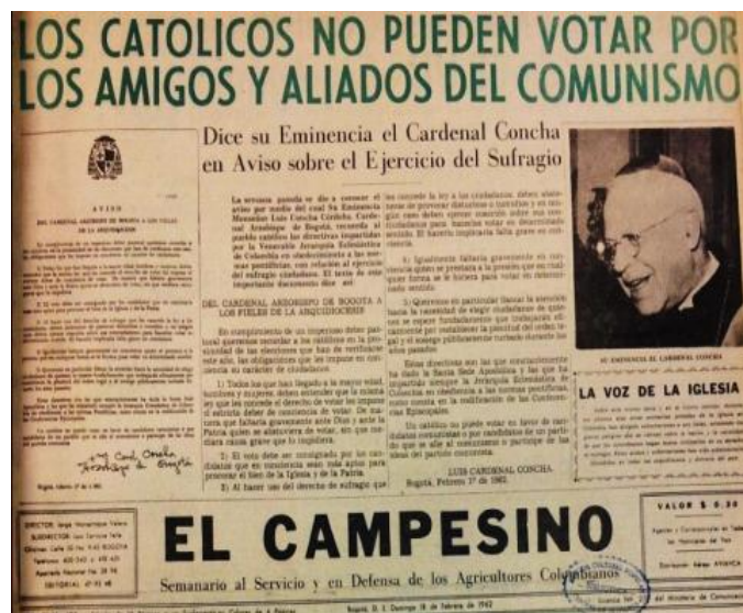
Foto 9. Editorial anticomunista del El Campesino , 1962

Fuente. El Campesino . Bogotá, 18 de febrero de 1962.