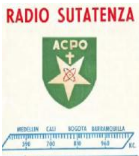
Imagen 2. Escudo de Acción Cultural Popular, 1947 – 1994