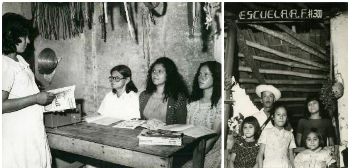
Foto 6. La Escuela Radiofónica Familiar