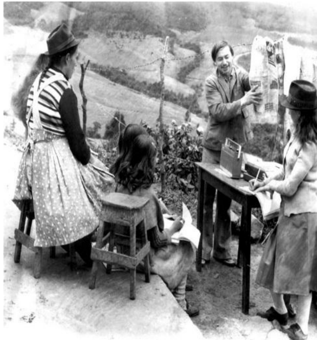
Foto 10. Escuela Radiofónica campesina en plena actividad

Fuente. Colección de ACPO “ Radio Sutatenza .” Biblioteca Luis Angel Arango del Banco de la Republica, Bogotá