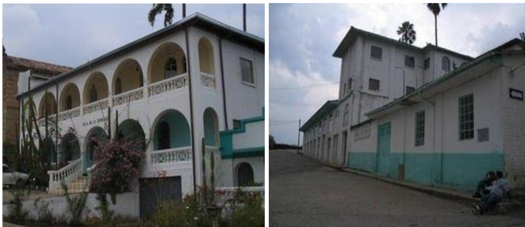
Foto 8. Los Institutos Sutatenza en Boyacá

Fuente. Colección de ACPO “Radio Sutatenza.” Biblioteca Luis Angel Arango del Banco de la Republica, Bogotá