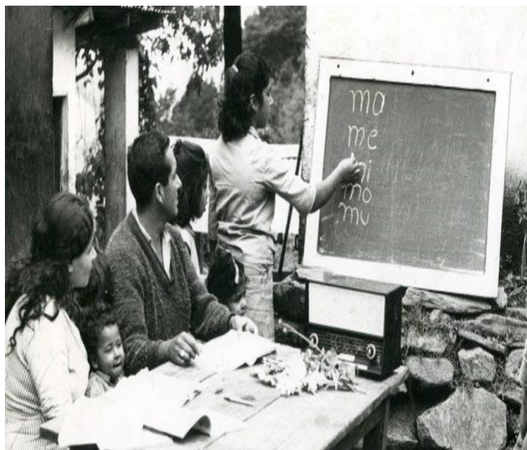
Foto 3. Escuela Radiofónica campesina en plena actividad

Fuente. Colección de ACPO “Radio Sutatenza.” Biblioteca Luis Angel Arango del Banco de la Republica, Bogotá