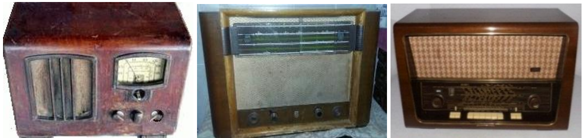
Foto 4. Algunos “Radio Sutatenza” en la decada de los cincuenta, sesenta y sesenta