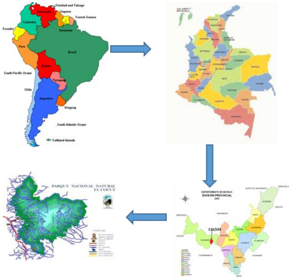
Figura 1. Mapa de la zona de estudio