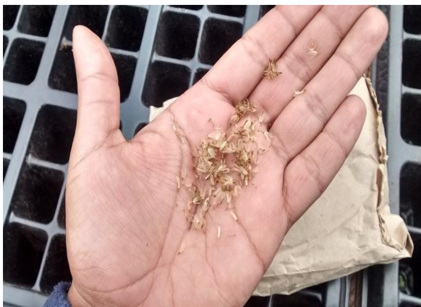
Imagen 1. Semillas de Romero de castilla

Para las semillas de “Frailejón” se realizó la colecta en días secos, poco después de iniciada la época de lluvias cabe destacar que es necesario colectar solo especímenes maduros, su transporte se realiza de igual forma en bolsas de papel.