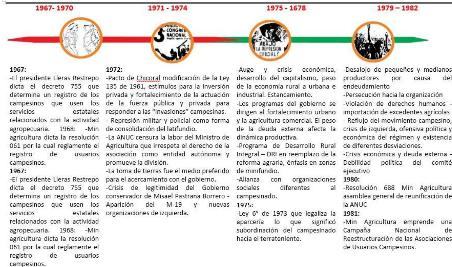
Cuadro 3. Contexto nacional ANUC 1967 - 1982