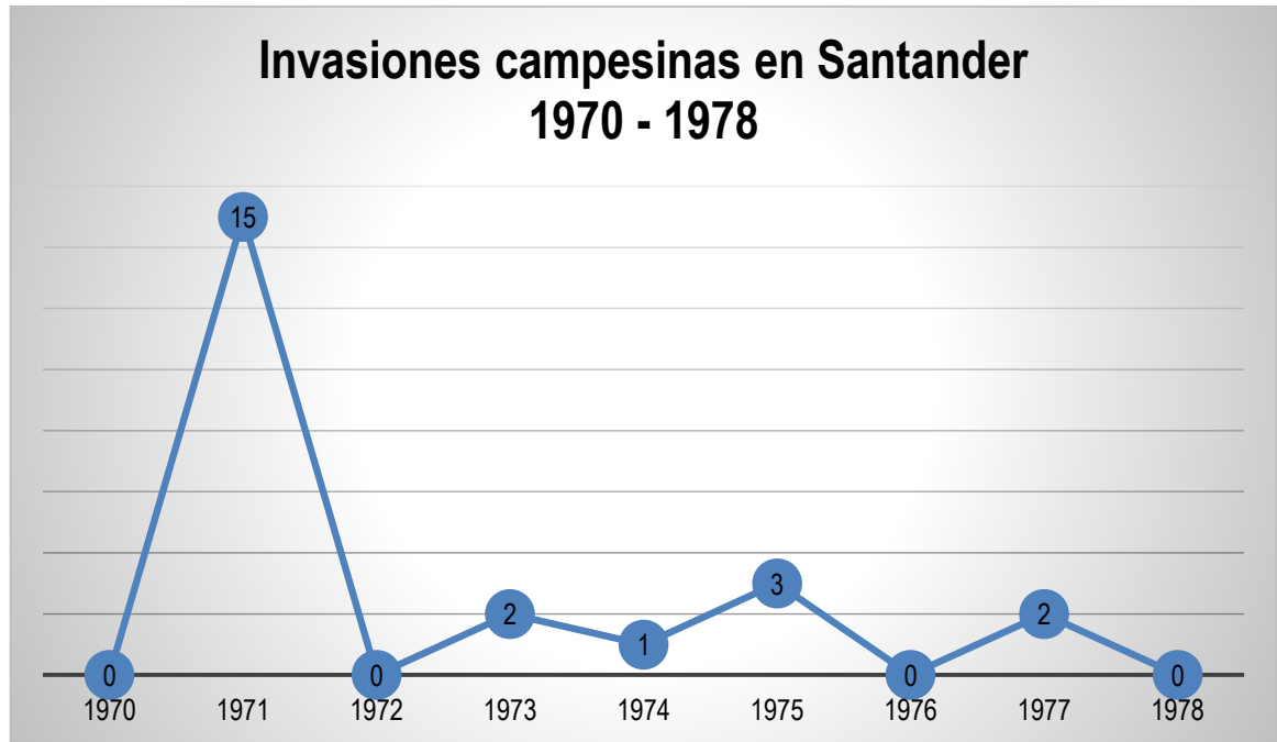
Figura 2. Invasiones campesinas en Santander 1970 - 1978.