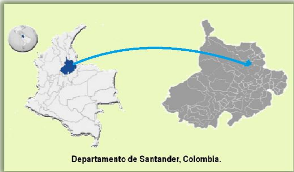
Figura 1. Mapa de Santander