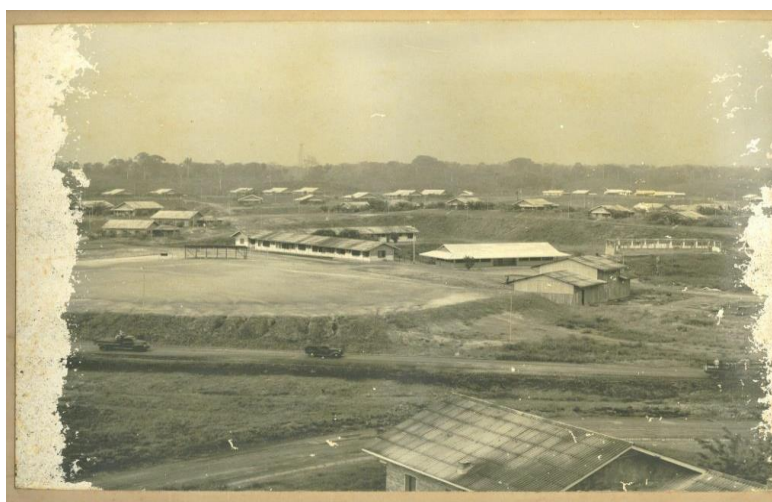
Figura 2: Vista parcial del campamento de la Shell Cóndor en Campo Casabe.

Nota: Vista parcial del campamento petrolero de la Shell Cóndor en Campo Casabe mostrando algunas de las viviendas y áreas recreativas existentes en la época 29 .