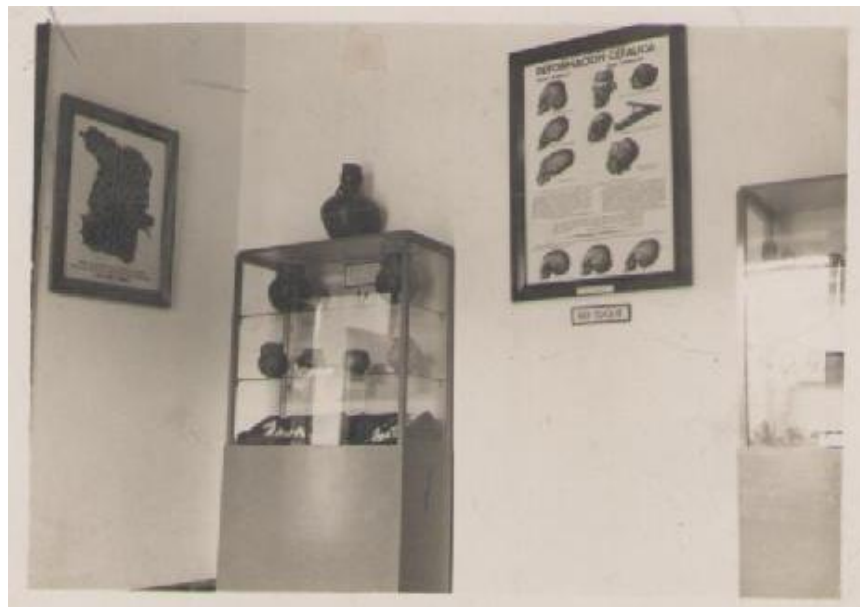
Foto 9. Sala del Bedford Wilson

Fuente: Archivo Fotográfico de la Academia de Historia de Santander.