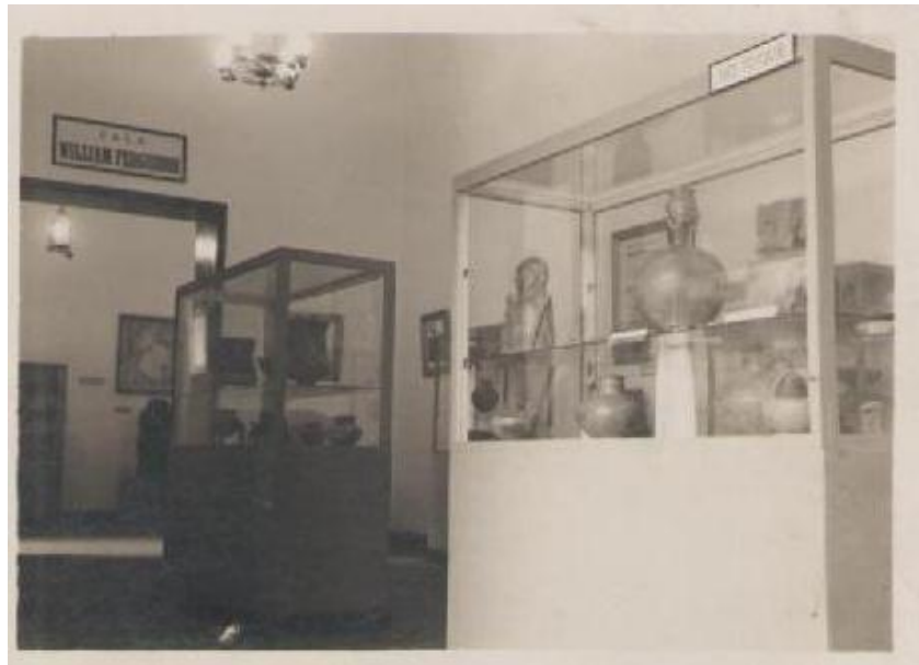
Foto 10. Sala William Ferguson.