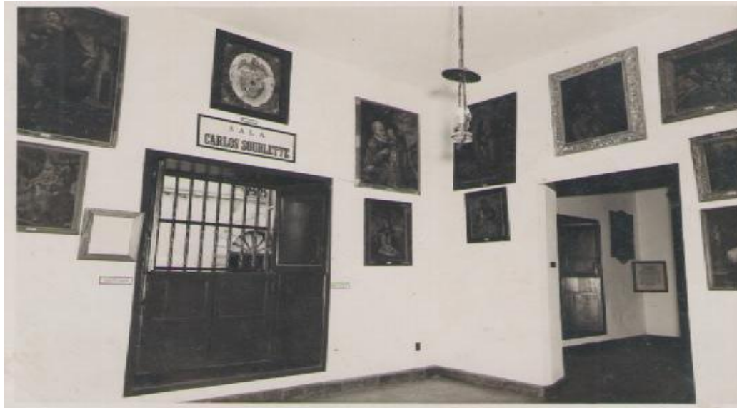
Foto 6. Sala Carlos Soublatte