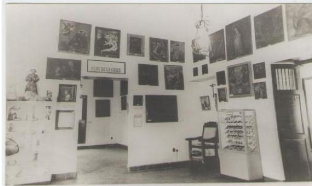
Foto 5. Sala Luis Perú de la Croix.