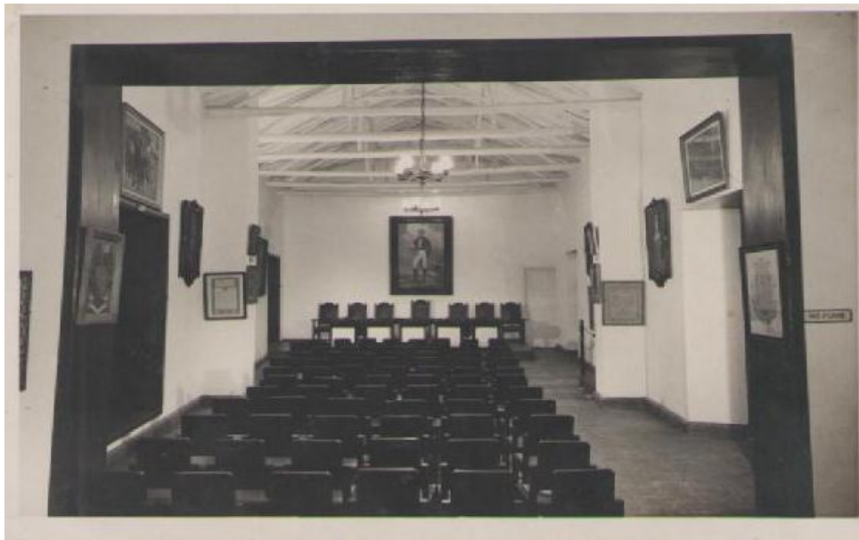
Foto 7. Sala de Conferencias.

Fuente: Archivo Fotográfico de la Academia de Historia de Santander.