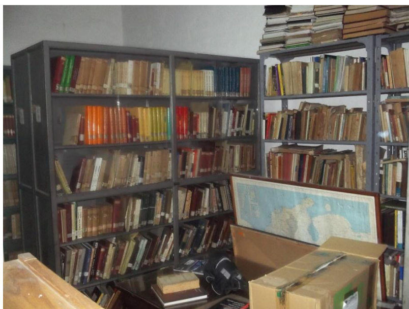
Foto 35. Estado actual de la Biblioteca Michelsen