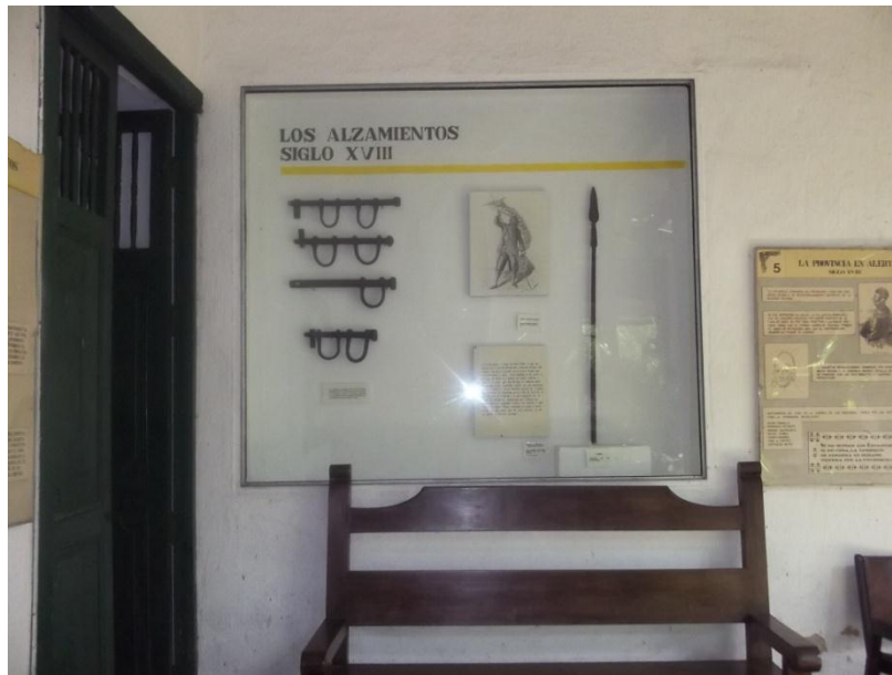
Foto 25 Los alzamientos