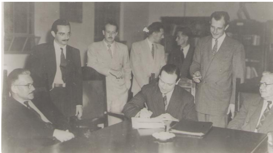
Foto 1. Firma de escritura publica