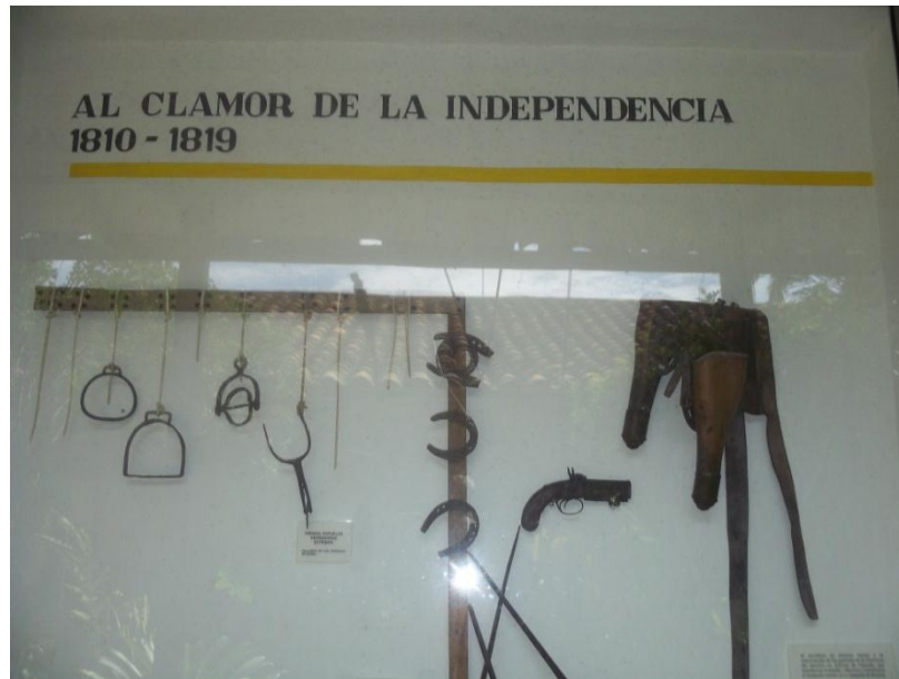
Foto 27. Al clamor de la independencia