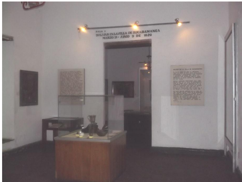
Foto 20. Bolívar en la Villa de Bucaramanga.