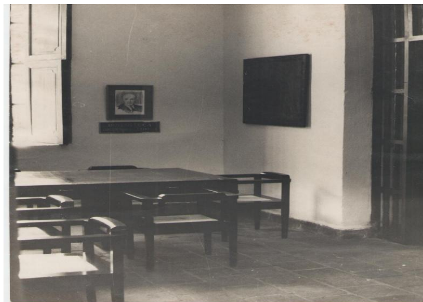
Foto 34. Sala de lectura de la biblioteca Ernesto Michelsen Mantilla, ubicada en la actual oficina de la Institución