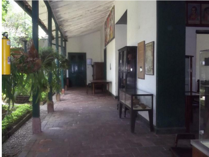
Foto 30. Paso de los conquistadores