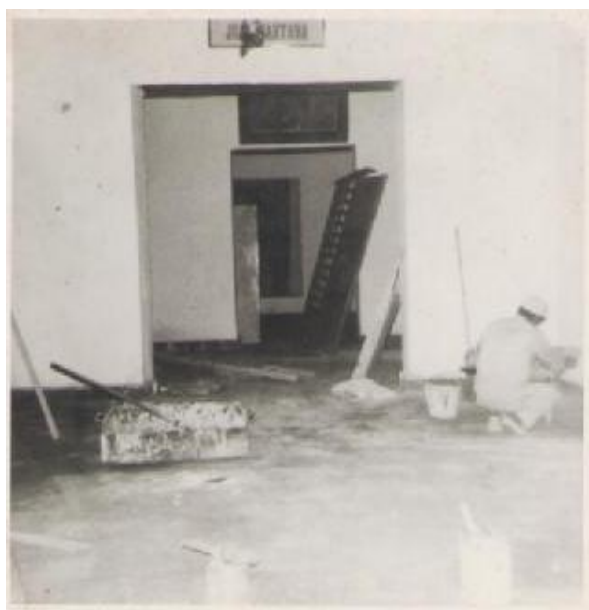
Foto 18. Segunda Remodelación 1950