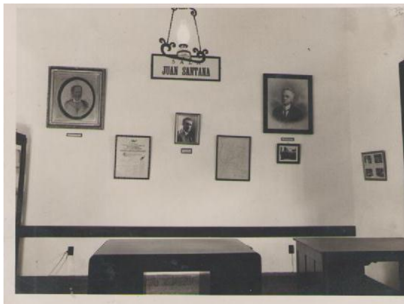
Foto 4. Sala Juan Santana