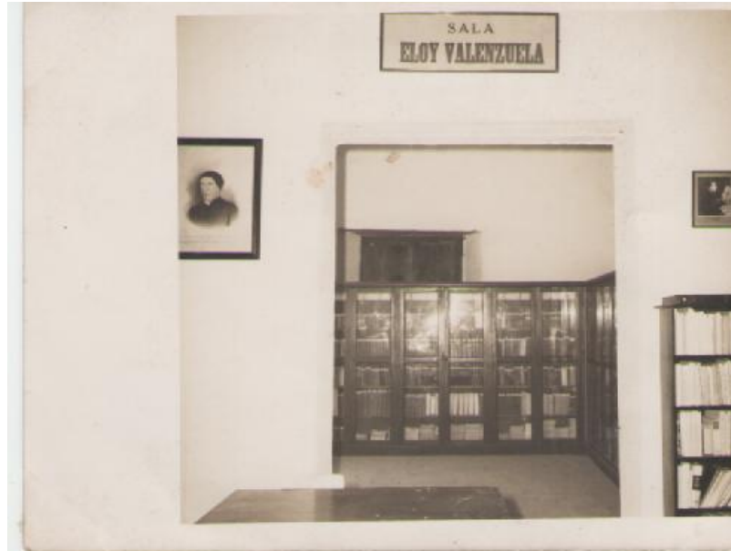
Foto 12. Sala de Eloy Valenzuela.

Fuente: Archivo Fotográfico de la Academia de Historia de Santander