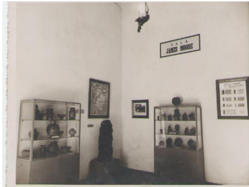
Foto 11. Sala James Moore.