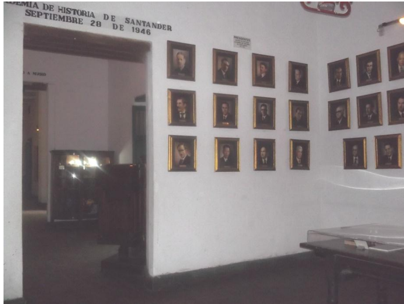
Foto 21. Sala Academia de Historia de Santander