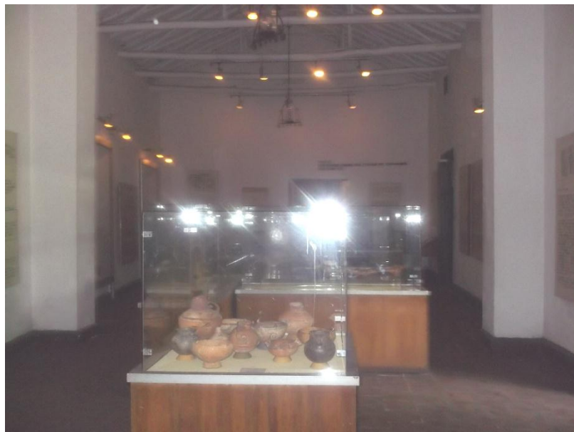
Foto 23. Sala Los Guanes-Origin del Pueblo de Santander 500 – 1500 D.C.

Cuarta Sala: Los Guanes-Origin del Pueblo de Santander. 500-1500 D.C. Esta sala está dedicada a la etnia Guane y reúne un gran material cerámico, textil, óseo y religioso. Si bien es cierto que la etnia Guane no es la única etnia santandereana, si es de las más representativas. Por lo tanto esta sala reúne la mayor cantidad de objetos arqueológicos realizados por miembros de la Academia de Historia de Santander en el departamento.