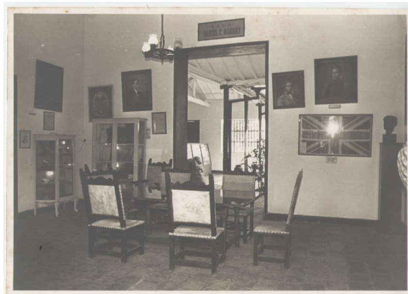
Foto 8. Sala Daniel F. O'Leary

Fuente: Archivo Fotográfico de la Academia de Historia de Santander.