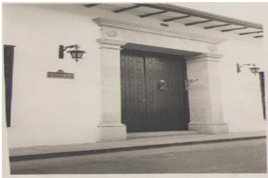
Foto 2. Frente de la Casa del libertador 1950