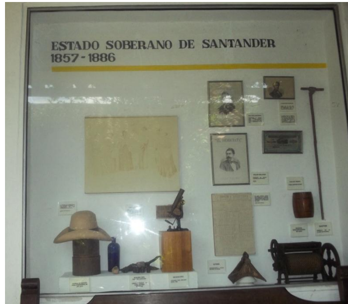
Foto 28. Estado soberano de Santander