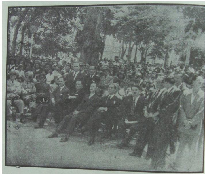
Foto 14. Delegaciones Bolivarianas, Socios de la Academia de Historia de Santander, autoridades y público congregado en el Parque de Bolívar en los momentos de descubrir la estatua del Libertador