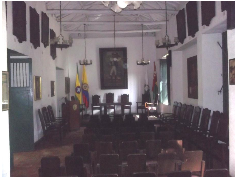
Foto 32. Auditorio