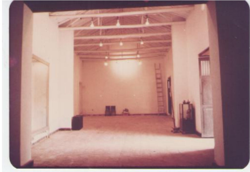
Foto 19. Tercera Remodelación 1977