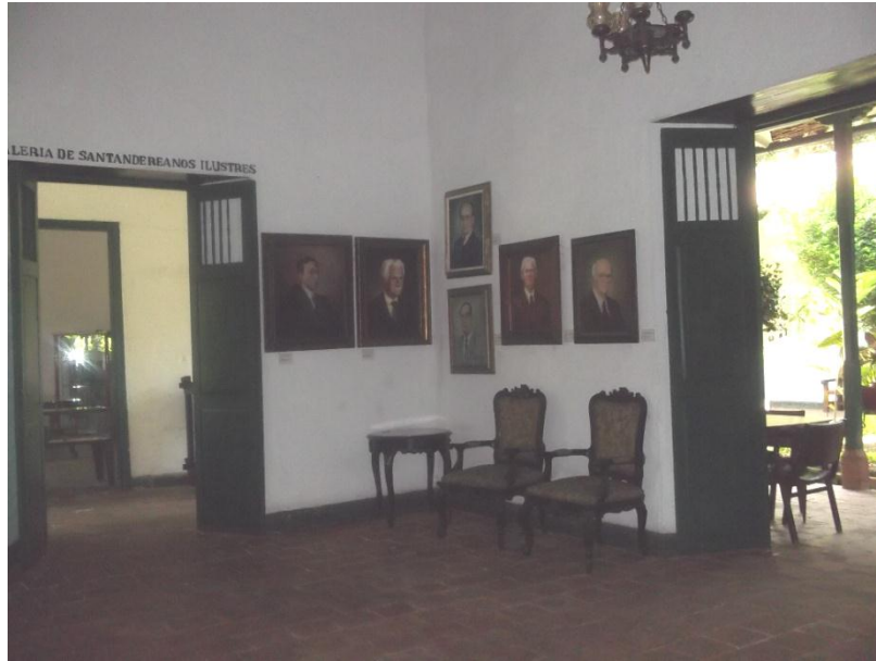
Foto 31. Galería de los Santandereanos ilustres