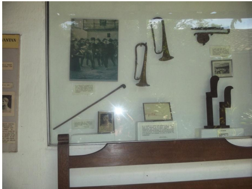
Foto 26. Las ciudades se levantan