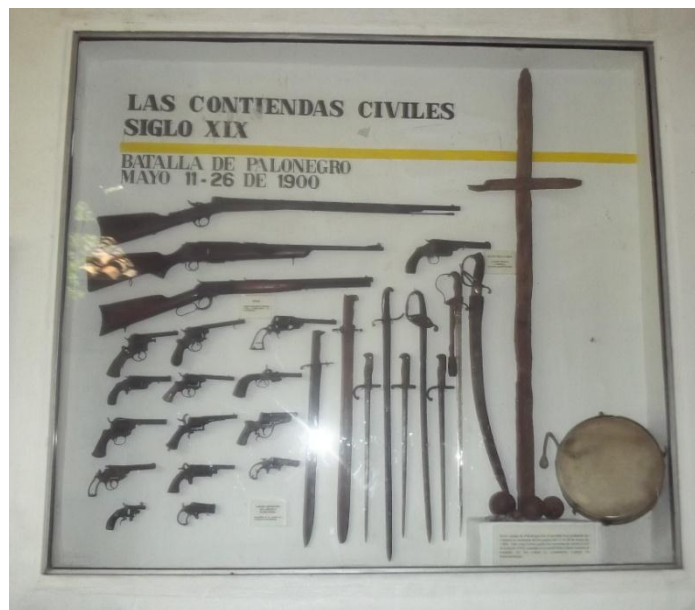
Foto 29. Contiendas civiles