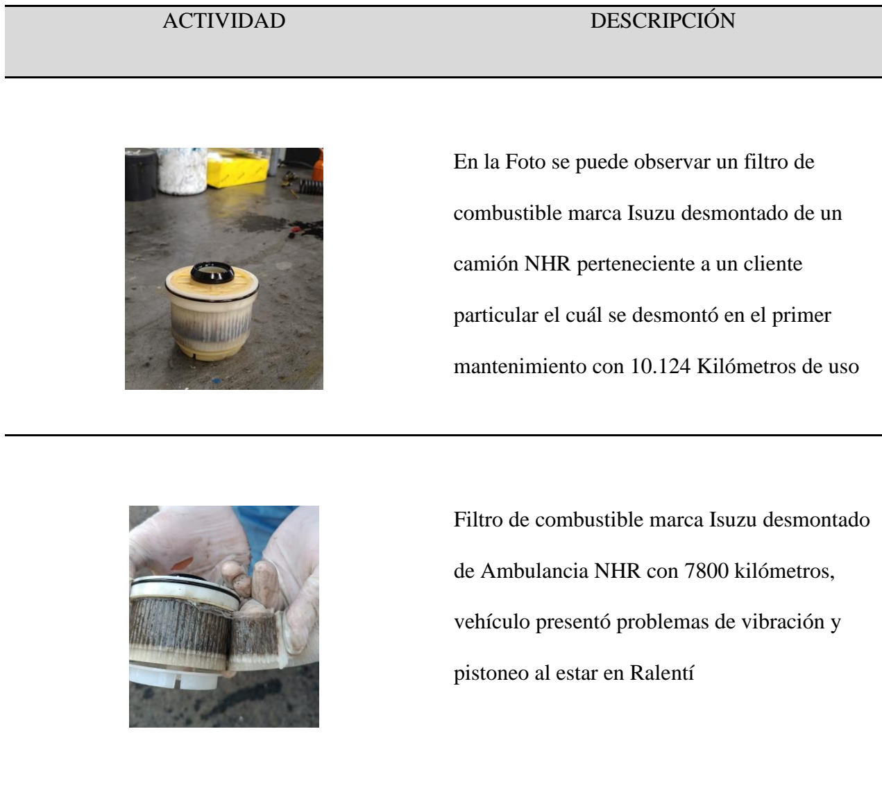
Tabla 3 – Filtros de combustible