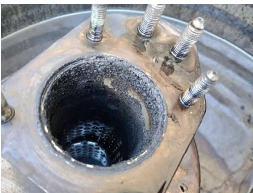
Tabla 4 Evidencia fotográfica estado de catalizadores y válvulas EGR

Obstrucción en el catalizador del vehículo, el cual registraba 15,700 kilómetros en el tacómetro en el momento del reporte. Esta obstrucción se manifestó a través de dificultades en la aceleración del vehículo y una sensación de ahogo.