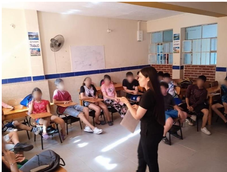
Figura 5. Evidencias de la sesión