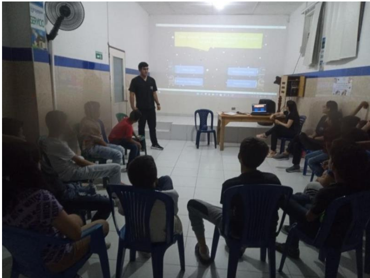
Figura 2. Evidencia de la sesión 1.

Evidencias fotográficas de las diferentes sesiones del seminario de investigación.