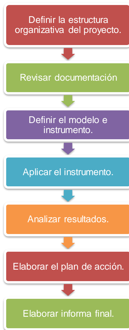
Ilustración 3. Actividades para el proceso de autoevaluación.

Considerando aspectos como la duración del proceso, los tiempos de ejecución, la metodología a utilizar para recolectar, analizar e interpretar los resultados se plantearon las siguientes actividades: