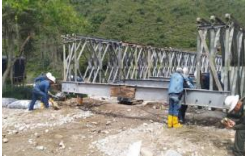
Apéndice F. Evidencia fotográfica visita de inspección, PH Miraflores, Piedecuesta.