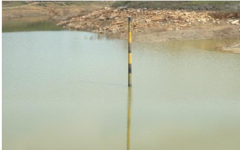
Imagen 8 Estado actual del embalse