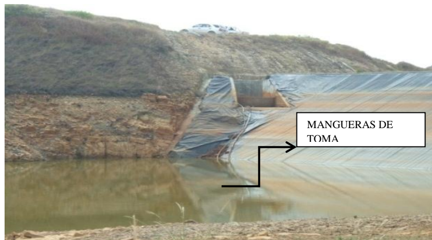
Imagen 9 Estado actual del embalse. Toma de agua con mangueras