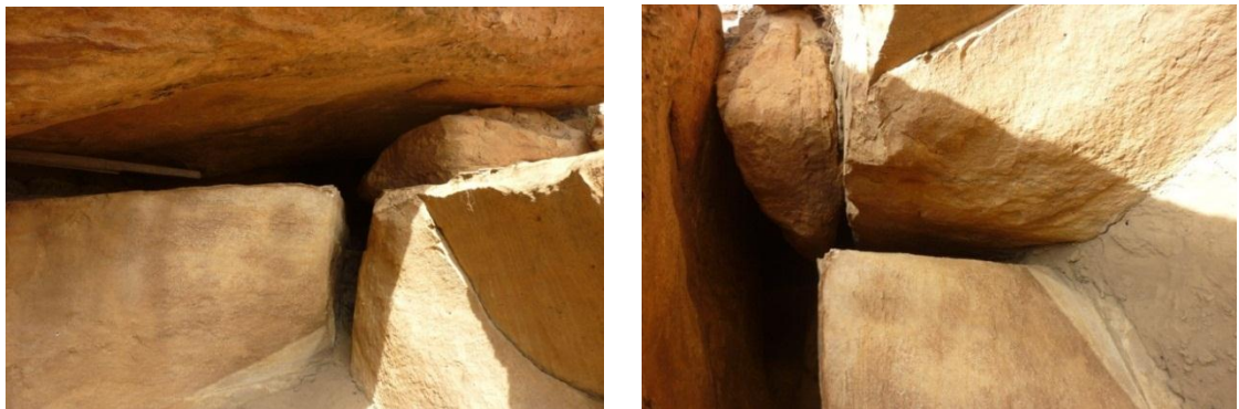
Imagen 4 (b) . Grietas en los costados del embalse