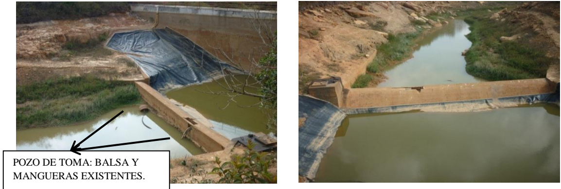
Imagen 6 Estructura del pozo de toma