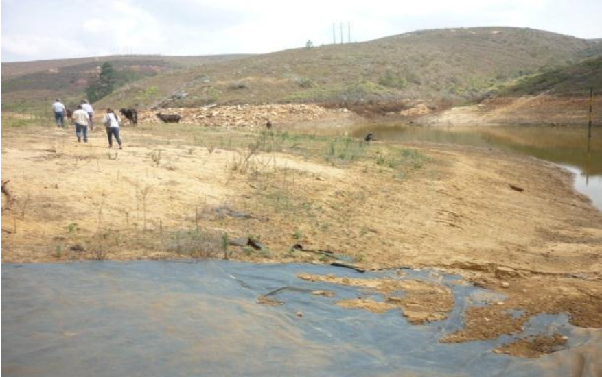
Imagen 10 Terrenos en donde se realizará la excavación para aumento en el volumen de almacenamiento del embalse.