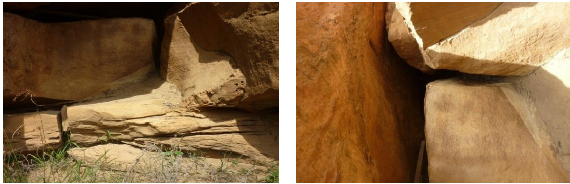
Imagen 3 (a) Grietas en los costados del embalse