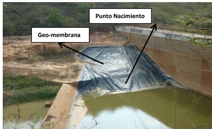
Imagen 2 Punto de nacimiento de agua (0.5 lps)