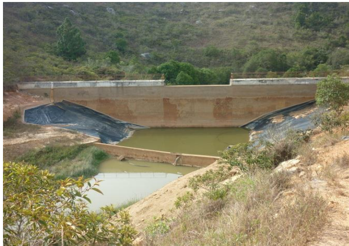
Imagen 1 Estado actual, embalse la cañada