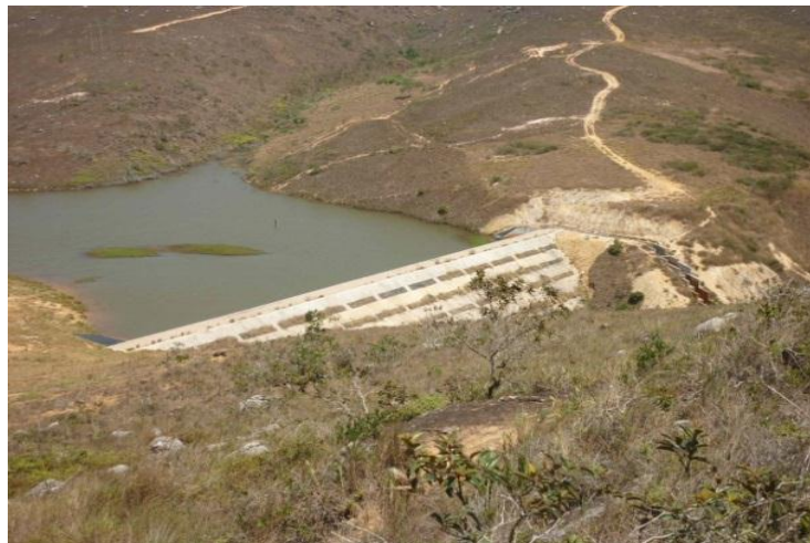
Imagen 7 Estado del embalse con su máximo volumen de almacenamiento