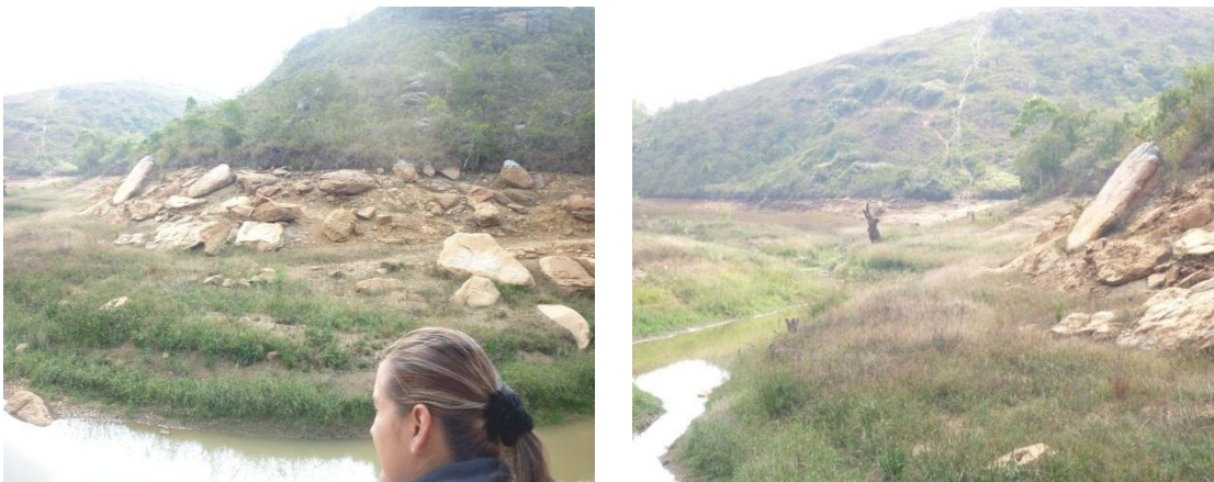
Imagen 5 Paredes laterales del vaso del embalse.