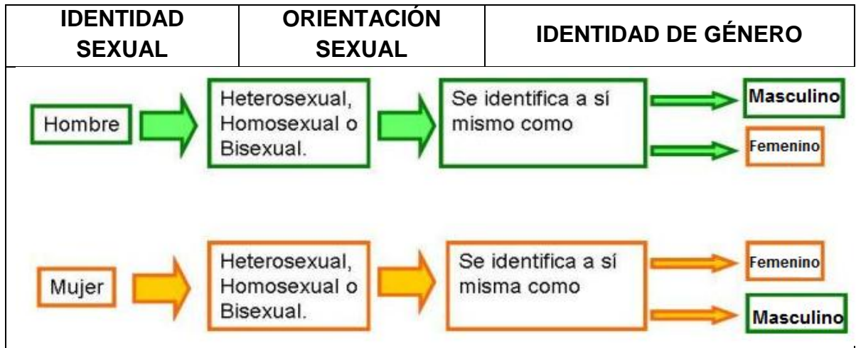
Figura 3. Identidades de Género