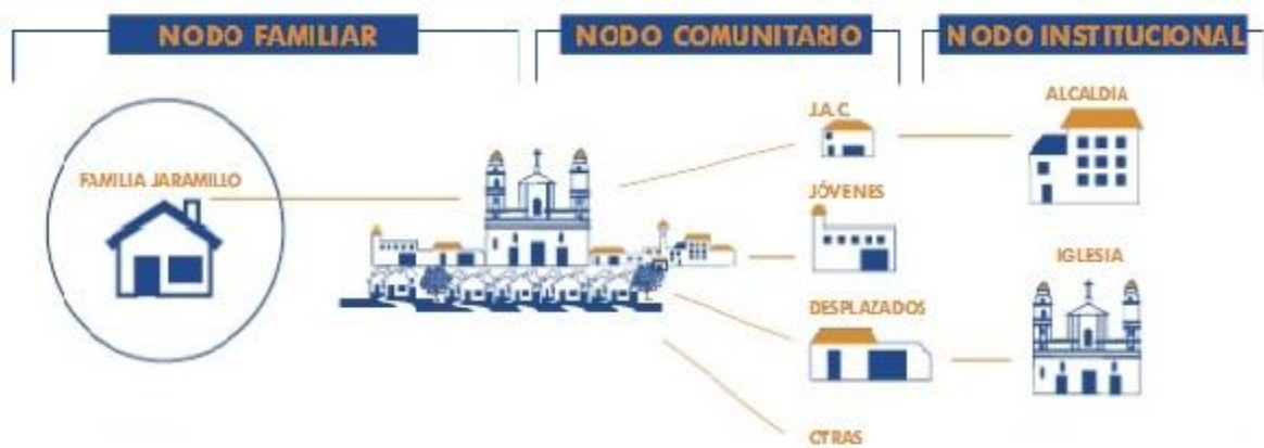
Figura 2. Organización de las RSA.