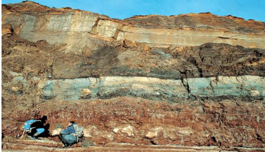
FIGURA 2: Paleontólogos recogiendo muestras en estratos.