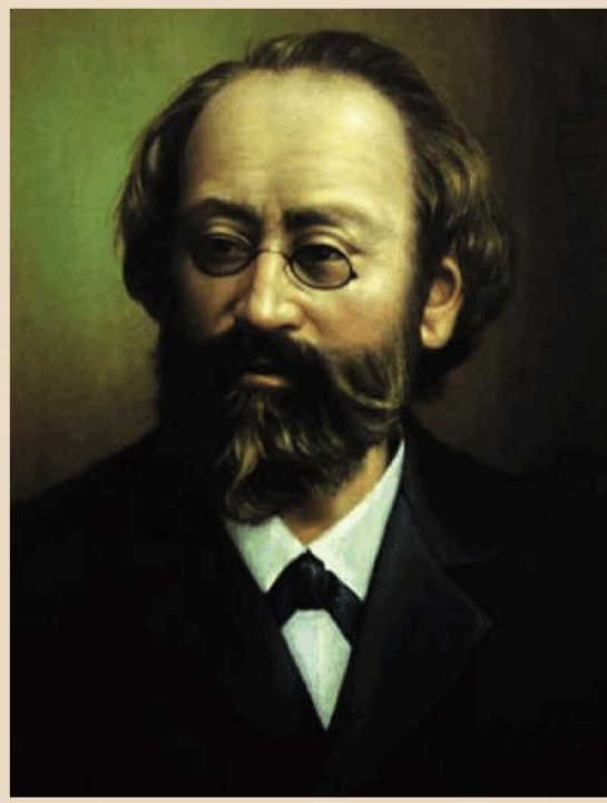
Figura 6 Max Bruch