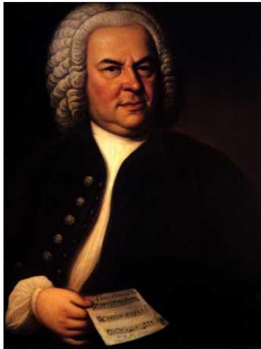
Figura 3 Johann Sebastian Bach