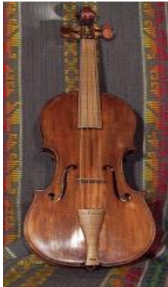
Figura 2 El violín Barroco

Fuente: COLEGIO MEKHITARISTA DE BUENOS AIRES. Europa Siglo XVII: Sociedad y Economía. [Online] consultado el 12 de noviembre del 2014. Disponible en: http://europadelxvii.blogspot.com/