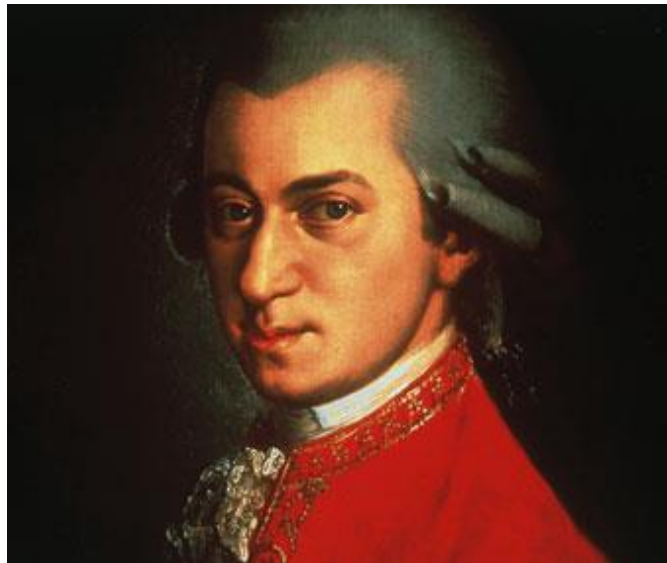
Figura 5 Wolfgang Amadeus Mozart