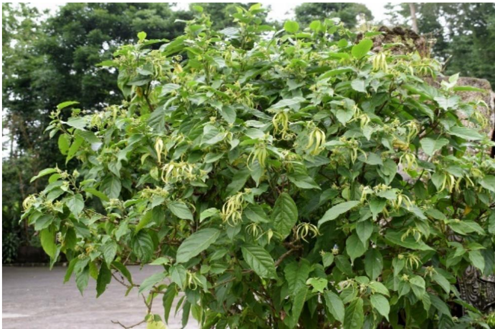
Figura 2. Árbol Ylang o Cananga Odorata con sus flores.

Es también conocido como Cananga odorata , es un árbol original de la India, Indonesia y Madagascar, puede alcanzar una altitud de hasta 25 metros de altura, con flores pequeñas de color verde en su etapa inmadura que cambia a amarillo en su etapa madura. Pueden florecer hasta tres veces en un año. Se usa en la aromaterapia, la perfumería y en la decoración. Entre sus beneficios se conocen los efectos calmantes, la relajación y componentes orgánicos que promueven la apariencia brillante y saludable del cabello, entre otros. (doTerra, 2019)