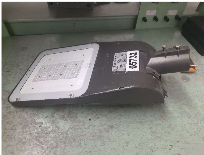
Luminaria ROY ALPHA RALED II CLASE II 80W

Basado en la inspección visual planteada según los criterios establecidos en la IEC 60598-1:2022, se puede afirmar que la luminaria examinada se encuentra en condiciones generales satisfactorias. No se observaron grietas, desgastes significativos, daños o anomalías que pudieran comprometer la integridad de las capas de aislamiento. Las cubiertas interiores y exteriores, barreras de protección, cables y conexiones eléctricas internas se presentan intactas, sin signos de