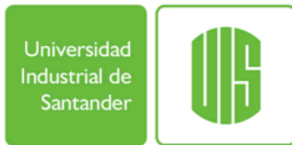
Figura 1 Logo UIS

(Fuente: El logo de la UIS fue creado por el diseñador David Consuegra - UIS.)