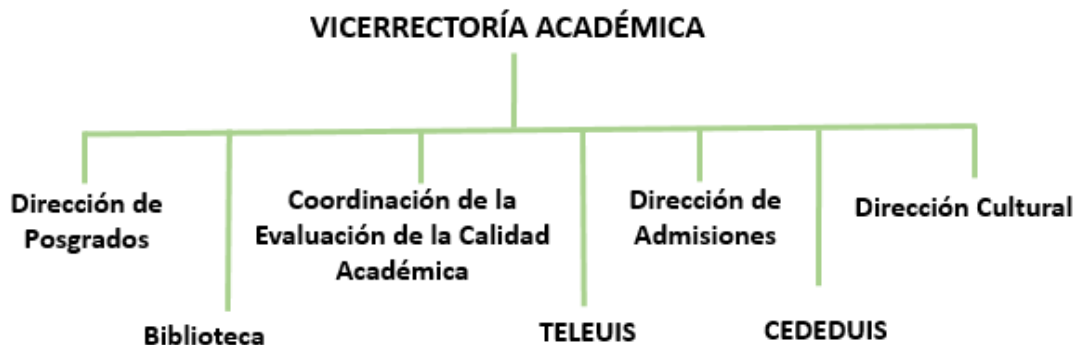
Figura 2 Organigrama de la Vicerrectoria Académica UIS

La organización de las dependencias adscritas a la Vicerrectoría Académica se muestra en la siguiente gráfica: