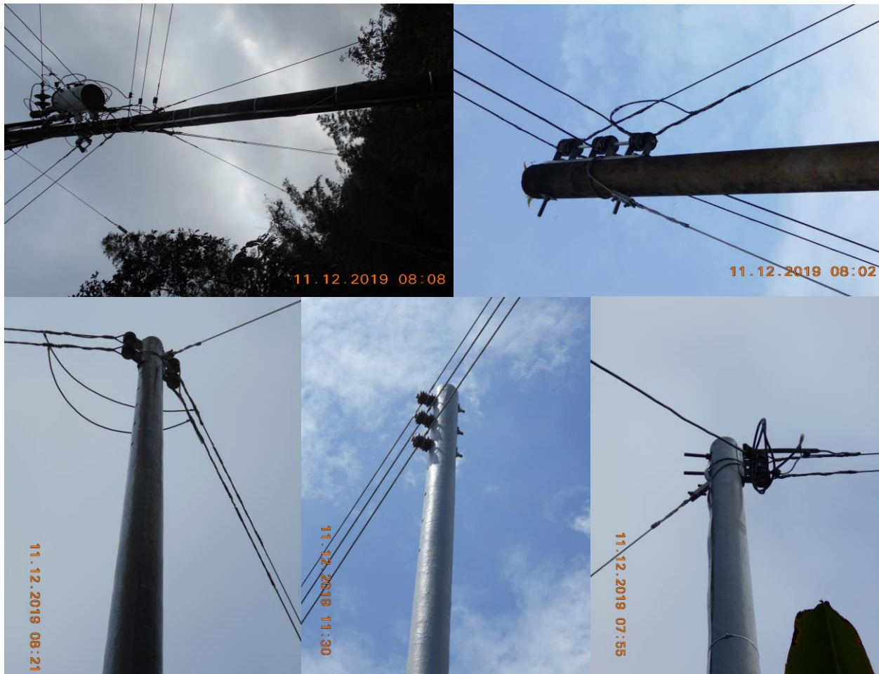
Figura 2. Fotografías Proyecto: Remodelación BT Nodos 6812-6814 Vereda La Laja del Municipio de Otanche (Boyacá). Bercall Ingeniería S.A.S (2019).

Este proyecto nace por la necesidad de remodelar el circuito de baja tensión de los Nodos 6812-6814 de la vereda la laja del municipio de Otanche, dada la antigüedad de las estructuras, presentada esta situación y haciéndose evidente el deterioro de las estructuras se hace necesaria la instalación de nueva posteria y de nuevos apoyos con el fin de dar seguridad y confiabilidad en el servicio de todos los usuarios.