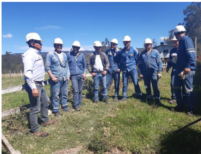
Figura 20. Cuadrilla de Trabajo. Bercall Ingeniería S.A.S (2020)

Estar a cargo de la obra, administrarla, dirigirla y estar pendiente de todo en cuanto se refiera a la construcción y finalización, son responsabilidades que tienen la implicación de encontrar éxito tanto en la ejecución como en el manejo de la obra.