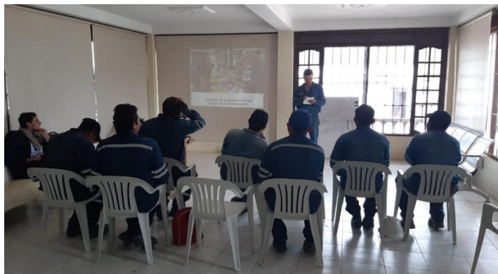
Figura 14. Seguimiento al cumplimiento de los planes de acción. Bercall Ingeniería S.A.S (2020)