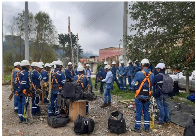
Figura 15. Reuniones de establecimiento de criterios operativos de planeación. Bercall Ingeniería S.A.S (2020)

Estas actividades se hacen necesarias ya que al seguir estas indicaciones la planeación logra y obtiene los siguientes beneficios: