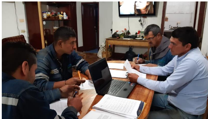
Figura 18. Desarrollo de acciones administrativas. Bercall Ingeniería S.A.S (2020)

Dado que la residencia de obra tiene como alcance de su labor el realizar acciones de tipo administrativo y técnico, esto con el fin de verificar el cumplimiento de los requisitos contractuales aplicados al contratista para el desarrollo del proyecto, es necesario evidenciar cuales son algunas de las actividades críticas que conlleva el desarrollo y desempeño en el cargo.