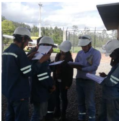
Figura 13. Revisión de normas, reglas y procedimientos. Bercall Ingeniería S.A.S (2020)