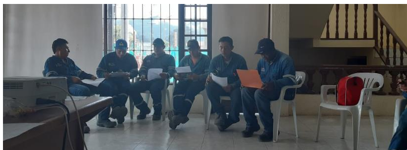
Figura 12. Reuniones de seguridad. Bercall Ingeniería S.A.S (2020)