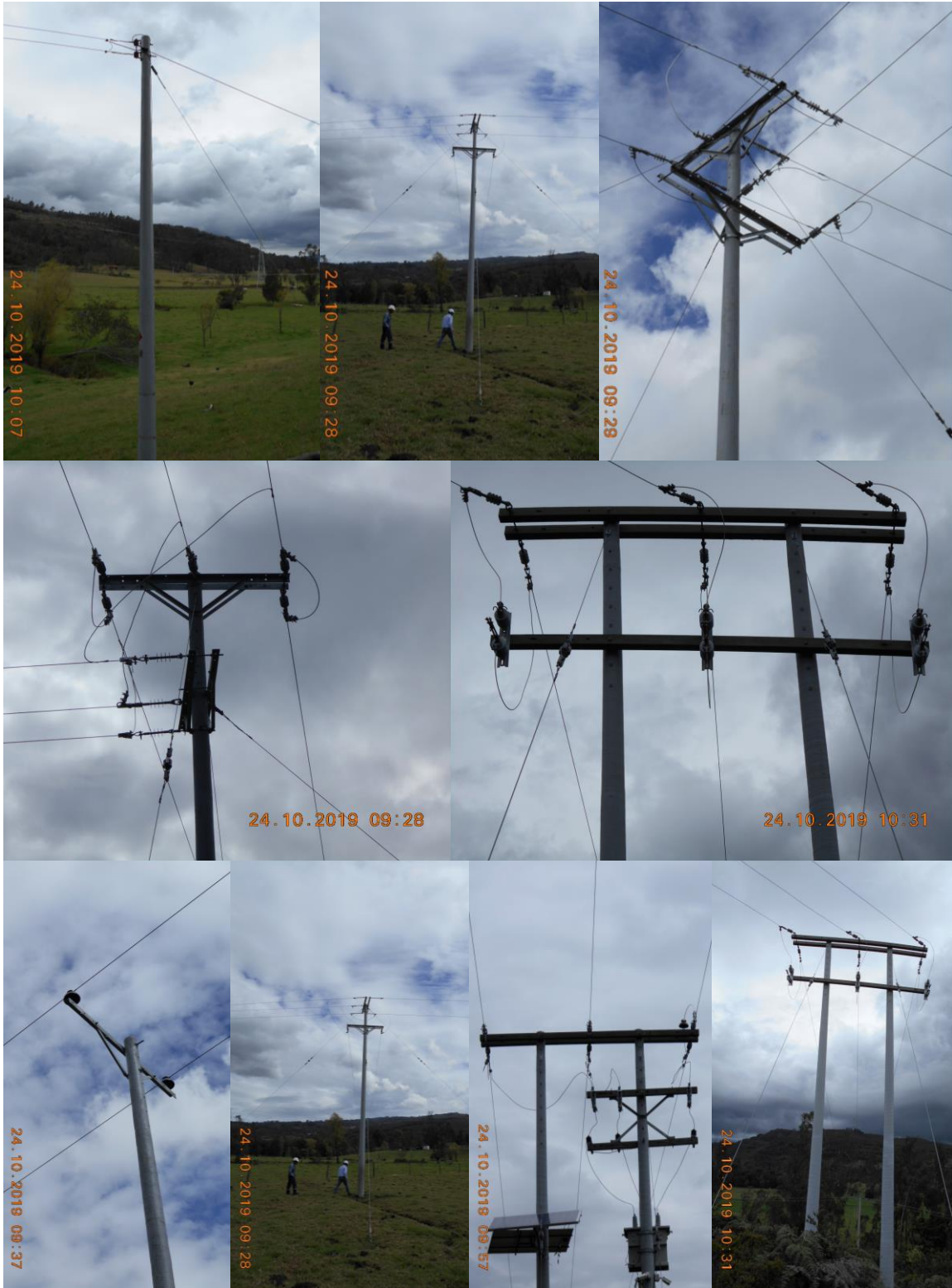
Figura 1. Fotografías Proyecto: Variante Red MT y BT Vereda Arrayanes del Municipio de Chiquinquirá (Boyacá). Bercall Ingeniería S.A.S (2019).