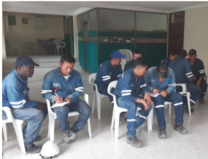
Figura 17. Ejercicios prácticos de resolución de problemas de seguridad mediante análisis de riesgos y métodos de control. Bercall Ingeniería S.A.S (2020)

Es por medio de todos los aspectos mencionados que se llevan a cabo las tareas de campo que son requeridas para una adecuada planeación de las obras en redes de distribución en los niveles de media y baja tensión.