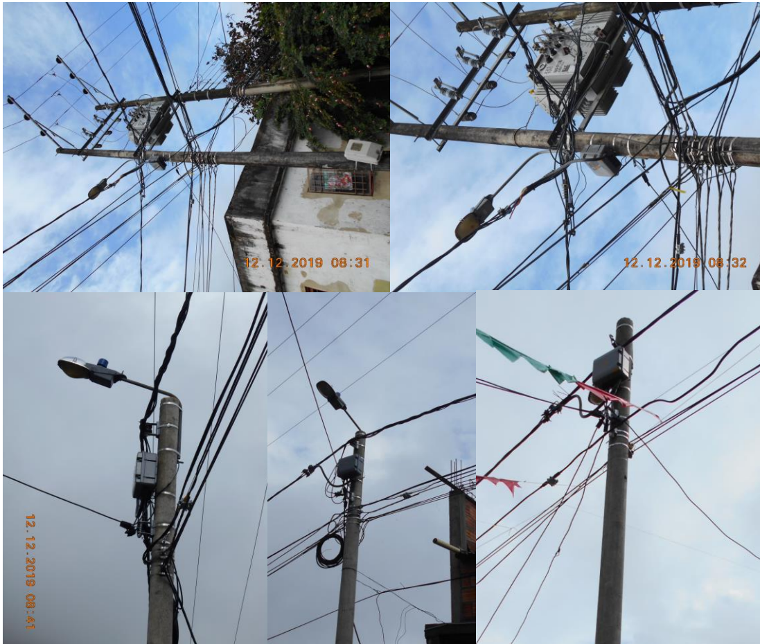
Figura 3. Fotografías Proyecto: Repotenciación Red BT Nodo 6850 Sector Casco Urbano del Municipio de Otanche (Boyacá). Bercall Ingeniería S.A.S (2019).

Se desarrolla este proyecto dada la necesidad de cambio de estructuras por su tiempo de uso, además de esto la demanda de servicio en el sector se incrementó y por ello se hizo necesario aumentar el calibre del conductor de uno número 6 y 4 a uno 0 que mejora la calidad de servicio para los usuarios, por estas razones se hacen necesarios cambios de elementos, repotenciación y construcción de una línea antifraudes con el fin de cubrir la necesidad y mitigar pérdidas para la EBSA.