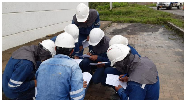
Figura 18. Desarrollo de acciones técnicas. Bercall Ingeniería S.A.S (2020)

En este aparte es necesario hacer hincapié en que cada proyecto es asignado a las empresas contratistas por las empresas de energía, con uno o varios alcances definidos que dependen del tipo de obra que se contrate. Cuando este proceso es llevado a cabo, la empresa contratista