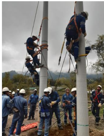
Figura 16. Elementos de seguridad y protección personal. Bercall Ingeniería S.A.S (2020)