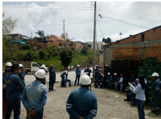
Figura 11. Capacitaciones y entrenamientos. Bercall Ingeniería S.A.S (2020)