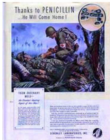
Imagen 8. Imagen de la penicilina 1947 359

Imagen de historia clínicas tomadas de los informes enviados a la dirección nacional de higiene por parte del cuerpo médico de la ciudad de Bucaramanga. 358