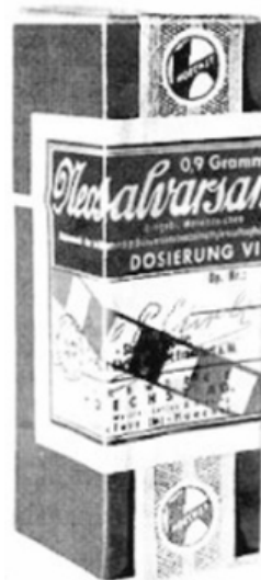
Imagen 4. Imagen tomada vanguardia liberal 1925 355