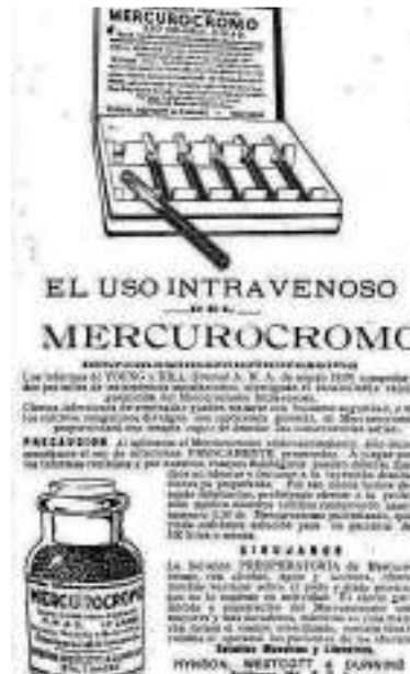
Imagen 3. Tomada de vanguardia liberal mayo 23/1920 354