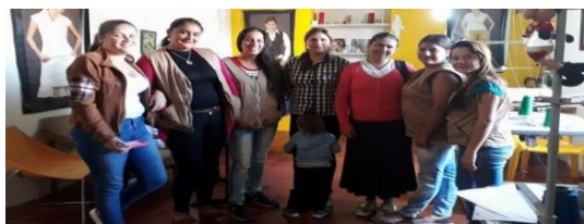
Figura 4. Integrantes del grupo focal.

También, se aportó al mejoramiento de la calidad de vida con los aprendizajes, conocimientos y enseñanzas que se lleva el grupo de esta propuesta de intervención, según la opinión de las mujeres asistentes a la evaluación, fue un proceso de superación, de no quedarse ahí, de salir adelante. Por lo tanto, es necesario realizar procesos que aporten de manera técnica en un propósito, que a su vez deje un mensaje de vida a la población.