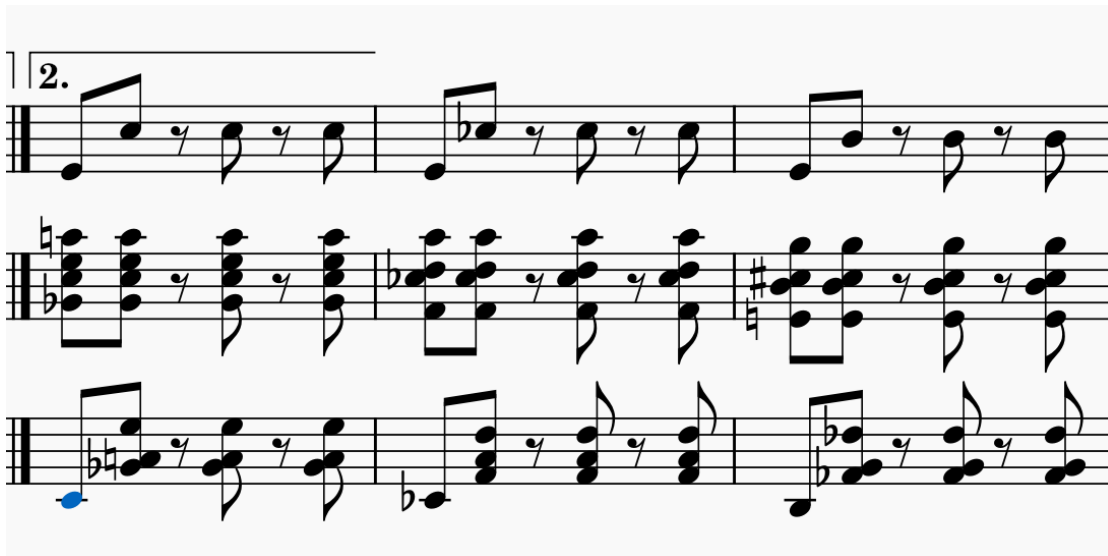
Figura 5. Fragmento de obra

Este puente da paso a la sección B que a su vez está compuesta de b y b' con su respectiva repetición, posteriormente se encuentra un puente que conecta con la sección C donde la obra armónicamente cambia a su paralelo mayor compuesta por c, c' y c'' en ese mismo orden y con la repetición respectiva de esta sección, dando paso a una reexposición de la obra, llegando hasta c'' para conectar con el final de la obra que tiene la particularidad de terminar con el motivo de acordes disminuidos.