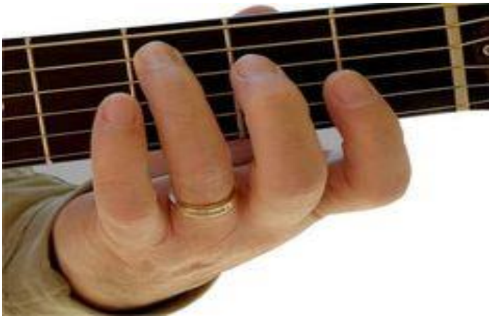
Figura 4. Ejemplo de primera posición

Nota: La gráfica representa el ejemplo de una primera posición en un instrumento musical.