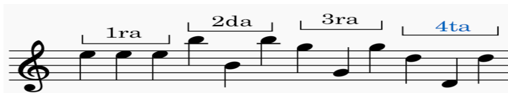
Figura 3. Afinación del tiple en Do, con cuerdas al aire

Nota: La ilustración refleja la afinación en DO de las cuerdas al aire del tiple y su ubicación en el pentagrama.