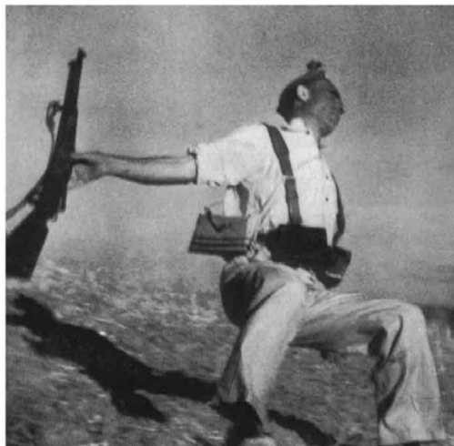
Figura N° 18. Muerte de un Miliciano.

Imagen tomada de: www.images.google.com .Roberto_Capa. \ (10.25.07)