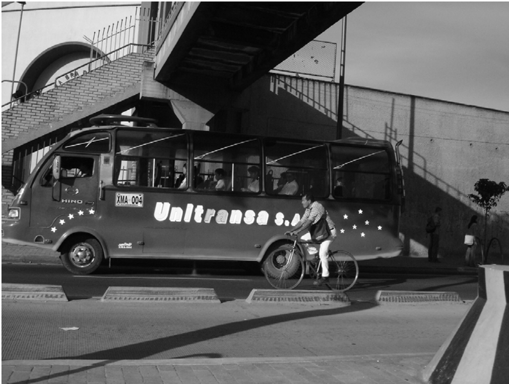
Figura N° 22. Transeuntes.

Una realidad cotidiana que se percibe en día laboral, lograda a tempranas horas del amanecer, donde el sol irradia sus primeros rayos de luminosidad, agilizando con su intensidad al transcurrir el horario de los que con su afán debe ir a trabajar.