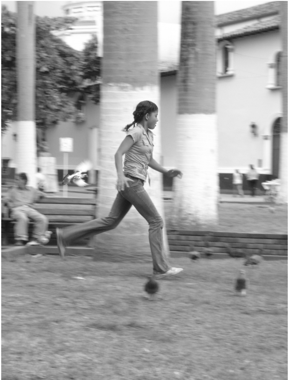
Figura N° 25. Recreación.

Esta imagen refleja la intuición de desplazarse por un largo pasillo solitario y con un ambiente de penumbra, sobre un puente peatonal.