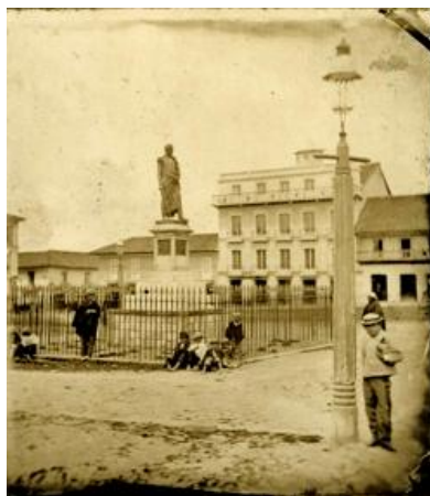
Figura N° 3. Anónimo. Estatua y Plaza de Bolívar.

mediados de los siglos XIX al XX, Las colecciones de historia y de los diversos períodos del arte colombiano, son mostradas como la evidencia de que en Colombia se transformo la fotografía de un pasatiempo a una novedosa técnica, las cuales sirvió a numerosos pintores, como un medio expresivo que desplazaría la pintura y que con el paso de los años se convirtiera en una herramienta indispensable para los artistas gráficos, del país. Sobre esta historia se han elaborado varias documentos para los cuales hago relevante algunos de ellos y los menciono textualmente: