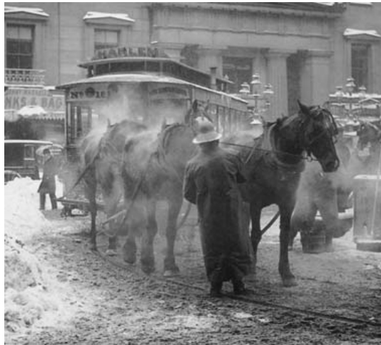
Imagen tomada de: www.Wikipedia.org/wiki.lfred_stieglitz (10.25.07)