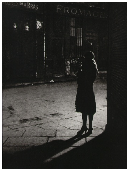
Figura N° 14 Paris Nocturna. Obra de Brassai

Imagen tomada de: www.images.google.com.brassai . \ (10.25.07)