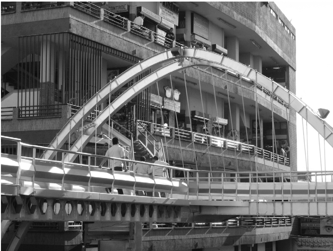
Figura N° 26 Sin Titulo.

Esta imagen, pone evidencia, la infraestructura que se localiza en un trayecto peatonal, un ambiente de congestión, donde el espacio es habilitado para aislar a los individuos de una espacio diseñado para el recorrido vehicular.