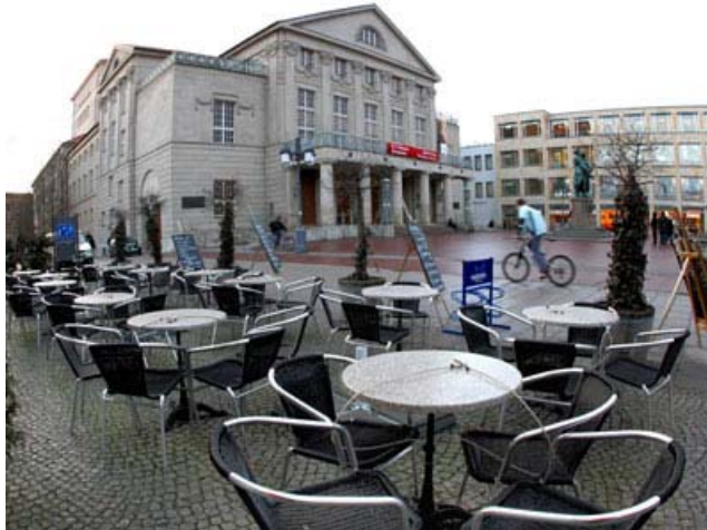
Figura N° 5 Ciudad Weimar centro de Alemania