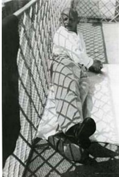
Figura N° 7 Obra Fotográfica sin título Moholy Nagy