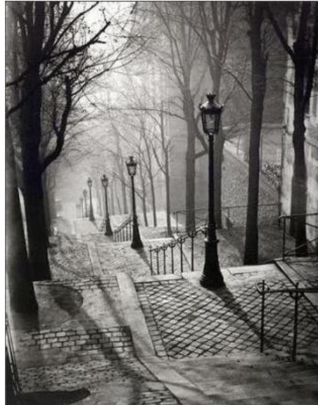
Figura N° 15. Fotografía de un sector de la ciudad de Paris Nocturna.