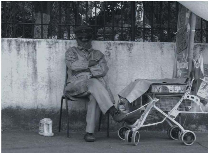
Figura N° 21 Añoranza

Esta imagen lograda en un momento casual, proyecta el comportamiento de un individuo, que comercializa productos en una de las calles históricas del centro de la ciudad, calle 45, frente al Cementerio Central, es una figura que cobra importancia en el momento en que se inmortaliza la imagen a través del lente, logrando expresar la fisonomía de un personaje que para muchos pasa desapercibida.