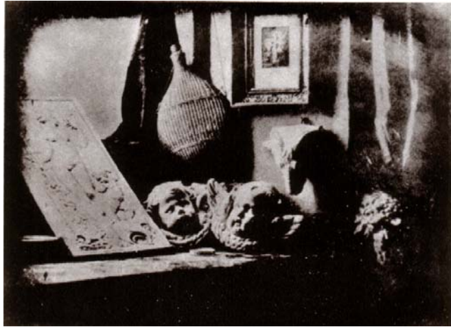
Figura N° 1: Imagen del primer Daguerreotype. Daguerie Atelier 1837

La fotografía desde sus inicios se ha convertido en una posibilidad innata de todos los artistas que configuran la Imagen como el elemento dinamizador de su obra y por tal motivo es importante mencionar de una manera de consulta bibliográfica la interpretación que hace Leonardo Da Vinci en uno de su manuscrito donde menciona: