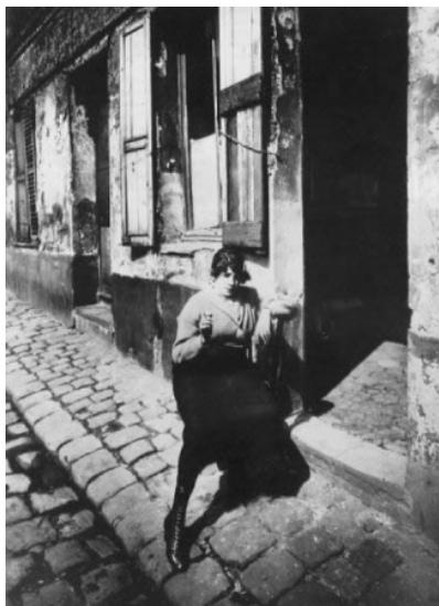
Imagen tomada de: www.biografiasartistas.com . \ (10.25.07)