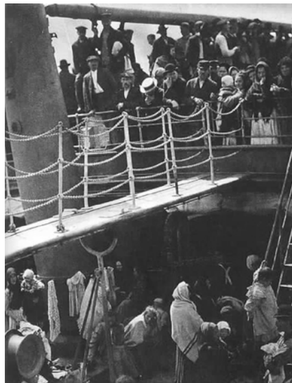
Figura N° 11 . Alfred Stieglitz, The Steerage, 1907