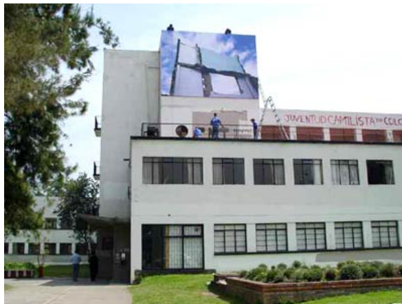
Figura N° 4: Montaje de valla, proyecto Colectivo Trailer