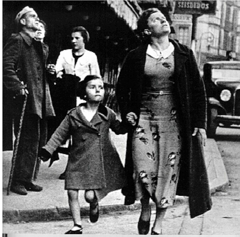
Figura N° 19. Alarma de Bombardeo Roberto Capa.