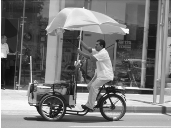
ANEXO D: Registro fotográfico, del recorrido Octubre 19 2007