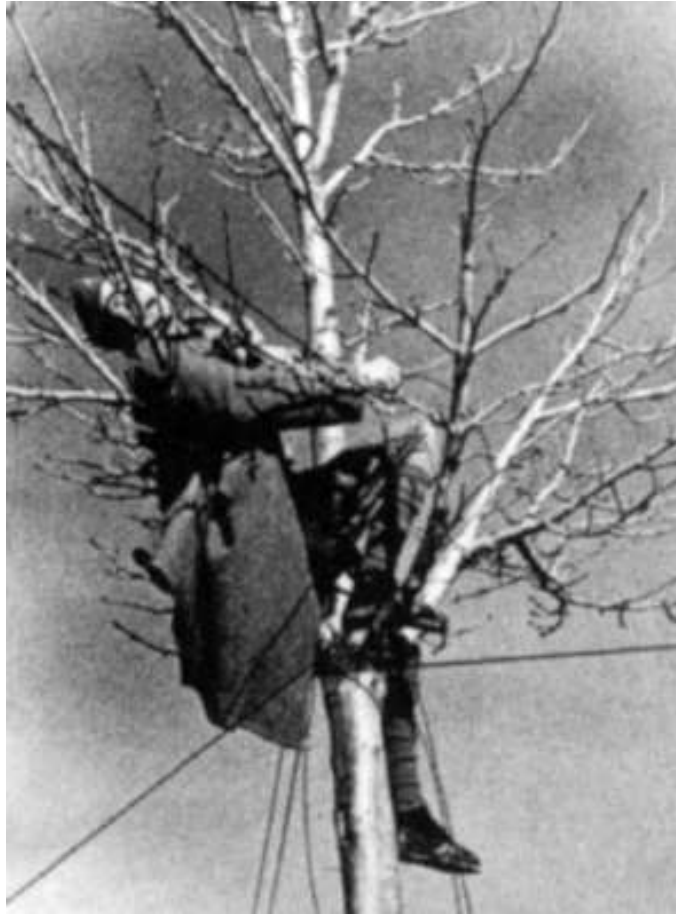
Figura N° 20. Soldado muerto mientras tendía las líneas telefónicas /Teruel 1937 Capa.

Imagen tomada de: www.images.google.com .Roberto_Capa. \ (10.25.07)