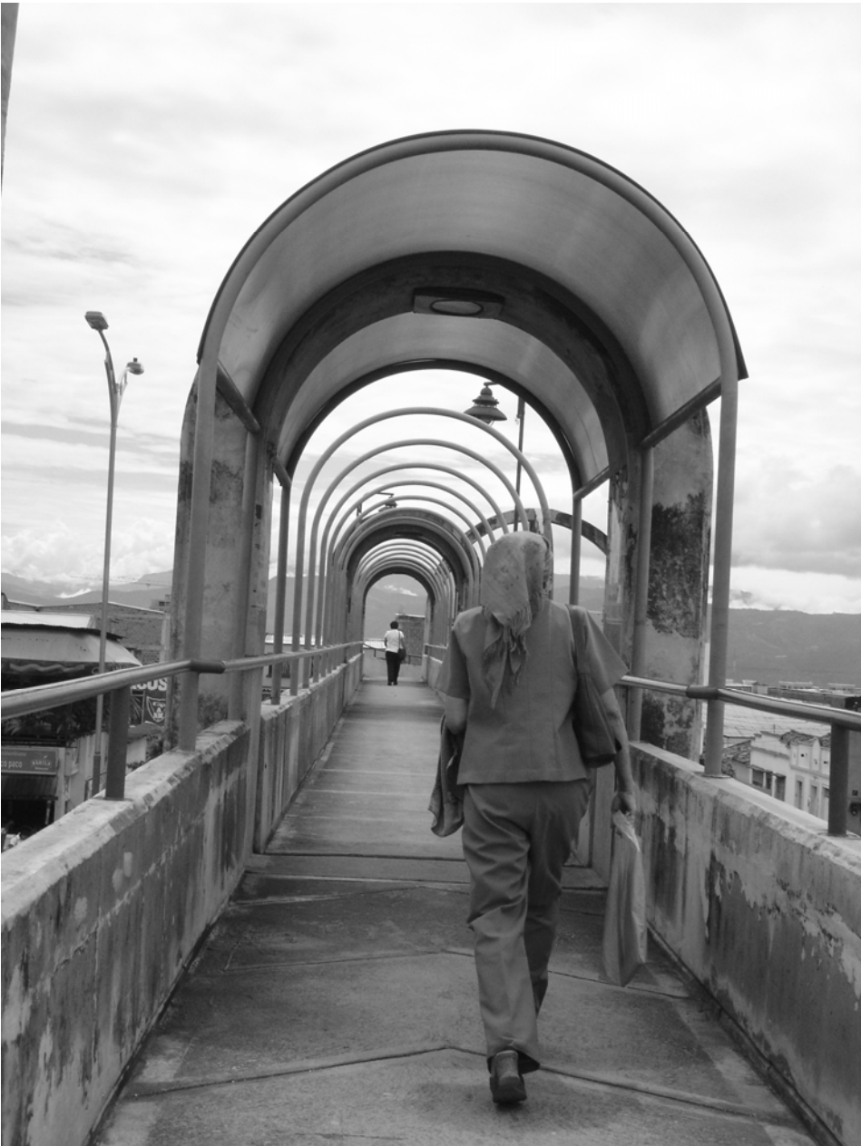
Figura N° 24. Peatón

de domingo en un sitio popular de Bucaramanga, conocido como el Parque Centenario.