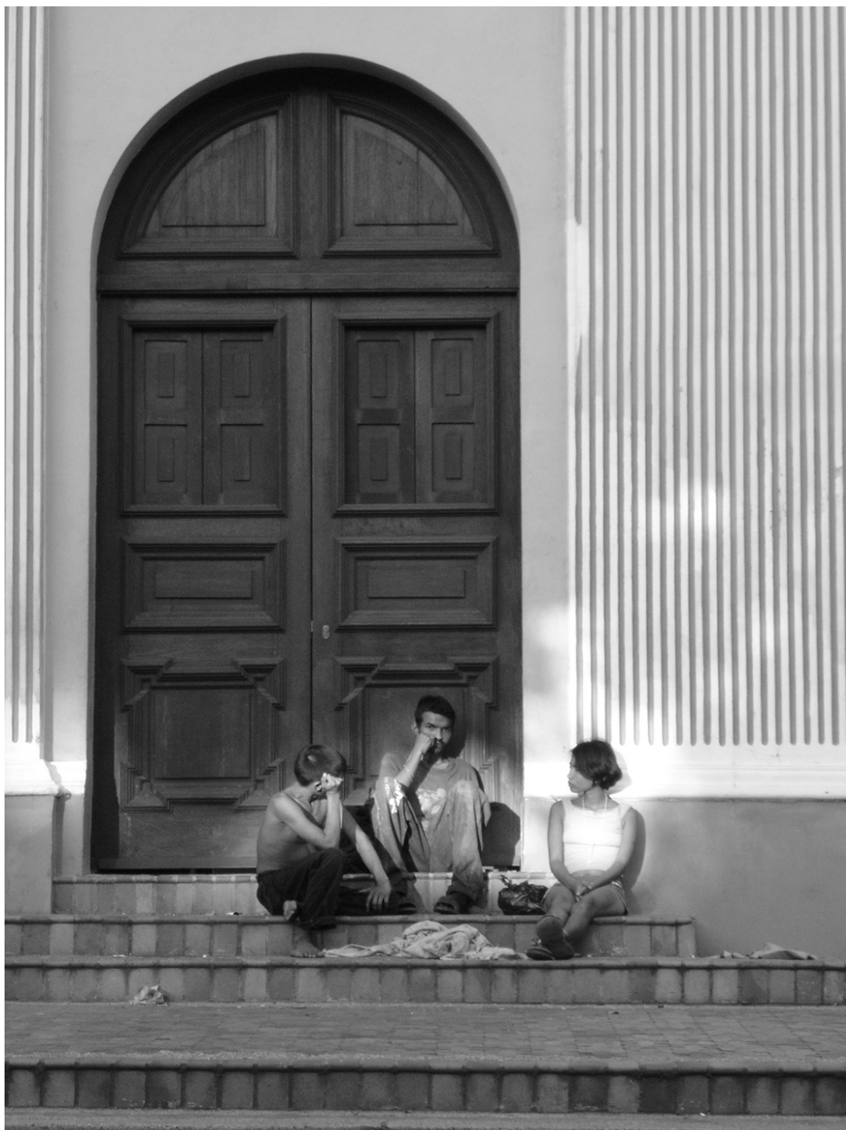
Figura N° 23. Bendigos en una tarde de domingo

El ambiente de desolación, acapara el ocio y se agotan las ilusiones, y la capacidad de sentirse útiles en la sociedad. Esta imagen se logro en una tarde