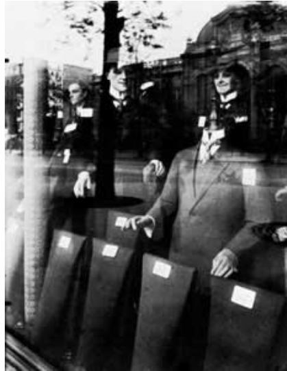
Imagen tomada de: www.images.google.com/eugene_atge . \ (10.25.07)