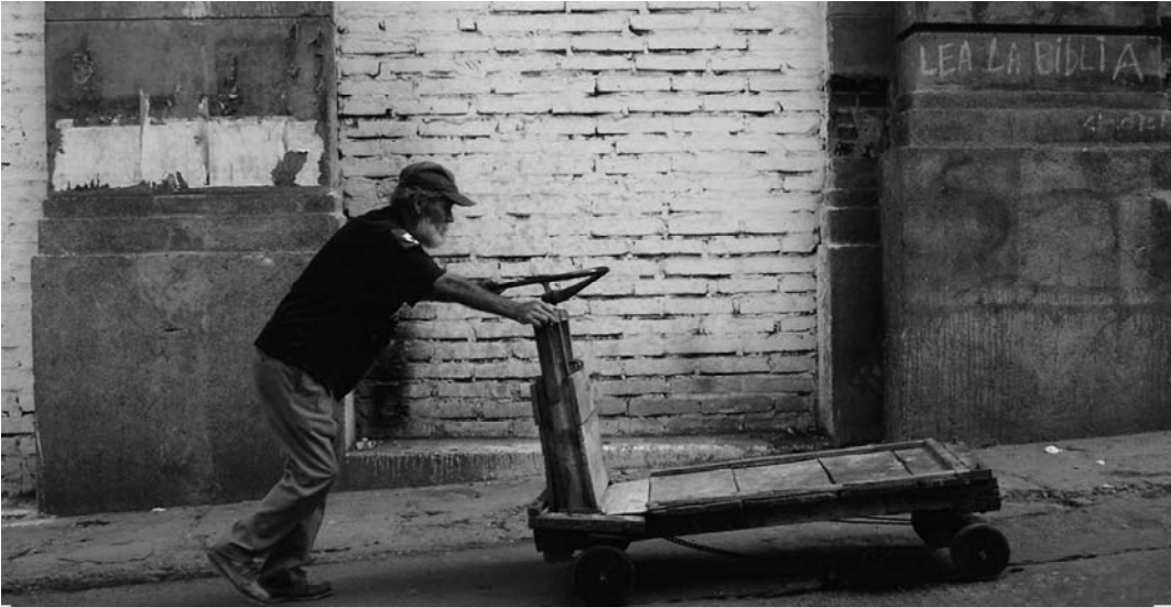
Figura N° 28 . Sin Titulo.