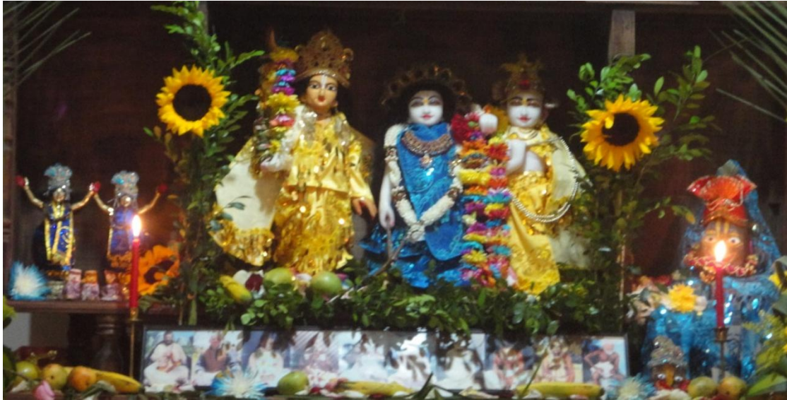
Figura 2: Deidades en el templo del centro de Bucaramanga durante un festival.

El servicio devocional es el centro de la religión Vaisnava. Todo el que desee liberarse tiene que renunciar al fruto de su trabajo y a la complacencia de los sentidos para dedicarse en cuerpo y alma a Krishna 56 . Éste proceso es denominado conciencia de Krishna, ya que es mediante la práctica devocional que el devoto se concientiza de su naturaleza de servidor de Dios. A partir de ésta práctica todos los sentidos y las facultades humanas se liberan ya que son utilizadas para alabar a Krishna permanentemente 57 .