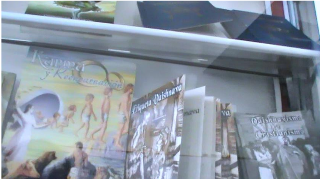
Figura 10: Libros publicados por el ISEV en el templo de Bucaramanga.

Aunque estos textos fueron pensados originalmente como herramientas de estudio, no todos son de tipo académico, pues en el ISEV también se elaboran títulos de tipo informativo a modo de memorias que registran la labor que la comunidad Hare Krishna. Sin importar el tópic o el motivo de la publicación existe una cosa que todas estas tienen en común: una invitación a los Festivales de los diferentes templos del país junto a las direcciones en las cuales se encuentran y los que ofrecen (festivales, obras de teatro, música, conferencias, comida vegetariana, etcétera).