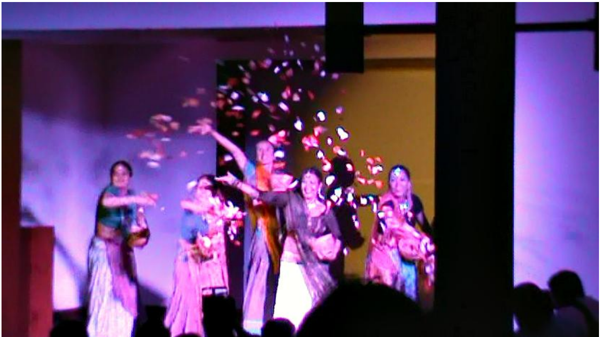
Figura 11: Bailarinas durante un evento cultural realizado en la Casa del Libro Total, Bucaramanga.

Fueron libros como el Bhagavad-Gita , los cuales avivaron su interés en esta religión; también hay que mencionar que esto fue todo un proceso que duró aproximadamente 4 años, durante los cuales concluyó sus estudios universitarios y obtuvo un trabajo estable. Sin embargo las inquietudes que le despertaron dichas escrituras lo llevaron de nuevo a un templo Hare Krishna, esta vez en la