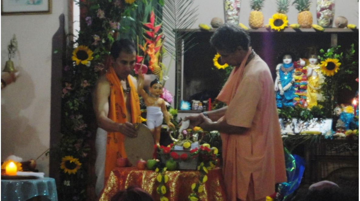
Figura 4: Baño ritual a las deidades ( Abisheka ) que se realiza en las festividades.

La expresión religiosa más importante en el Vaisnavismo es el canto de los nombres de Dios ( Sankirtan ): a través de la repetición de una frase sagrada ( Mantra ), el devoto invoca el amor de Krishna y purifica tanto su propio cuerpo y su propia mente cómo las de aquellos que lo escuchan 115 . Se considera que cantar éste mantra es lo único que pueden hacer las almas caídas en esta era 116 , ya que cantarlo es tan sencillo que cualquier alma puede hacerlo. El mantra es el siguiente: