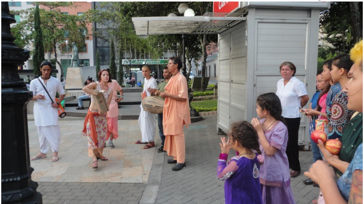
Figura 16: Devotos Hare Krishna en el Parque Santander de Bucaramanga.

Una de las pequeñas diferencias entre los devotos que nacen dentro de la conciencia y los conversos está en su nombre civil, pues los hijos de los devotos son registrados y llamados con nombres en sánscrito (que posteriormente cambia por el nombre dado en la primera iniciación por el maestro espiritual) mientras que los devotos conversos suelen tener nombres que se consideran como del común, esto podría llegar a generar discriminación o situaciones incómodas principalmente durante su etapa escolar 260 .