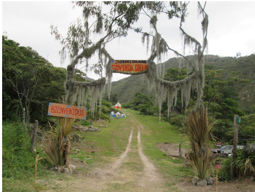
Figura 12: Entrada a Govinda-Dham, Pamplonita (N. de Santander).

No obstante, este proyecto no es para uso exclusivo de los devotos. Por el contrario, las ecoaldeas son lugares abiertos a todo el mundo con el propósito de difundir su proyecto de preservación del ambiente y vida auto-sostenible. Con esta motivación que se realizan diversas actividades en dichos lugares abiertas el público, como las caminatas ecológicas o el yoga. Estas actividades al aire libre han tenido gran aceptación, ya no solo son divulgadas por los miembros de la comunidad, sino también por los medios de comunicación, que lo muestran como una alternativa que vale la pena experimentar: