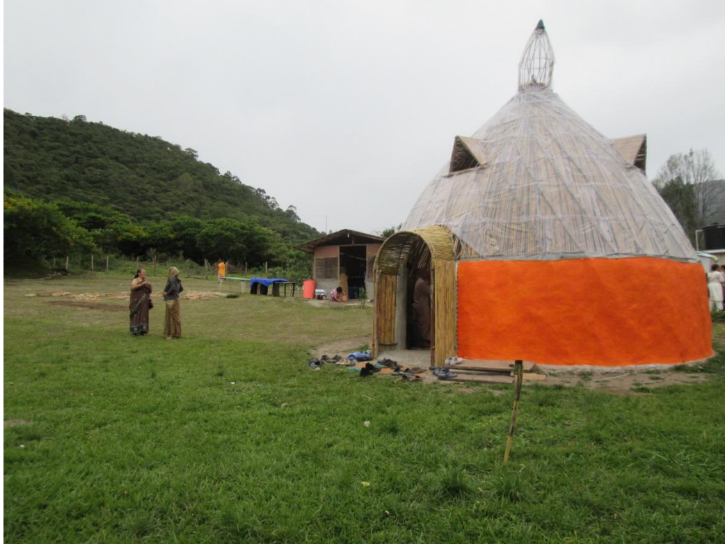
Figura 13: Interior de Govinda-Dham, Pamplonita (N. de Santander).

Estas relaciones han cambiado mucho conforme el movimiento ha crecido y ha adoptado diversas estrategias para darse a conocer y para tratar con el mundo exterior. Al ser un movimiento mucho menos restringido socialmente, en comparación con ISKCON, los devotos no tratan de alejarse de la sociedad sino de crear su propio espacio dentro de ella. Sin embargo estos espacios no son fácilmente reconocibles pues la mayoría de los devotos en Colombia no suelen llevar ropa devocional ni, en el caso de los hombres, el peinado tradicional ( Sikha , Figura 14). Es importante aclarar que este fenómeno no es impulsado por el temor a la represión, sino por asuntos prácticos, sobre todo a la hora de buscar empleo o de realizar trámites con el Estado: