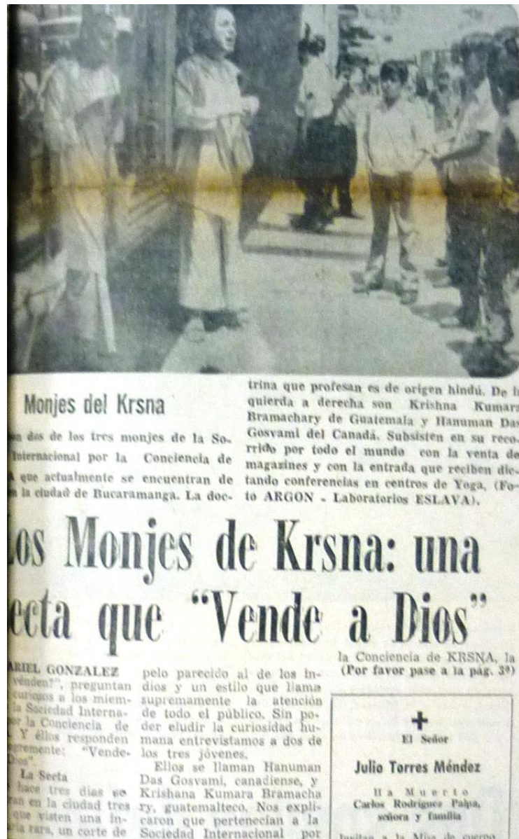
Figura 6: Fotografía de los devotos Hare Krishna en el periódico Vanguardia Liberal de Bucaramanga