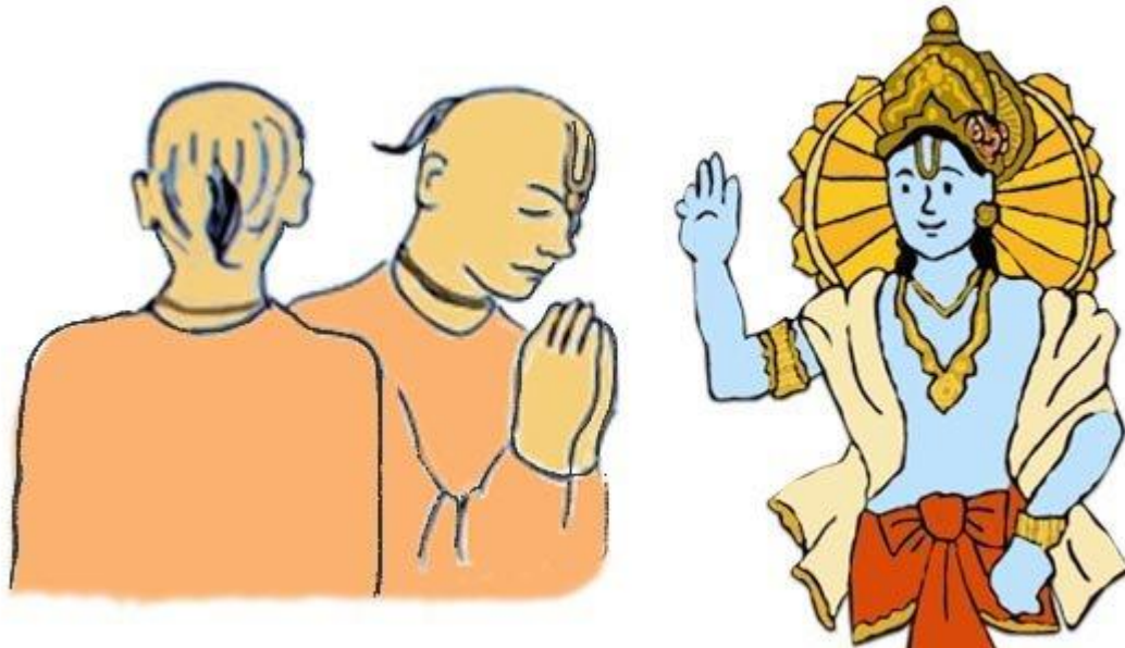
Figura 14: la Sikha , el peinado tradicional de los devotos Vaisnavas

Fuente: ¿Por qué los hombres Hare Krishna se afeitan la cabeza? EN: http://hare-krisna.blogspot.com/2008/04/porqu-los-hombres-hare-krisna-se.html [Visitado el 29 de Enero de 2014]