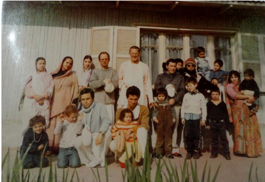
Figura 15: Los devotos en Vársana (Granada - Cundinamarca), mediados de los años 80.