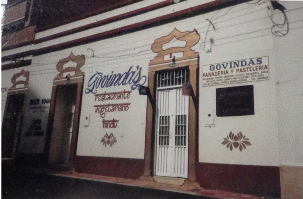
Figura 9: El primer restaurante Govinda's de Bucaramanga, localizado en la carrera 20 con calle 35.