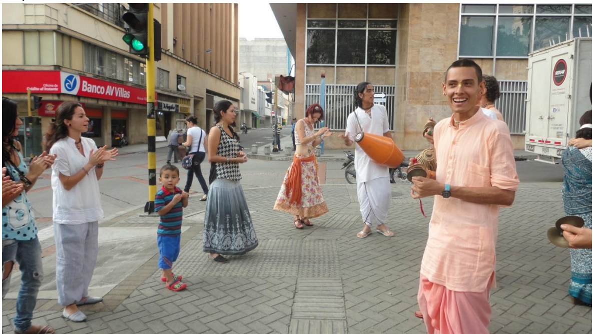
Figura 1: Devotos Hare Krishna en el parque Santander, Bucaramanga. Septiembre de 2014

Alguna de éstas estrategias, o quizás otra, tuvo que ser implementada en la historia de la comunidad Hare Krishna, pues de no ser así, los devotos no seguirían siendo parte del panorama que observan los transeúntes que pasan por el parque Santander.