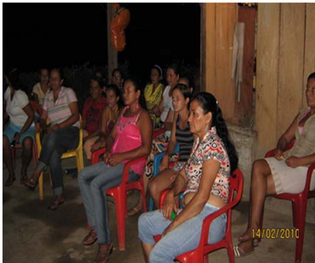
Figura 8 Taller sobre salud Mujeres campesina de la Vereda Aguas Lindas y el corregimiento la virgencita

Al inicio de la sesión se presentó una dificultad con el CD que contenía el video con la información para la validación, por tanto hubo necesidad de cambiar la metodología, se planteó entonces un conversatorio que diera cuenta del objetivo planteado para este primer taller.