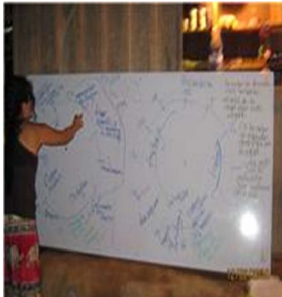
Fotografía 3 Reloj rutina de actividades de las mujeres de la Vereda Aguas Lindas

En la actualidad las familias de esta zona rural están dedicadas a barequear en el río, es decir sacando pequeños gramos de oro para poder subsistir. En la vereda La Unión la economía es básicamente de extracción maderera y cultivos de hoja de coca, por lo cual algunas mujeres de este lugar están dedicadas a las labores domésticas y a la cría de algunas especies menores que tienen en sus fincas.