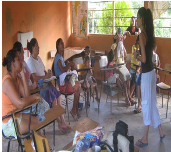
Fotografía 5 Taller de retroalimentación de diagnóstico. Vereda la Unión