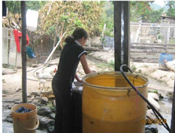
Fotografía 6 Niña campesina de la Vereda la Unión lavando

Violencia: es necesario resaltar que la violencia a la que está expuesta la mujer dentro del hogar y en la comunidad, no es fácilmente identificable por ellas, esto se evidencia cuando ellas en un primer momento niegan la existencia de la violencia sexual y cuando se explica en los talleres y se dan algunos elementos conceptuales de la violencia sexual, analizan e interiorizan que esto sí está presente en la vida de las mujeres, esto se explica debido a su concepción, la