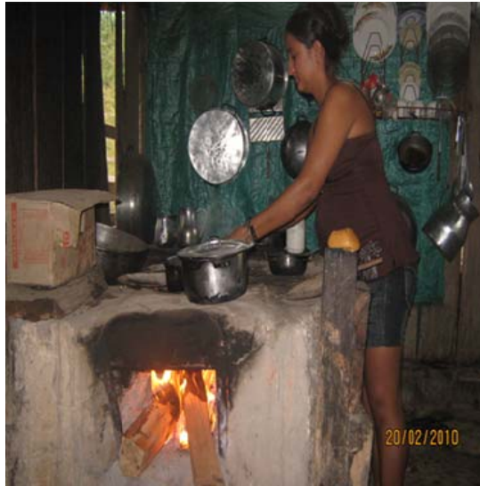
Fotografía 1 Mujer campesina de la vereda la unión cocinando

Lo anterior conlleva a que las mujeres deban realizar dobles y hasta triples jornadas de trabajo en el hogar, en las labores agrícolas, vender su fuerza de trabajo en labores extra domésticas en los raspaderos , como forma de conseguir recursos económicos para el sostenimiento del hogar, sin embargo este trabajo no es bien remunerado y con las fumigaciones llevadas a cabo en estas regiones las posibilidades de trabajo para las mujeres se reduce, ya que de alguna manera el cultivo de hoja de coca garantiza la solvencia económica para este sector de campesinos, no obstante también genera otros problemas, como las constantes presiones por la erradicación manual del cultivo, fumigaciones, las persecuciones del Estado frente a los campesinos cocaleros, debido a que este tipo de cultivo es ilegal y tiene repercusiones jurídicas, lo que ha generado capturas masivas de campesinos y campesinas en la región.