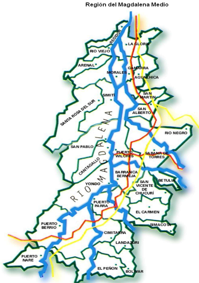
Figura 1 Región del Magdalena Medio según el PDPMM

Asimismo, tiene una ubicación privilegiada en relación a otras regiones de Colombia, la ciudad epicentro es Barrancabermeja principal puerto petrolero del país, estos departamentos tienen riquezas de todo tipo, tales como el petróleo, carbón, oro y uranio y además crea condiciones excepcionales en la posibilidad de construcción de mega proyectos energéticos como la producción de biodiesel y la construcción de la hidroeléctrica del Sogamoso, tal y como se describe a continuación: