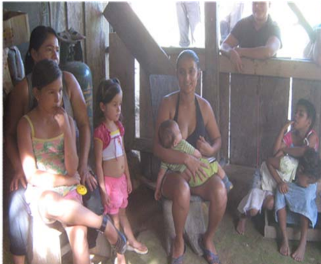
Fotografía 7 Taller sobre violencia de género, Vereda la unión

En relación al tema de educación formal plantearon que es un problema que afecta a toda la comunidad, por tanto depende de ella la exigencia a la administración municipal de un/a profesor/a permanente que atienda las demandas escolares, una de las propuestas más significativas es la constitución de un comité de mujeres que se encargaría de interlocutar con las instancias gubernamentales con el fin de solucionar estos problemas, no solo de las mujeres sino de la comunidad en general, de igual forma que sean ellas las receptoras e impulsoras de los proyectos productivos que lleguen a la comunidad, plantean además que esta organización debe estar apoyada por la junta de acción comunal y que la ACVC participe como veedora de este comité.