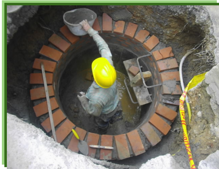
FIGURA 10 – CONSTRUCCIÓN DE LA ESTRUCTURA EN MAMPOSTERIA

Como se aprecia en la figura la profundidad del pozo es considerable aproximadamente 4m, aquí vemos a el maestro levantando la mampostería del pozo de inspección