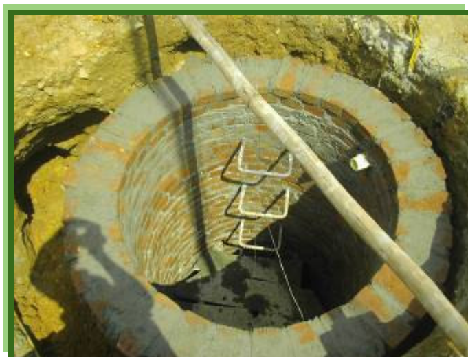
FIGURA 8 – POZO DE INSPECCIÓN

Apreciamos ya construido el pozo de inspección antes del cono de reducción, se observan también los pasos para el acceso futuro de los inspectores para el correspondiente mantenimiento