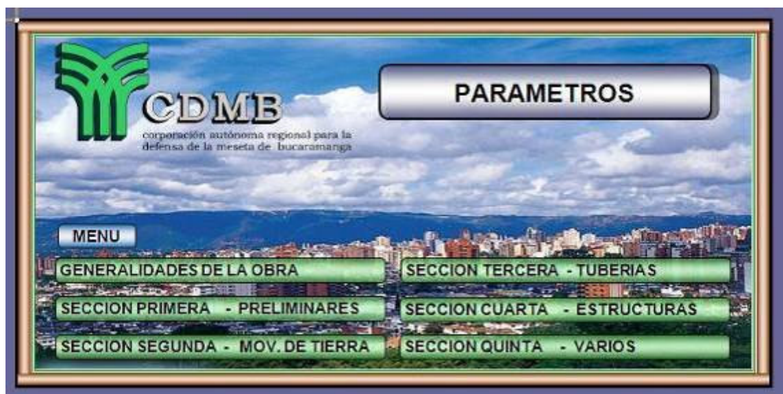
Figura 15. Parametros

cual podremos ver los resultados una vez hayamos ingresado todos los parámetros de diseño y construcción de nuestro proyecto de alcantarillado , también encontramos los botones de ingreso de las generalidades de la obra y los parámetros para calcular el costo de cada una de las actividades que implican la construcción de un proyecto de alcantarillado, actividades que la CDMB ha organizado en cinco grandes grupos llamados secciones, estas se deben manejar de esta manera y no ser cambiadas debido a que el presupuesto que se debe entregar a la entidad de una obra de alcantarillado deberá ir organizado de esta manera y en un formato estandarizado que lo encontraremos aquí en la base de datos.