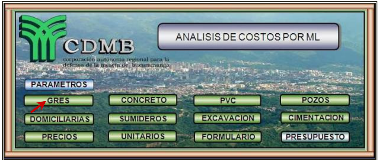
Figura 24. Análisis de Costos