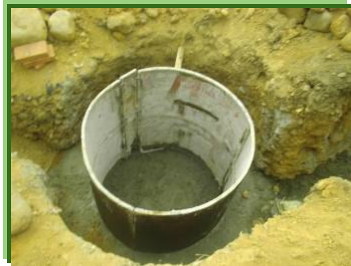
FIGURA 5 – EXCAVACIÓN Y FORMALETA DE LA ESTRUCTURA POZO

En esta figura se puede observar la excavación de l pozo de inspección y los tramos de llegada y salida, también se observa la formaleta para fundir la estructura pozo en concreto que va a atracar la tubería de los tramos de llegada y salida.