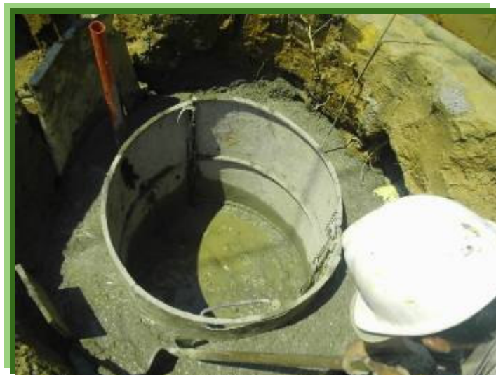
FIGURA 6 – FUNDICIÓN DE LA ESTRUCTURA POZO

Apreciamos la fundición de la estructura pozo en concreto luego de haber instalado la tubería de los tramos de llegada y salida como también la tubería de aireación