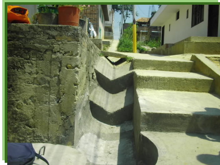
FIGURA 12 – CONTROL PLUVIAL EN ZONAS PEATONALES

Aquí apreciamos el control de aguas lluvias mediante canaleta lateral con una serie de caídas para disipar la energía del agua debido a las grandes pendientes de estos asentamientos ubicados en zonas de ladera