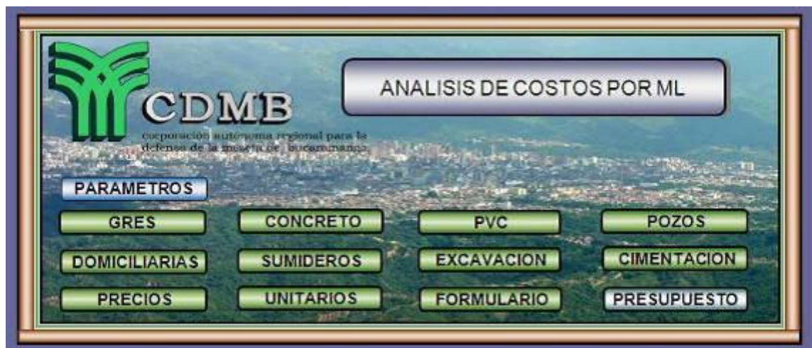
Figura 14. Menú Principal

La base de datos está compuesta por una ventana principal o menú en el que encontramos todas las opciones de acceso a la base de datos, ya sea para ingresar datos, evaluar resultados, tener acceso a la información técnica o revisar los análisis de precios unitarios y el presupuesto como lo podemos ver en la figura 1