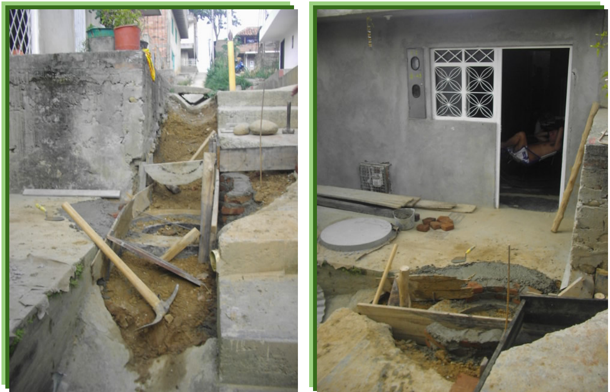
FIGURA 9 – EXCAVACION Y CONSTRUCCION DEL POZO DE INSPECCION

Debido a que la mayoría de los proyectos de alcantarillado del grupo de mercadeo corresponden a asentamientos subnormales, se presentan situaciones como las que se aprecian situaciones donde las redes y los pozos de inspección quedarán situados prácticamente sobre la entrada de las viviendas como se aprecia en la imagen, ya que no se proyectaron vías peatonales y mucho menos vehiculares cuando se empezaron a construir estas viviendas lo que implica que exista muy poco espacio para construir sistemas de alcantarillado, otra de las situaciones que complica la construcción de estos sistemas es que por lo general estos asentamientos se encuentran ubicados en zonas de laderas donde las pendientes del terreno son muy fuertes por lo que las excavaciones y los pozos se profundizan mucho dificultando la construcción y elevando los costos