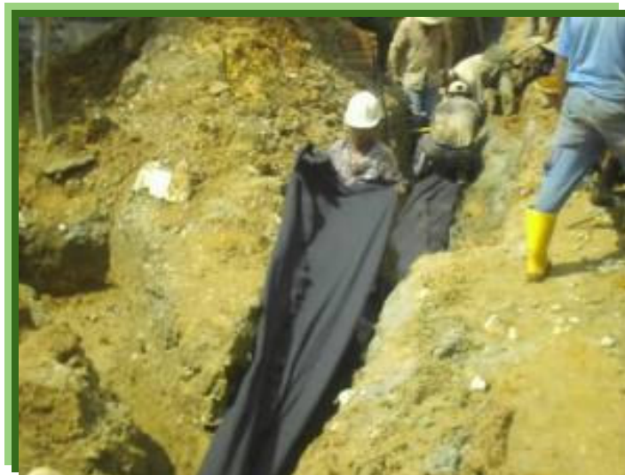
FIGURA 4 – INSTALACIÓN DE MANTO GEOTEXTIL

En la figura vemos como se recubre la tubería perforada con tela geotextil para la instalación de los filtros