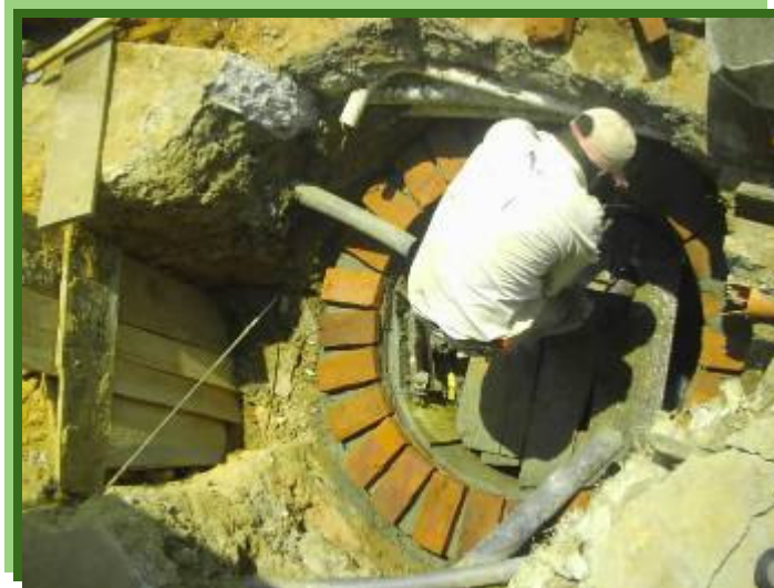
FIGURA 7 – CONSTRUCCIÓN DEL POZO DE INSPECCIÓN

En esta figura apreciamos a el maestro levantando la primera hilada de la estructura en mampostería del pozo de inspección, luego de haber fundido la estructura pozo en concreto; como apreciamos el tramo de alcantarillado ya ha sido instalado y se ha instalado un trincho para sostener el relleno de la excavación mientras se termina de levantar el pozo de inspección.