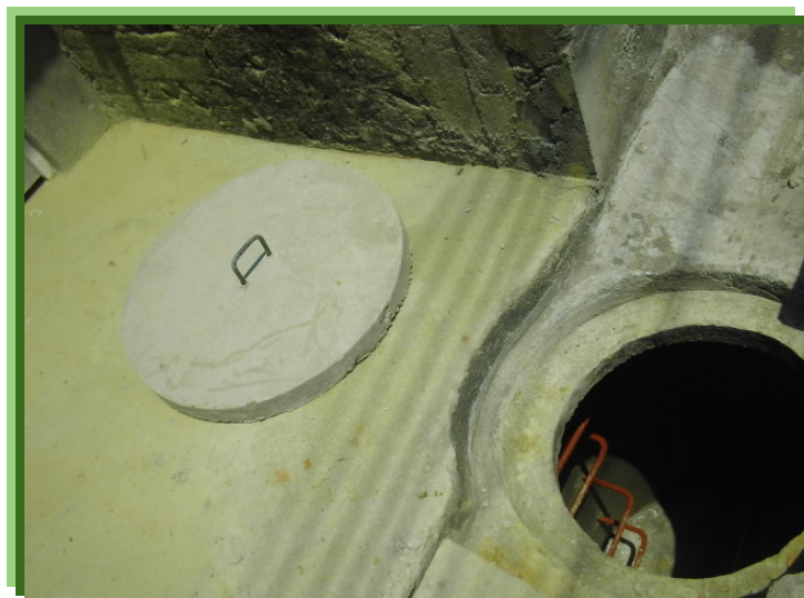
FIGURA 11 – POZO DE INSPECCIÓN TERMINADO

Finalmente vemos como ha quedado el pozo de inspección con su respectiva tapa en concreto y los pasos con pintura anticorrosiva