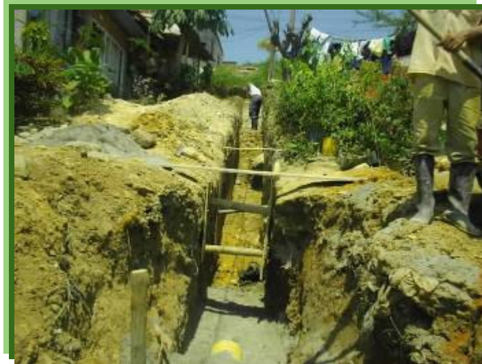
FIGURA 3 – INSTALACIÓN DE LA TUBERIA

Observamos la instalación de la tubería y la excavación del tramo de alcantarillado entibada para sostener las paredes laterales