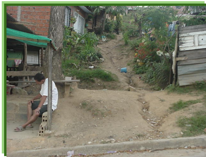
FIGURA 2 – VISTA INFERIOR DEL TRAMO DE ALCANTARILLADO