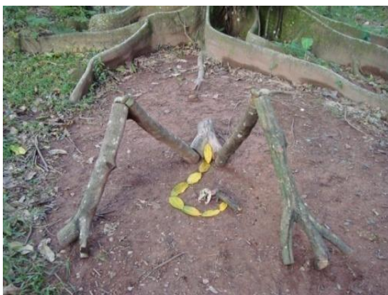
Figura 20. Engendro de muerte 2012, escultura

Esta segunda intervención se basa en la elaboración de una figura humana femenina creada con materiales vegetales y elementos orgánicos, (ramas de árbol, hojas secas, huesos de res, cráneo de perro). Que exhibe como en lo dicho por Lowell “Todo hombre nace con el germen de la obra que ha de cumplir en esta vida.” 10 . Una imagen escultórica, que representa una silueta de mujer en posición de alumbramiento a un engendro de muerte.