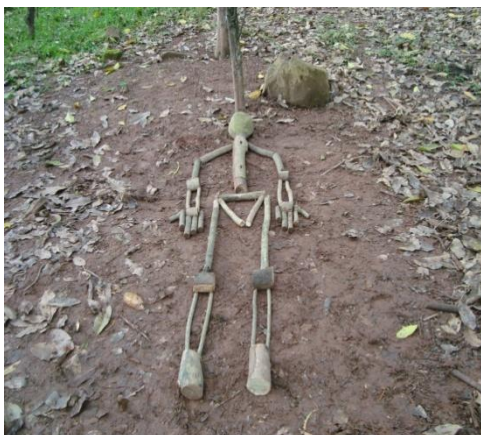
Figura 3. Extinguido por inconsciencia, escultura