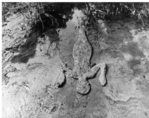
Figura 9. Ana Mendieta, Silueta #3, 1985

La artista Ana Mendieta la escojo como referente artístico por las siguientes razones: vale la pena nombrar a Goethe con su frase celebre “La naturaleza y el arte parecen rehuirse, pero se encuentran antes de lo que se cree” 9 es así como Ana desarrolla a través de representaciones simples y esquemáticas del cuerpo humano, huellas efímeras que nos hablan de la procedencia del cuerpo, de su pertenencia a un "todo" natural.