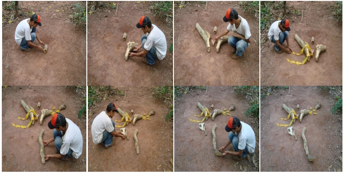
Figura 21. Fragmento fotográfico de la intervención 3

El desarrollo de la tercera intervención consistió en la producción de una figura humana masculina en donde se empleó una vez más elementos orgánicos y materiales naturales (ramas de árbol, hojas secas y huesos de res). Con el propósito de construir una imagen escultórica que muestre, como en lo afirmado por Regis Debray “El nacimiento de la imagen está unido desde el principio a la muerte” 11 el vestigio de una figura de un cuerpo descuartizado.