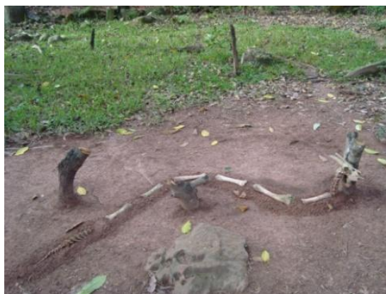
Figura 18. Serpenteo voraz 2012, escultura

Esta intervención consiste en la construcción de una escultura en forma de serpiente compuesta con elementos orgánicos, materiales vegetales y minerales, tales como: (ramas de árbol, piedras, tierra, huesos de res, huesos de perro y cráneo de cabra). Para dar la impresión de una figura de reptil depredador que se desplaza por el lugar buscando a su presa.