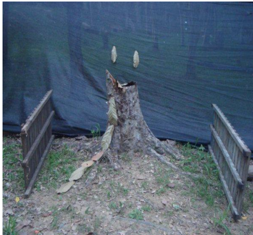
Figura 2. Fotografía de ejercicio escultórico