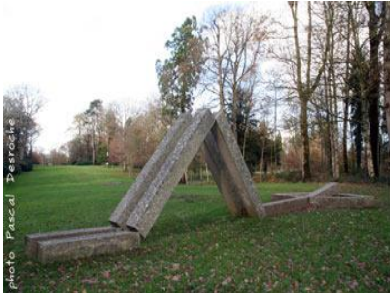
Figura 5. Markus Raetz, Mimi, 1979.

Otro referente artístico es Markus Raetz, con su obra Mimi, este artista construye sus esculturas en espacios abiertos, como en lo dicho por el curador José Roca, “La escultura en campo expandido tal como la definiría la teórica norteamericana. Rosalind Krauss en su conocido ensayo homónimo” 5 . Es así como Markus Construye sus esculturas con elementos que la naturaleza va dejando de paso en su etapa de vida y muerte: hojas, ramas, troncos etc. Con estos objetos compone delicados dibujos en donde la ocurrencia de la línea se da por la forma del material elegido.