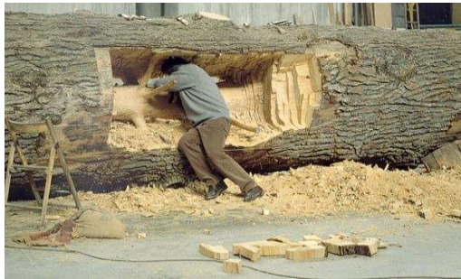
Figura 7. Giuseppe Penone, En la vida escondida dentro, 1973

Encuentro importante incluir como referente artístico, a Giuseppe Penone con su obra escultórica (En la vida escondida dentro), 1973 como en lo afirmado por Jaimes Sabines “Los arboles esperan, tu no esperes este es el tiempo de vivir el