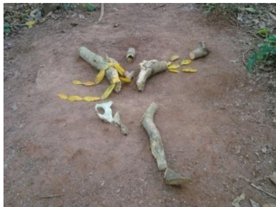
Figura 22. Vestigio mortal 2012, escultura

El desarrollo de la tercera intervención consistió en la producción de una figura humana masculina en donde se empleó una vez más elementos orgánicos y materiales naturales (ramas de árbol, hojas secas y huesos de res). Con el propósito de construir una imagen escultórica que muestre, como en lo afirmado por Regis Debray “El nacimiento de la imagen está unido desde el principio a la muerte” 11 el vestigio de una figura de un cuerpo descuartizado.