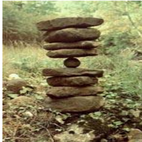
Figura 8. Andy Goldsworthy

Otro artista que creo conveniente citarlo es Andy Goldsworthy, quien interviene los entornos naturales enfatizado en lo efímero y los cambios del tiempo factores fundamentales que tiene en cuenta y que aplica en sus intervenciones en el espacio. Tal como lo anuncia el movimiento artístico Land Art. “La mayoría del Land art es efímero, no sobrevive el paso del tiempo, pues desaparece debido a la erosión del terreno, la lluvia, las mareas o porque el propio artista desarma su obra una vez cumplido su propósito.” 8 . Con sus obras o las fotografías de estas, Goldsworthy comunica la idea de que existe un enlace esencial entre naturaleza y hombre.