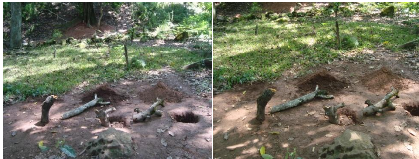
Figura 13. Fotografías de seguimiento de las Intervenciones

Se toma la determinación de continuar con las intervenciones en la zona verde determinada, sacando provecho a esquemas de dibujos traídos a la mente producidos por el estado de preocupación, necesidad de empezar a plasmar un mensaje a través de mi expresión artística a este espacio que se encuentra contaminado, sin importar la temprana reacción destructiva de las personas, ante la aparición de la obra, como se puede observar en las fotografías de seguimiento (ver Figura 11).