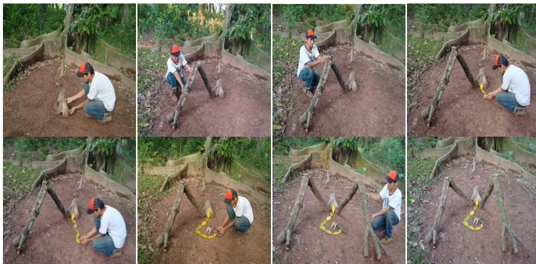
Figura 19. Fragmento fotográfico de la intervención 2

Esta segunda intervención se basa en la elaboración de una figura humana femenina creada con materiales vegetales y elementos orgánicos, (ramas de árbol, hojas secas, huesos de res, cráneo de perro). Que exhibe como en lo dicho por Lowell “Todo hombre nace con el germen de la obra que ha de cumplir en esta vida.” 10 . Una imagen escultórica, que representa una silueta de mujer en posición de alumbramiento a un engendro de muerte.