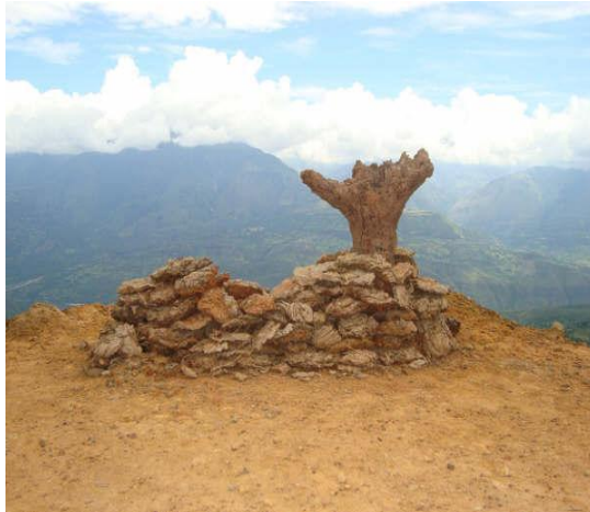
Figura 1. Fotografía de ejercicio escultórico