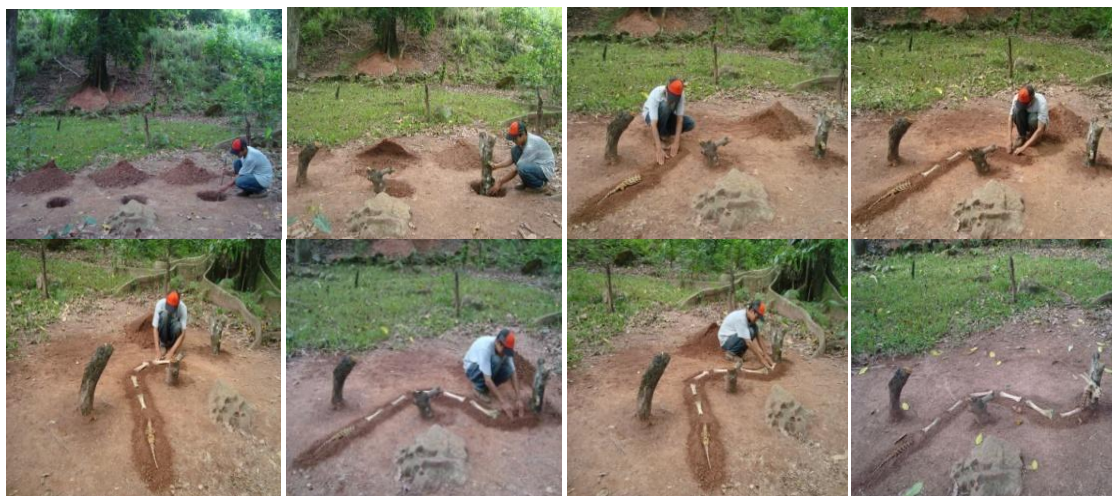
Figura 17. Fragmento fotográfico de la intervención 1

Esta intervención consiste en la construcción de una escultura en forma de serpiente compuesta con elementos orgánicos, materiales vegetales y minerales, tales como: (ramas de árbol, piedras, tierra, huesos de res, huesos de perro y cráneo de cabra). Para dar la impresión de una figura de reptil depredador que se desplaza por el lugar buscando a su presa.