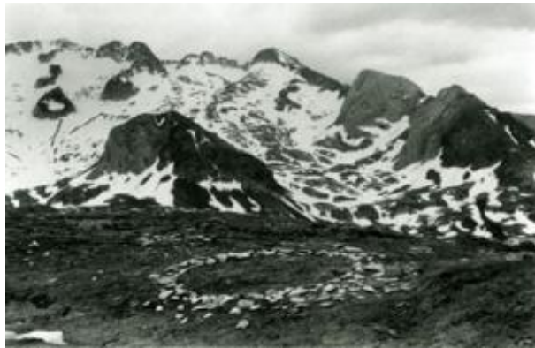
Figura 4. Richard Long un círculo en Islandia, 1974