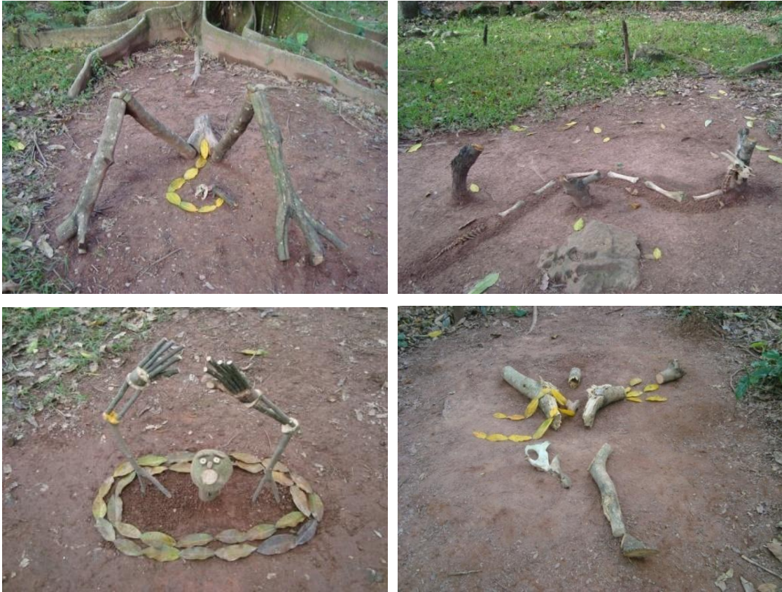
Figura24.Fotografías del resultado final de las 4 Intervenciones