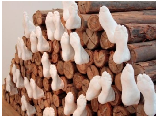
Figura 6. Frédéric Meynier, El reposo, 1992

El siguiente artista retomado como referente artístico para orientar el desarrollo de la propuesta artística es Frédéric Meynier, su obra escultórica el reposo 1992, llama la atención por los siguientes aspectos: como en lo especulado por Blaise Pascal “Nuestra naturaleza está en movimiento. El reposo absoluto es la muerte.” 6 . La despreocupación por el material con el cual construye su obra y encuentra en la forma que toma la escultura, la manera adecuada de satisfacer lo que podría ser llevado a un límite de provocación formal.