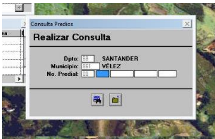
Figura 6. Consulta en el software de estratificación rural.

Para expedir los certificados de estratificación urbana se hace uso del plano de Estudio de Estratificación Urbana en el cuál se encuentra dividido el municipio de Vélez en manzanas y se encuentran señalizadas las calles y carreras como es posible observar en la figura 7. Por lo tanto, se realiza la búsqueda del predio con la dirección del mismo y por medio de las convenciones (figura 8) se puede estratificar el predio. Al igual que en el certificado de estratificación rural, en este se obtiene el código catastral, la ubicación del predio, el estrato del mismo y los datos del solicitante.