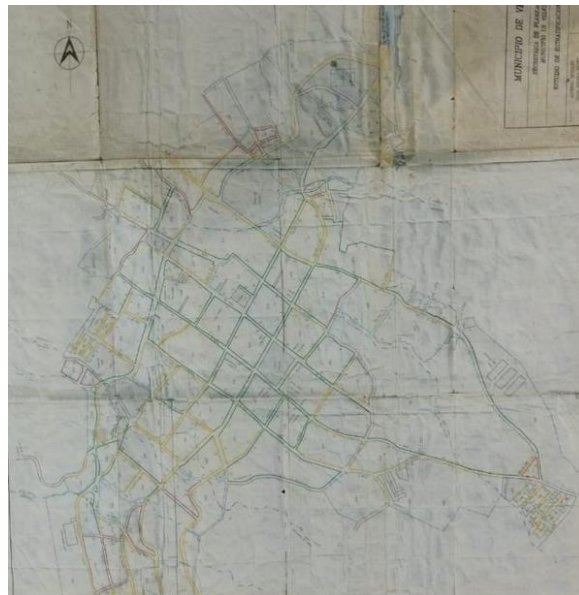
Figura 7. Plano de Estudio de Estratificación urbana.