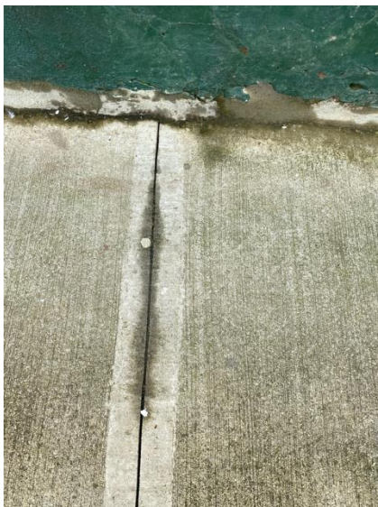
Figura 5. Filtración de agua en el andén.