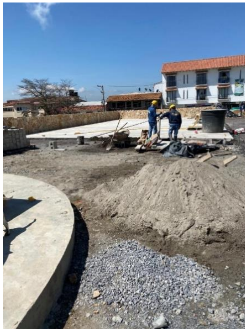
Figura 10. Proceso constructivo de la plazoleta mirador del parque principal del municipio de Vélez.