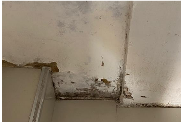
Figura 3. Humedad en zona baja de las paredes.

afectaciones al local y si les corresponde que puedan brindar una pronta solución a este problema.