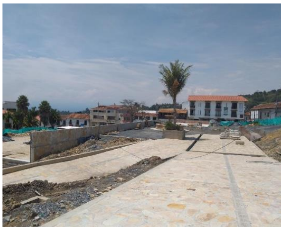
Figura 11. Proceso constructivo de la plazoleta de sombras del parque principal del municipio de Vélez