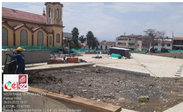
Figura 9. Proceso constructivo de la plazoleta de eventos del parque principal del municipio de Vélez.