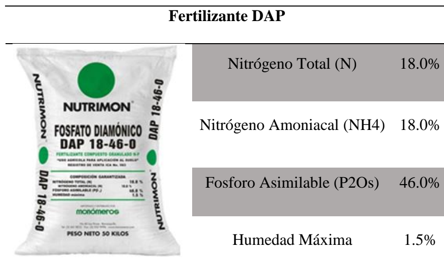
Composición Fertilizante DAP

Nota. Tomado de Ficha Técnica DAP 18-46-0, por Nutrición de Plantas S.A., 2013.