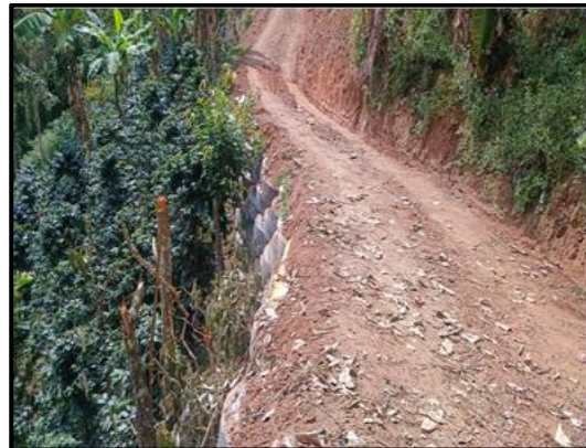
Figura 6. Vías de acceso “Finca Buenos Aires”.

Para el desarrollo de todas las actividades se debe contar con un permiso que verifique que se pueden realizar estos trabajos en la zona, en este caso se debe tener un permiso expedido por la curaduría municipal donde se especifica a detalle el movimiento de tierra a realizar y en cuanto magnitud, es decir, longitud de apertura de vía, volumen máximo de excavación, diseño de obras de contención si es necesario, además, un plano que muestre a detalle los puntos importantes del