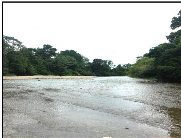
Figura 10. Parte 4: Explotación minera y ocupación de cause “Quebrada la Tigra”.

Se indagó sobre los documentos que verifiquen que se puede realizar la actividad en el lugar, encontrando que no existe ninguno; al respecto es importante mencionar que el lugar sobre el cual se está realizando la extracción del material pétreo, no está contemplado como sitio aprobado para la extracción de dicho material, observando que el mismo no se encuentra