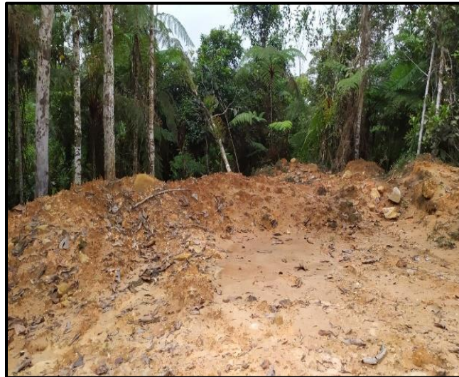
Figura 19. Parte 3: Residuos RCD y Vertimientos, Panamá – Rionegro.

Los residuos vertidos contaminan el afluente hídrico y deterioran la calidad del agua, estos son considerados residuos de construcción y demolición RCD y para ellos existen depósitos específicos donde uno de los usos más frecuentes es el reciclaje de materiales, teniendo en cuenta su clasificación y con la finalidad de prevenir riesgos sanitarios para así proteger y promover la