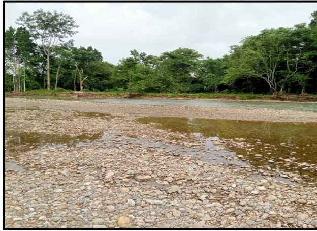
Figura 9. Parte 3: Explotación minera y ocupación de cause “Quebrada la Tigra”.

Por otra parte, como se evidencia en Figura 10, se nota que por el cauce de la fuente hídrica y, haciendo contacto directo con la lámina de agua, se están pasando todo tipo de vehículos (tractomulas, doble troque, camionetas, motos, entre otros), a lo cual se informa por la comunidad que corresponde al acceso que se ha venido usando para llegar hasta las instalaciones de “Campo Bonanza” propiedad de la empresa que realiza las intervenciones.