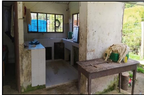
Figura 13. Ronda Hídrica, Aguablanca – El Playón: construcciones encontradas en la zona.

Siguiendo el levantamiento, se encuentran cuatro pozos de los cuales dos se contemplan en la Figura 14. Estos pozos están contruidos en terreno natural y recubiertos con geo-membrana o liner (plástico negro) invadiendo también la faja protectora de la fuente hídrica, en su alrededor costales llenos de arena actúan como anclaje de la geo-membrana; dos (2) de estos pozos son de dimensiones de 14.2x5x1.8 metros y contienen aproximadamente catorce mil (14.000) truchas de levante y los otros dos (2) con dimensiones de 17x6.3x2 metros en los cuales se encuentran alrededor de nueve mil (9.000) truchas para sacrificio; el sistema de llenado de estos pozos se realiza a través de tubos PVC corrugados de 8” (pulgadas), captación que proviene de otra fuente hídrica que se encuentra cerca de la que está siendo afectada. Para esto se pide el documento que conceda el permiso de captación de agua de la fuente hídrica implicada sin tener respuesta, esto aplica a una captación ilegal del recurso. Continuando con la visualización en la Figura 15, se ve un canal que recorre de manera longitudinal y de forma casi paralela a la fuente hídrica observando invasión de ronda hídrica permanente con un canal fundado en concreto, con compuerta para control de caudal ubicada al costado derecho de la fuente hídrica, que conduce hacia un desarenador preliminar sobre el cual hay una entrada de agua a través de una tubería corrugada de