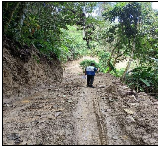
Figura 4. Movimiento de tierras “Finca Buenos Aires”.

En algunos tramos del eje vial generado, se ve con notoriedad que los residuos producto de los trabajos realizados no fueron ubicados en zonas de disposición de material y este rodó por gravedad hacia las fuentes hídricas circundantes, causando afectaciones en la calidad del agua, de manera similar en la conformación de taludes de más de 4 metros de altura como se ve en la Figura 5.