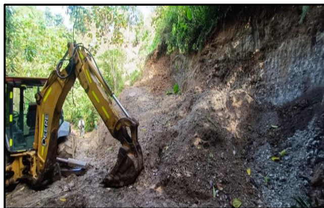
Figura 5. Excavación de tierras “Finca Buenos Aires”.

Además, no se realizaron labores de control de aguas de escorrentía ocasionando desmoronamientos de material y generando inestabilidad, esto debido a que también se encuentran perfilados en un ángulo de inclinación cerca de los 90° grados, pendiente que sobrepasa el rango