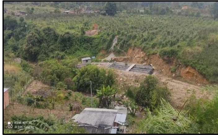
Figura 12. Ronda Hídrica, Aguablanca – El Playón: visita a campo.