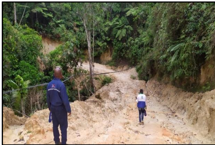
Figura 17. Parte 2: Residuos RCD y Vertimientos, Panamá – Rionegro.