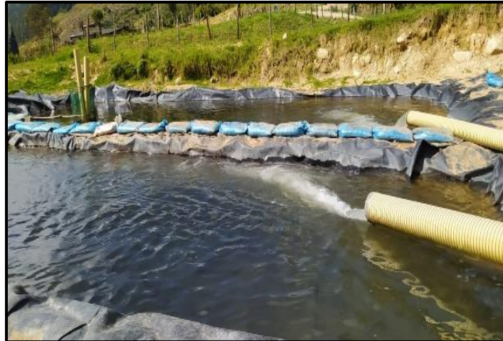
Figura 15. Parte 2: Ronda Hídrica, Aguablanca – El Playón: sistema de tuberías encontrado en la zona.

Figura 14. Parte 1: Ronda Hídrica, Aguablanca – El Playón: sistema de tuberías encontrado en la zona.