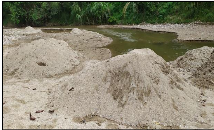
Figura 8. Parte 2: Explotación minera y ocupación de cause “Quebrada la Tigra”.