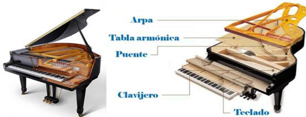
Figura 1. Partes del piano