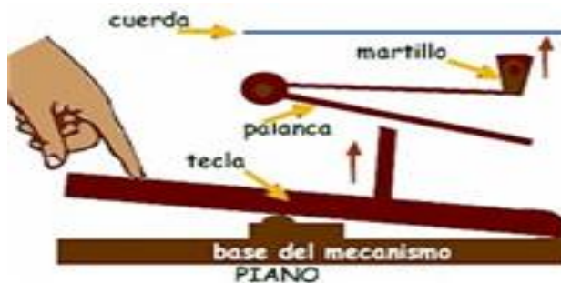
Figura 2. Mecanismo del Piano