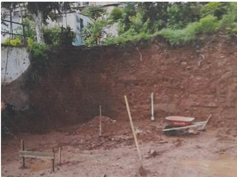
Fotografía 1. Perfilación de taludes sin estabilizar.

En la actualidad el propietario del predio de la construcción mencionada se encuentra en el proceso legal para tramitar la licencia contando con el apoyo y supervisión de la secretaría de planeación e infraestructura del municipio de Rionegro Santander, la cual a su vez cuenta con 45 días hábiles para revisar y