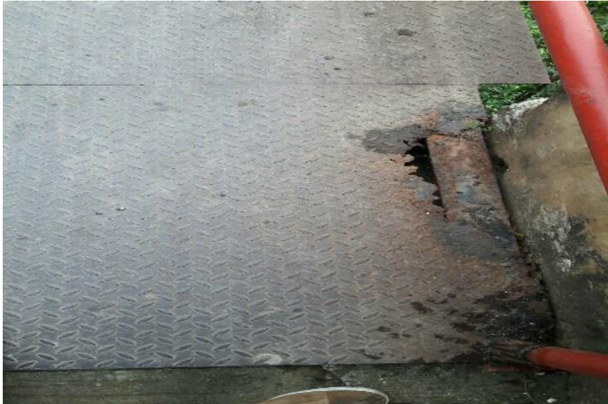
Fotografía 10. Corrosión en el tablero del puente metálico vereda Bocas.

En la visita se observó deterioro en el tablero metálico del puente por corrosión del material, daños en las barandas de apoyo del puente y cables sin tensión afectando la estabilidad y resistencia del mismo.