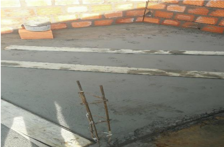
Fotografía 8. Mejoramiento de vivienda rural vereda Bocas.

A la fecha de hoy se ejecutó el 100% de la obra beneficiando a las familias seleccionadas por la administración municipal, el proyecto se cerró con un resultado muy favorable para el bienestar y la calidad de vida de la comunidad de las veredas mencionadas, el contratista cumplió con lo consignado en los diseños iniciales y con el tiempo previsto para entregar la totalidad de la obra concluyendo un excelente proyecto de mejoramiento de vivienda rural.