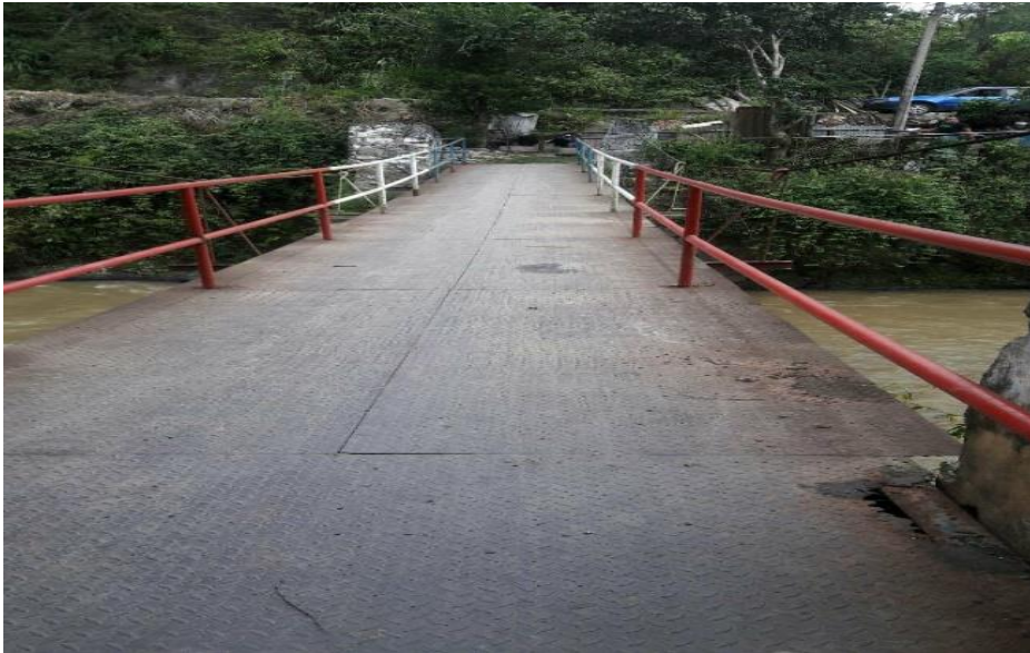
Fotografía 9. Puente metálico Vereda Bocas, Rionegro Santander.

Atendiendo la solicitud de la comunidad la alcaldía municipal designó a 3 funcionarios incluido el practicante para realizar la visita de inspección ocular.